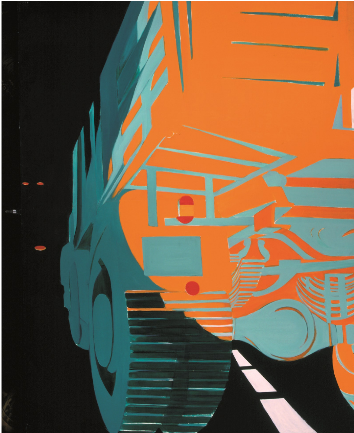
Titina Maselli, Camion in una strada (Camion) , 1968, olio su tela, 201 x 401 cm, Firenze, Museo Novecento.

Si evidenziano poi diversi tratti comuni a tutta la raccolta capaci di rendere Arte italiana un autentico antimanuale, a partire dalla scelta di una scrittura a più mani – ben sedici gli autori e le autrici – che rompe con i tradizionali binomi della manualistica nostrana per entrare nel solco delle più solide esperienze internazionali. A ciò si aggiunge la commistione di due generazioni diverse di studiosi e studiose, i cui contributi si distinguono per provenienza accademica e orientamento metodologico, ma risuonano assieme con la “ricchezza interpretativa e la polifonia narrativa” (p. 16) indispensabile per rifuggire facili