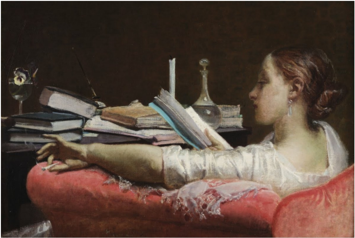
Federico Faruffini, Lettrice (Clara), 1865, olio su tela, 40,56 x 59 cm, Milano, Galleria d'Arte Moderna.