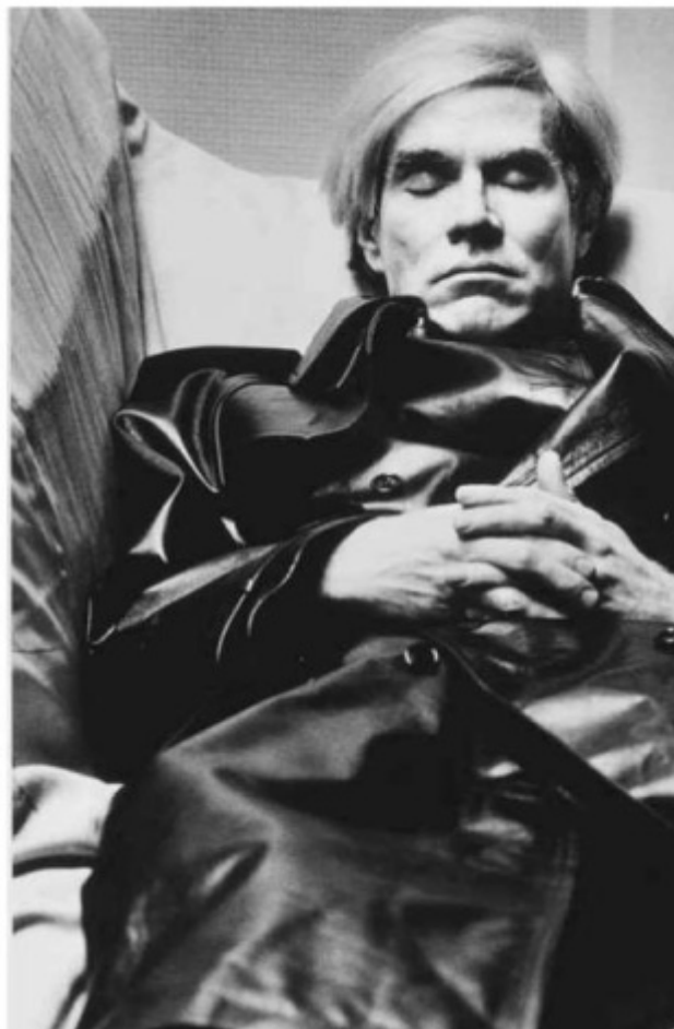
Andy Warhol ostenta le ferite procurategli da Valerie Solanas.

Valerie Solanas ha lasciato soltanto questi tre testi, anche loro torturati da chi avrebbe dovuto capirli, ma era un essere di scrittura . Quando è morta era rinchiusa con la propria macchina da scrivere e centinaia di pagine scritte che la madre ha fatto bruciare. Tutto il suo percorso biografico, medicina e giustizia comprese, autorizza a considerarla come Vincent van Gogh e Antonin Artaud una “suicidata dalla società”. Degno di nota è il fatto che avesse rinunciato a scrivere un romanzo autobiografico, che sarebbe stato a dir poco drammatico, e preferito mantenere un tono di commedia o di farsa, ovvero una chiave comico-grottesca.