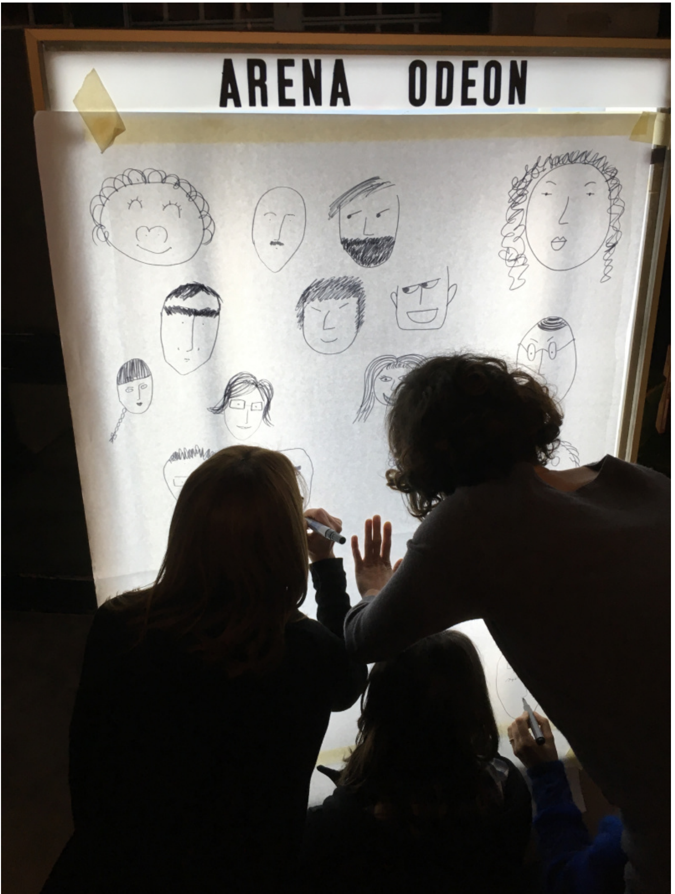
Disegnare per empatizzare