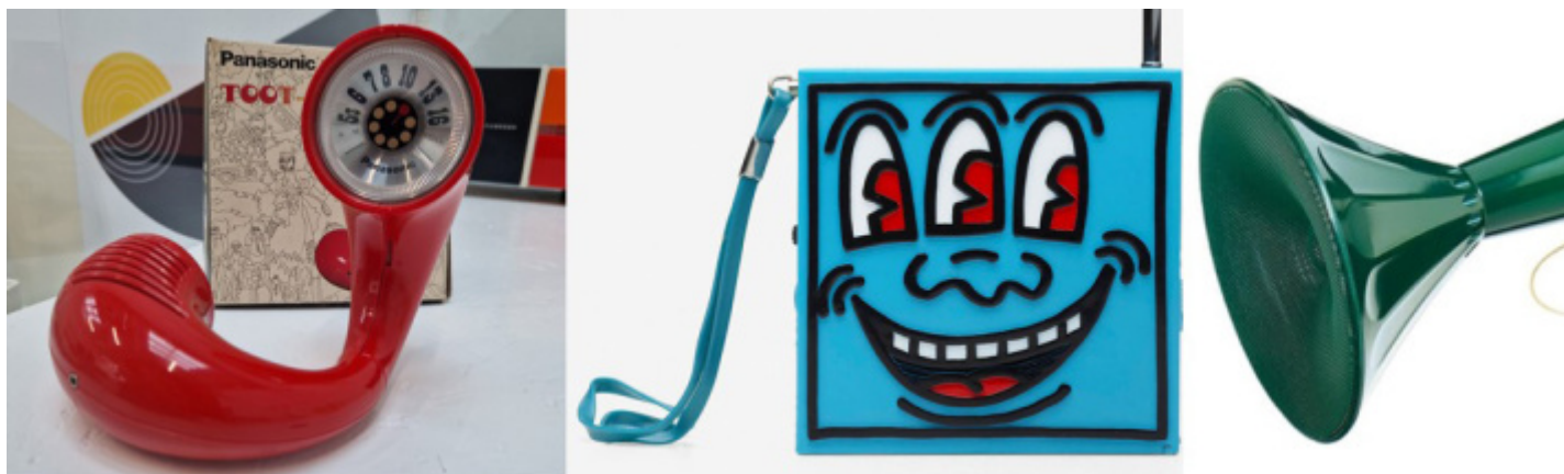
Da sinistra: radio Toot-a-Loop R-72 , prodotta da Panasonic nei primi anni '70; Keith Haring, Pop-Shop Radio , 1985; Philippe Starck per Thomson, radio La La La , 1995.

Tra i 50 apparecchi radiofonici esposti, ve ne sono alcuni davvero divertenti, come la Toot-a-Loop R-72 , prodotta da Panasonic nei primi anni '70 che poteva anche essere avvolta attorno al polso a mo' di braccialetto; la Pop-Shop Radio , disegnata da Keith Haring nel 1985; la radio La La La , progettata da Philippe Starck nel 1995 per Thomson, ed altre ancora.