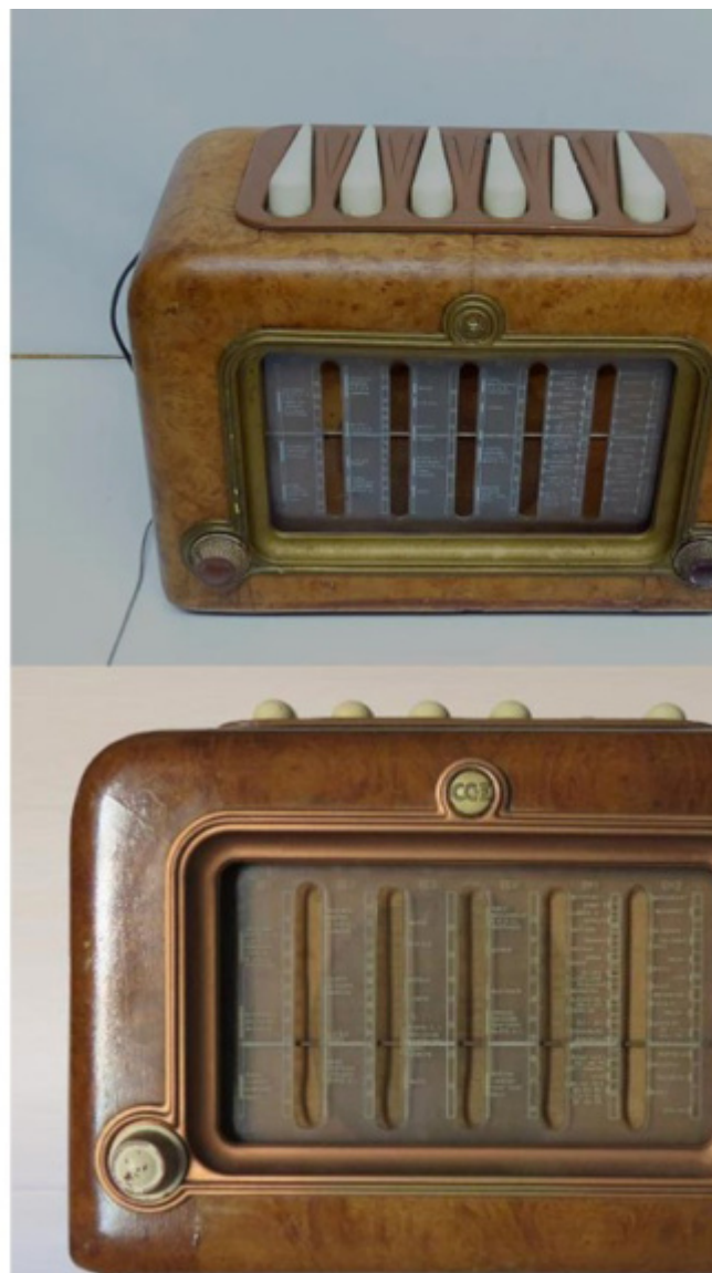
Locandina pubblicitaria delle radio Ducati, 1946; Piero Bottoni, radio Supergioiello 195 , per CGE, 1951.

Una delle curiosità della rassegna milanese consiste nel far scoprire al grande pubblico come la Ducati, tra le più prestigiose industrie italiane di motociclette, abbia in realtà, esordito come produttrice di radio, con il nome di Società Scientifica Radio Brevetti Ducati . Così si legge sul sito del brand: “Nel primo ‘900 a Bologna c’è un gran fermento sul settore elettronico. Guglielmo Marconi è osannato in tutto il mondo per l’invenzione della radiotelegrafia.