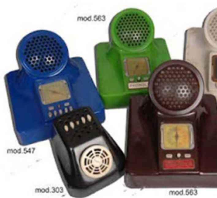
Radio di Cristallo , realizzata da Franco Albini nel 1938; vari modelli della radio Phonola detta Castiglioni , progetto di Luigi Caccia Dominioni, Livio e Pier Giacomo Castiglioni, 1940 e segg.

Anche se il suo aspetto non è supermoderno, non posso non ricordare la radio della mia infanzia e soprattutto della mia adolescenza: la Supergioiello 195 , disegnata da Piero Bottoni per CGE nel 1951. Ricordo ancora il tavolino su cui poggiava, entrando in cucina stava a destra della porta. Proprio davanti a lei mi sedevo ad ascoltare Bandiera Gialla , alle 17 e 40 dei pomeriggi di tutti i sabati. La sua forma classica era rassicurante, sapeva di casa: era casa , nel senso anche architettonico, non solamente domestico, ma questa virtù delle opere del maestro Bottoni l'avrei capita dopo. E, come tutti i suoi progetti era molto raffinata e al contempo funzionale, senza che nessuno di questi attributi fosse esibito. Se ne stava lì, nel suo silenzio discreto, pronta ad emettere i suoni agognati. Sebbene non sia presente nella mostra milanese un esemplare è esposto al MILS (Museo delle Industrie e del Lavoro Saronnese).