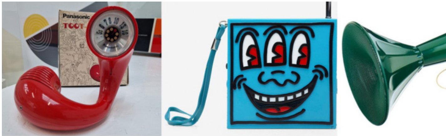
Da sinistra: radio Toot-a-Loop R-72 , prodotta da Panasonic nei primi anni '70; Keith Haring, Pop-Shop Radio , 1985; Philippe Starck per Thomson, radio La La La , 1995.

Tra i 50 apparecchi radiofonici esposti, ve ne sono alcuni davvero divertenti, come la Toot-a-Loop R-72 , prodotta da Panasonic nei primi anni '70 che poteva anche essere avvolta attorno al polso a mo' di braccialetto; la Pop-Shop Radio , disegnata da Keith Haring nel 1985; la radio La La La , progettata da Philippe Starck nel 1995 per Thomson, ed altre ancora.