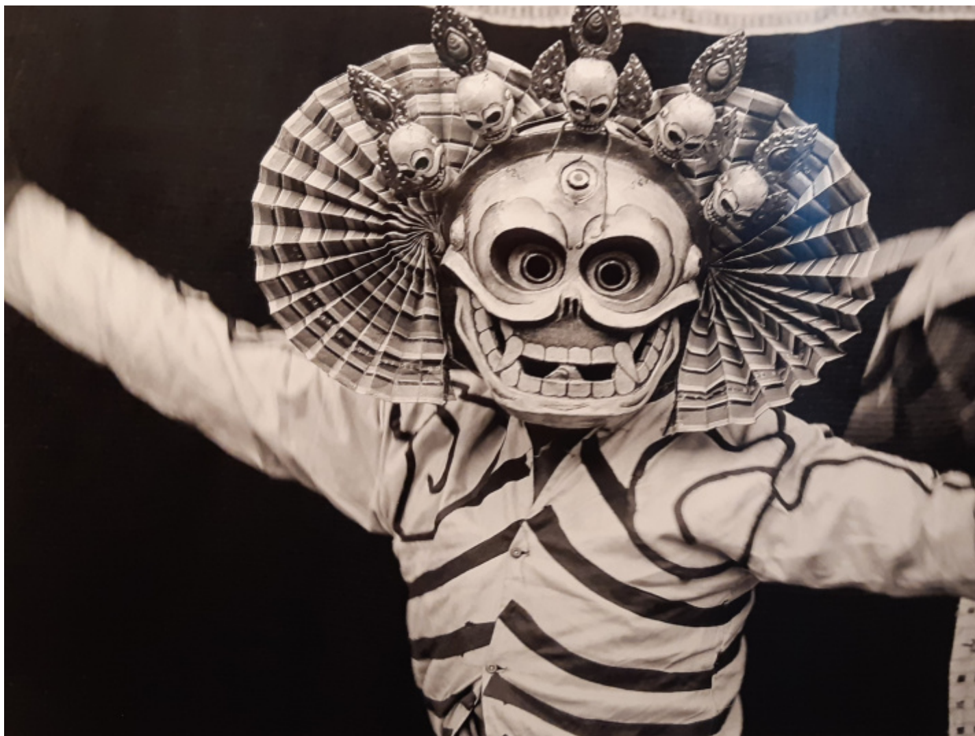
La danza dello scheletro, 1948 (Da “Segreto Tibet”), ph Gigliola Foschi.