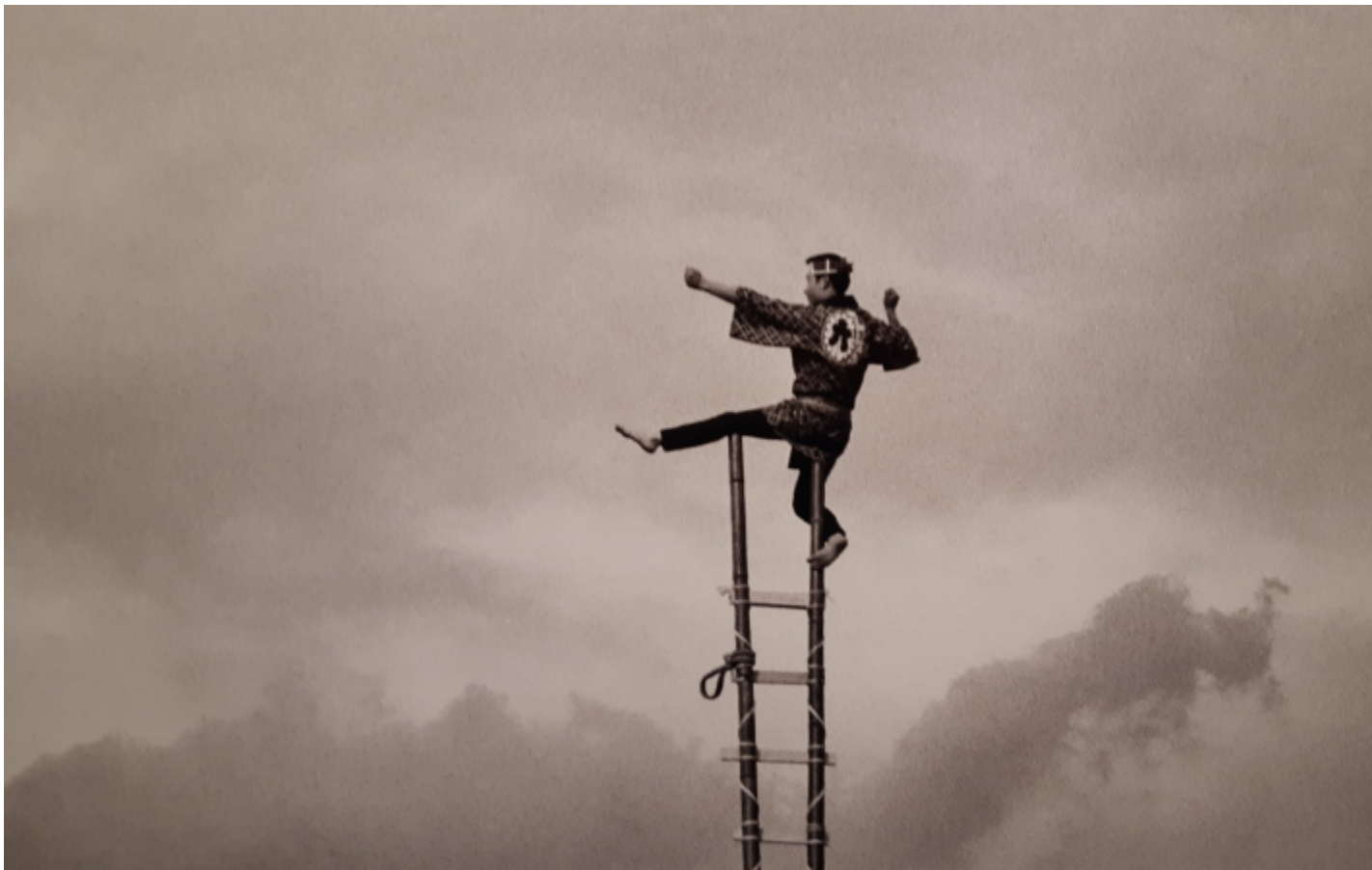
La lotta contro il nulla, 1963 (da "L'eterno Giappone"), ph Gigliola Foschi.

Finché alla fine del 1999, quando Maraini ha ormai 87 anni, accade un evento portentoso: Mondadori pubblica d'improvviso un suo romanzo autobiografico: Case, amori, universi (riedito nel 2019 da La Nave di Teseo): settecontocinquanta lievissime, luminose pagine, capaci di trascinare il lettore in un viaggio commosso ed esaltante, che dalla Firenze degli anni Venti si spinge fino in Tibet, in Giappone, per poi concludersi nell'Italia del dopoguerra. Un libro che di colpo si presentò sulla scena letteraria italiana con il respiro di un classico, e che venne accolto come una festa per la nostra letteratura. Ricordando Ippolito Nievo, veniva da parlare di Confessioni di un ottuagenario. Purché si tenga presente che ci trovavamo di fronte a un ottuagenario vitalissimo, il quale, forse proprio grazie al doppio amore per l'Italia e per l'Oriente, aveva saputo mantenere intatta, dai primi viaggi fino a quest'ultimo capolavoro, la passione per la vita e per la conoscenza, la mania di andare a vedere popoli, civiltà, religioni diverse, tanto da raggiungere davvero le radici assolute delle cose, tanto da proporci una nuovissima visione del Novecento. E in effetti, dall'uscita di Case, amori, universi in poi, si sono susseguite senza posa le riedizioni, le mostre fotografiche, i saggi critici dedicati ad approfondire sempre più la figura di Fosco Maraini.