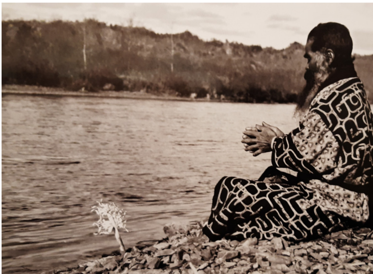
Preghiera ai kamuy del fiume Saru (da “Un Citluyit atterra in Hokkaid?”).