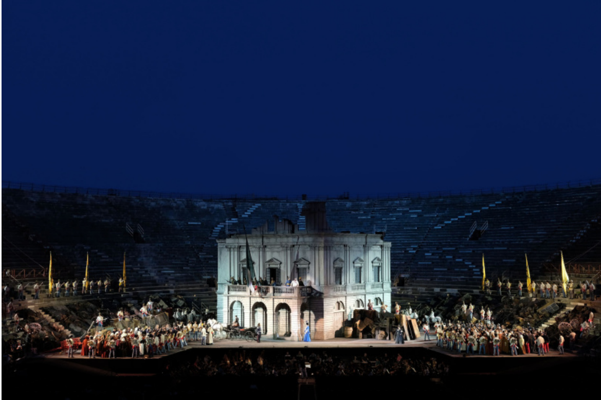
“Nabucco” di Verdi all’Arena di Verona, 2017. Il regista Arnaud Bernard ha ambientato la storia durante le Cinque Giornate di Milano. Al centro della scena, una riproduzione del Teatro alla Scala.

defunta più volte durante il XX secolo, a partire quanto meno dalla prima esecuzione dell'incompiuta Turandot di Puccini, alla Scala nel 1926 e poi, per esempio, in occasione della scomparsa di Maria Callas nel 1977, l'opera - argomenta Sala - conserva invece un irresistibile fascino, probabilmente collegato «alla sua supposta, irrimediabile decadenza». Per dirlo con le parole di Dolar e Žižek citate dall'autore, «[...] L'opera è un fenomeno molto più grande e complesso di quanto non lo fosse quando era in vita, e più è morta, più rifiorisce».