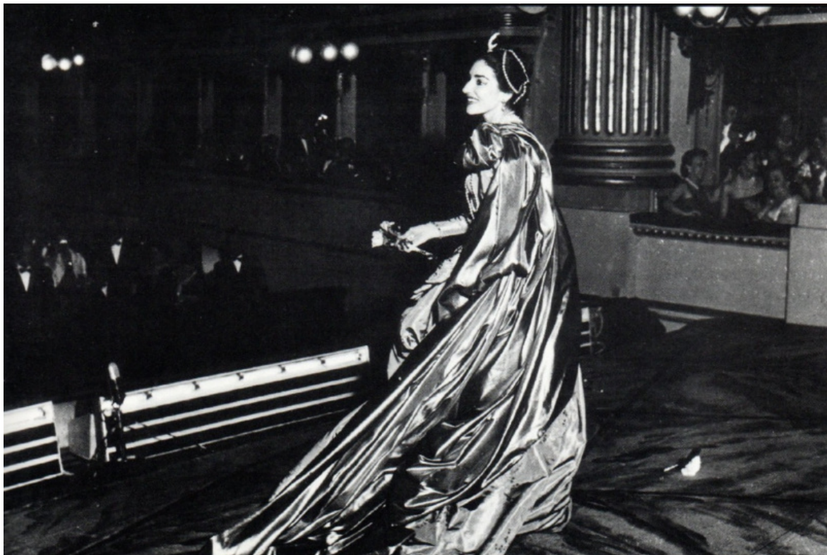
Maria Callas nel 1957 alla Scala dopo "Ifigenia in Tauride" di Gluck.

In molti casi, gli argomenti storico-musicologici sono sostenuti anche da un approccio metodologico di natura psicoanalitica, con Jacques Lacan come nume tutelare. Per capire le ragioni di una persistenza come quella operistica, che ha un carattere spesso irrazionale, è in effetti utile un ragionamento nel quale gli elementi formali, estetici e storici vengano illuminati anche da approfondimenti su quanto di inconscio caratterizza l'appropriazione di un "prodotto culturale" così particolare.