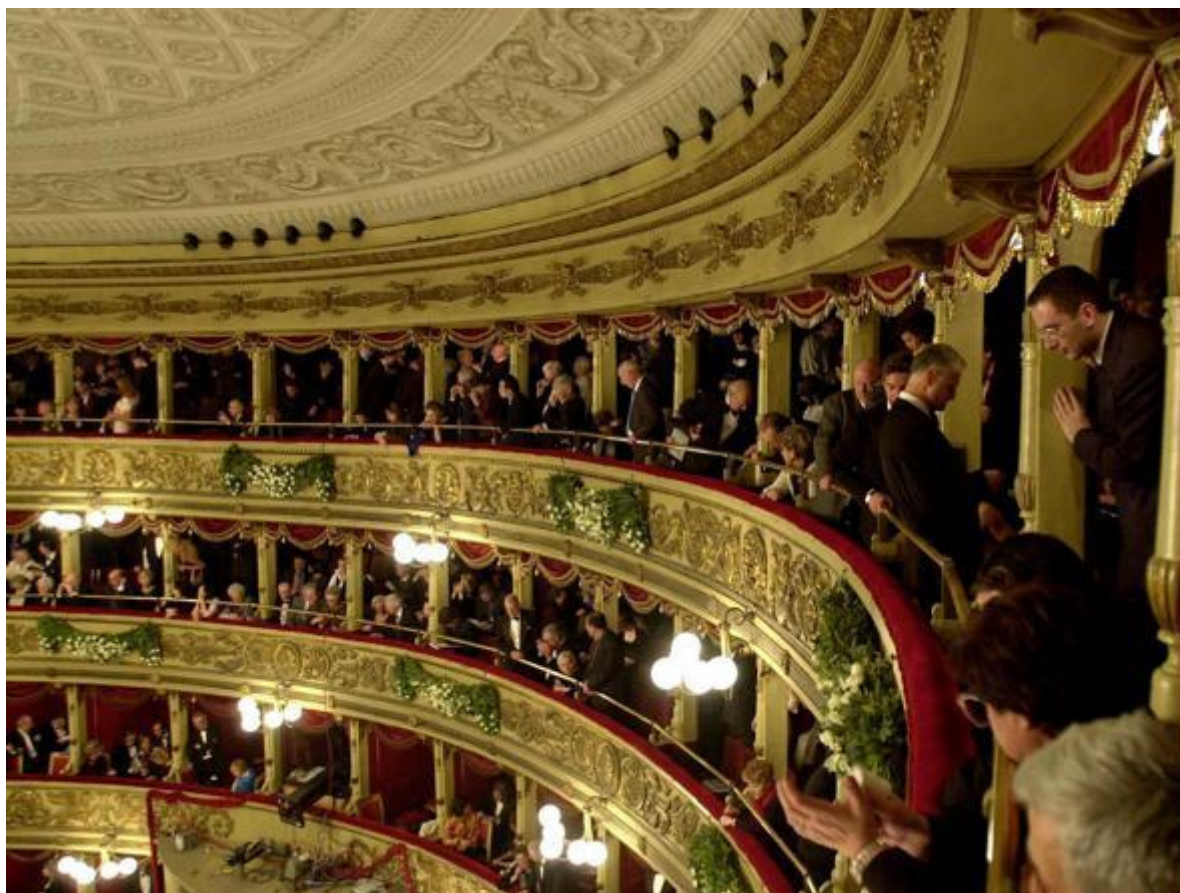
Il loggione del teatro alla Scala di Milano.

I più importanti operisti del secondo Ottocento e del primo Novecento (Verdi, Wagner, Puccini...) avevano sempre avuto un occhio di assoluto riguardo e nel caso del tedesco una funzione decisiva nella realizzazione teatrale dei loro lavori, ma dopo gli anni Dieci la figura del direttore d'orchestra ha assunto un ruolo centrale e totalizzante, mentre quella del regista ha cominciato a prendere piede solo dopo la Grande Guerra, e molto cautamente. Oggi, ammainate le ideali bandiere dei demiurghi dell'esecuzione musicale, l'avvento del "Regietheater" – nota acutamente Sala – ha finito per delineare una sorta di dissociazione fra le ragioni delle esecuzioni "storicamente informate", con il loro sguardo rivolto all'epoca in cui l'opera ha visto la luce, e quelle di rappresentazioni di gusto post-moderno, attente alle ambiguità di genere, attualizzanti, fortemente mediatizzate. Una dissociazione che non di rado provoca forti ripulse da parte dei melomani, spesso coalizzati nell'agorà dei social, terreno fertilissimo di qualunque pseudo specializzato.