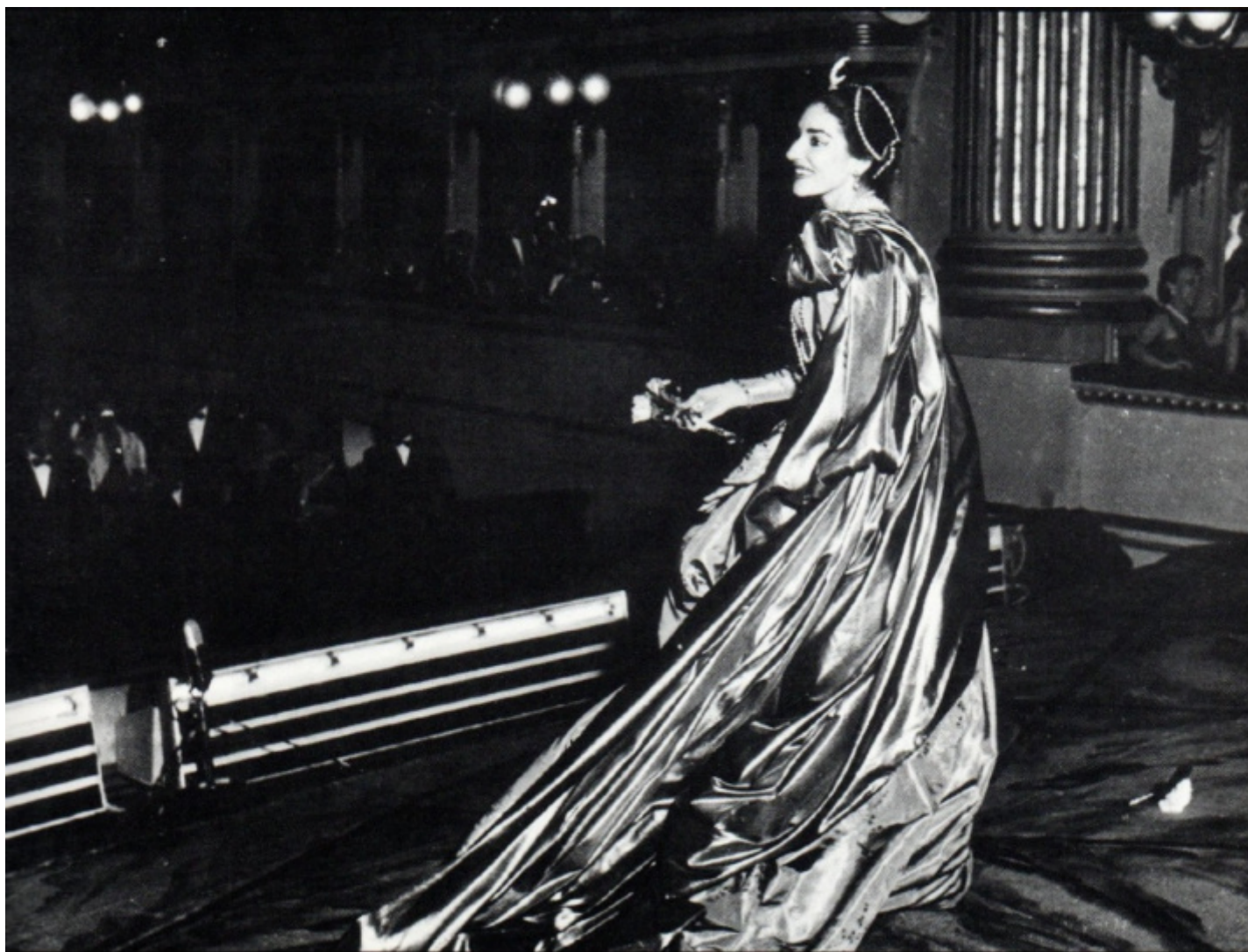
Maria Callas nel 1957 alla Scala dopo "Ifigenia in Tauride" di Gluck.

Centrali appaiono le argomentazioni su due elementi decisivi, la nascita dell'opera e la sua spesso proclamata morte. Il tema delle origini, annota Sala nelle Riflessioni conclusive , è questione storica e musicologica tuttora oggetto di discussione: c'è chi sottolinea le radici neoplatoniche oltre che tragiche del nuovo genere, nell'aristocratica Firenze della Camerata de' Bardi all'inizio del Seicento; ma c'è chi vede in esso (probabilmente con maggiore ragione) la confluenza di gusti teatrali compositi e spesso popolari nella Venezia dove entrò in funzione il primo teatro pubblico della storia, nel 1637.