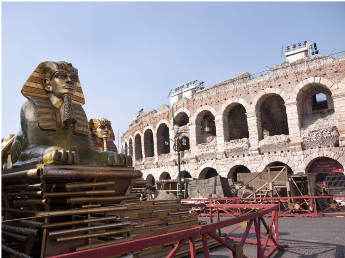
Scenografie per "Aida" all'esterno dell'Arena di Verona.

ma dopo gli anni Dieci la figura del direttore d'orchestra ha assunto un ruolo centrale e totalizzante, mentre quella del regista ha cominciato a prendere piede solo dopo la Grande Guerra, e molto cautamente. Oggi, ammainate le ideali bandiere dei demiurghi dell'esecuzione musicale, l'avvento del "Regietheater" – nota acutamente Sala – ha finito per delineare una sorta di dissociazione fra le ragioni delle esecuzioni "storicamente informate", con il loro sguardo rivolto all'epoca in cui l'opera ha visto la luce, e quelle di rappresentazioni di gusto post-moderno, attente alle ambiguità di genere, attualizzanti, fortemente mediatizzate. Una dissociazione che non di rado provoca forti ripulse da parte dei melomani, spesso coalizzati nell'agorà dei social, terreno fertilissimo di qualunquismo pseudo specializzato.