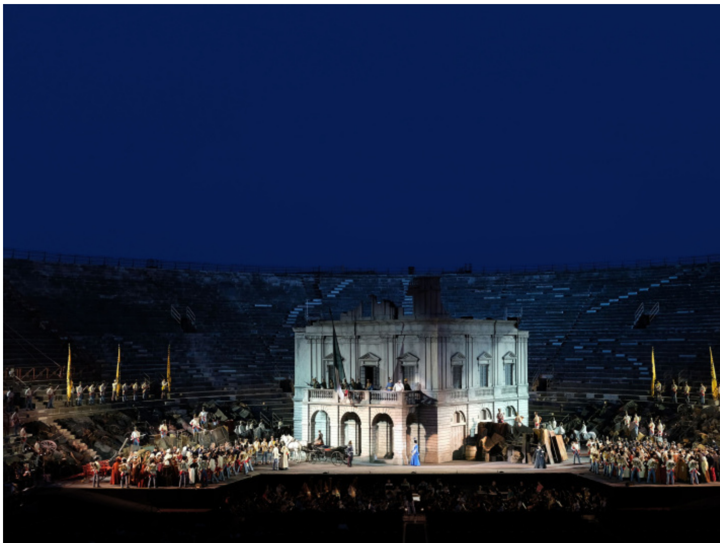
“Nabucco” di Verdi all’Arena di Verona, 2017. Il regista Arnaud Bernard ha ambientato la storia durante le Cinque Giornate di Milano. Al centro della scena, una riproduzione del Teatro alla Scala.