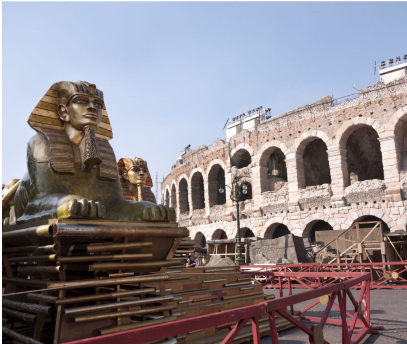
Scenografie per “Aida” all’esterno dell’Arena di Verona.

Il glossario proposto da Sala (in parte derivante, con ovvi ampliamenti, da una rubrica tenuta per un paio di anni sul mensile di informazione musicale Amadeus ) è configurato in maniera tale da non evitare nessuno dei temi caldi del discorso operistico odierno, sia dal punto di vista degli spettatori che da quello degli studiosi. Per citare i titoli di alcune voci, in questo libro si parla di Kitsch e di Mammismo , di Castrati e di Controtenori , di Political Correctness , di Claque e di Dilettanti , di Unesco e di Festival , di Fiaschi e di Primedonne . E tuttavia, nella varietà dei temi resta sempre evidente l’obiettivo dell’autore, al quale con tutta evidenza sta molto a cuore – e non si può che consentire – la conservazione anche nel XXI secolo del bene culturale chiamato opera.