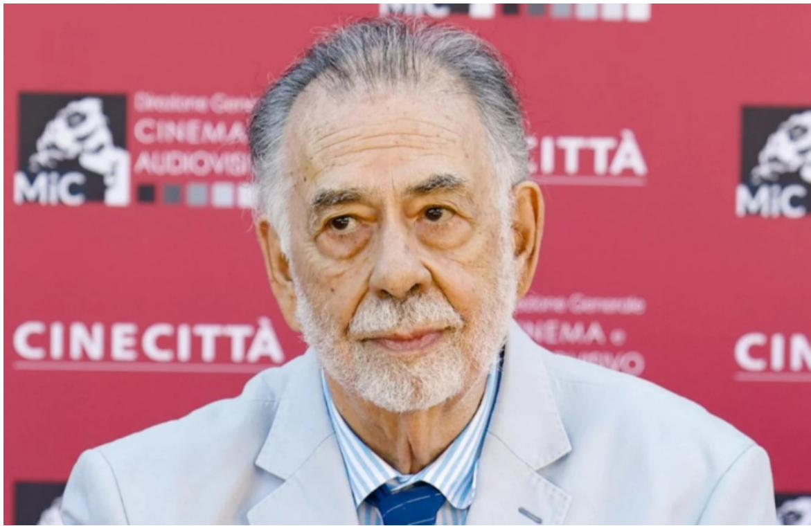
Coppola a Cinecittà in occasione della prima italiana del film.

Forse il fatto che Megalopolis di Francis Ford Coppola abbia suscitato, fin dalla prima a Cannes lo scorso maggio, delle reazioni tanto contrastanti e polarizzanti, non dice tanto del film in sé (che è certamente bizzarro, sopra le righe, e fuori registro secondo qualunque buona norma arthouse ) quanto di noi che lo guardiamo. Che cosa cerchiamo quando posiamo gli occhi su uno schermo? E perché? Forse è questo che bisognerebbe chiedere ai critici, indipendentemente dalle stellette e dal giudizio di valore che vengono dati a un film.