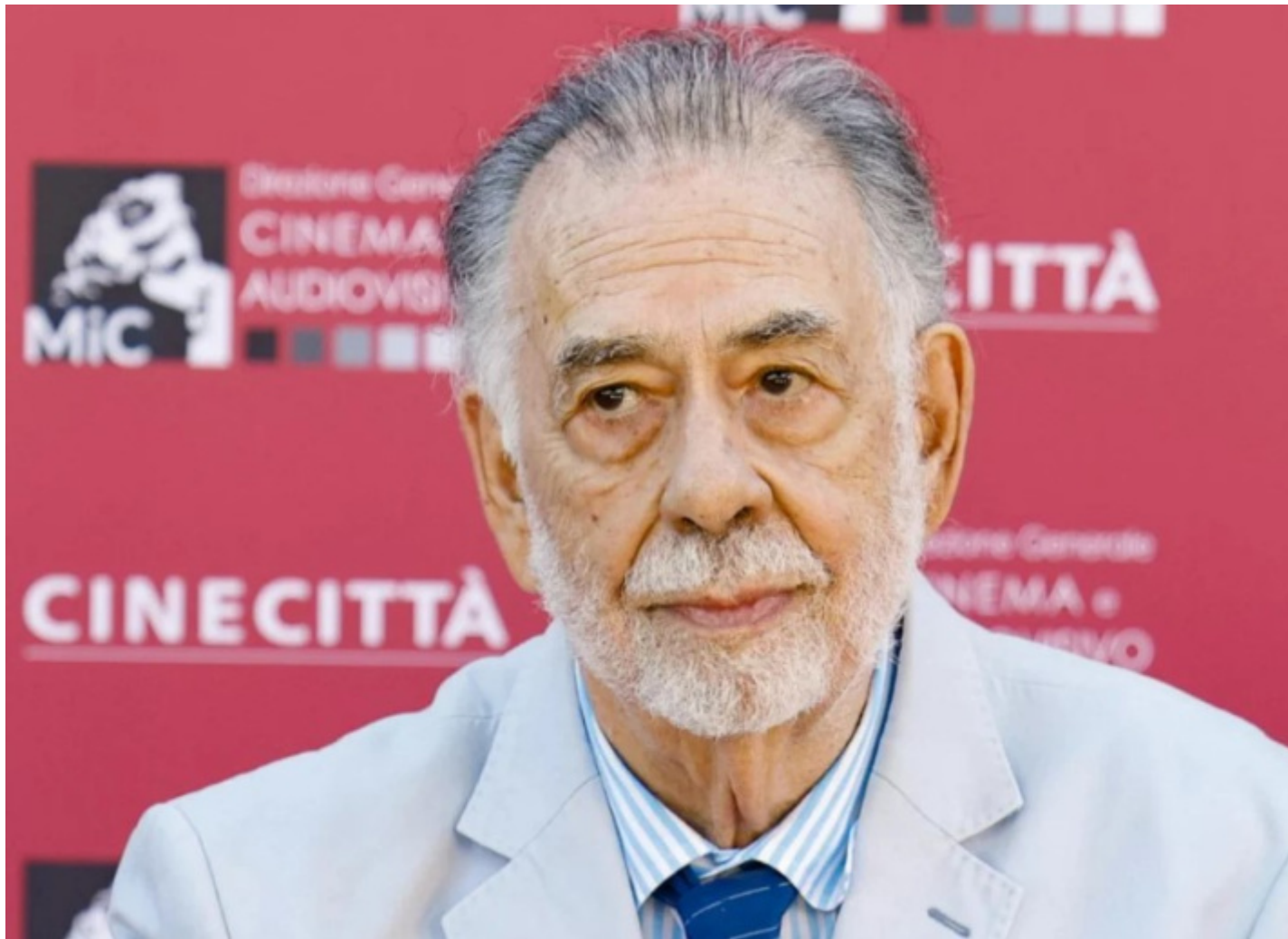
Coppola a Cinecittà in occasione della prima italiana del film.

Forse il fatto che Megalopolis di Francis Ford Coppola abbia suscitato, fin dalla prima a Cannes lo scorso maggio, delle reazioni tanto contrastanti e polarizzanti, non dice tanto del film in sé (che è certamente bizzarro, sopra le righe, e fuori registro secondo qualunque buona norma arthouse ) quanto di noi che lo guardiamo. Che cosa cerchiamo quando posiamo gli occhi su uno schermo? E perché? Forse è questo che bisognerebbe chiedere ai critici, indipendentemente dalle stellette e dal giudizio di valore che vengono dati a un film.