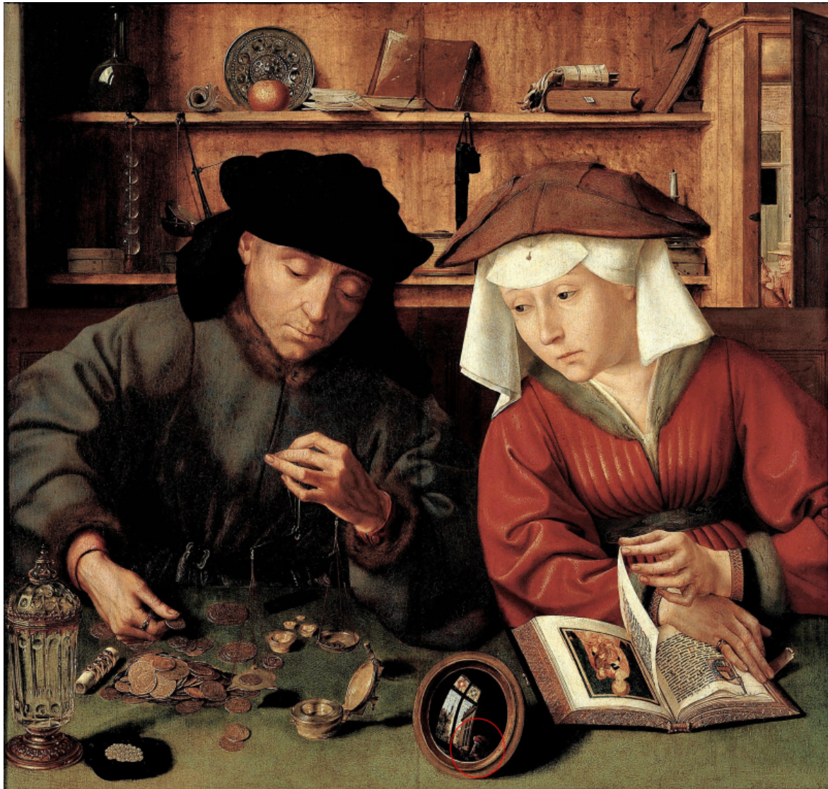
Quentin Massys, Cambiavalute e sua moglie (1514).

Certo, a tutte queste forme di “secolarizzazione”, di “immaginazione totale”, di spettacolarizzazione indotta dal pensiero apocalittico, «alla statica dell'aspettativa e dello spettacolo, all' escatologia fredda della Grande Chiesa, il pensiero apocalittico opporrà, dopo gli sfavillanti inizi del libro di fuoco dell'Apocalisse, la riscoperta dell' escatologia calda del Millennio» (ivi, p. 174), e vediamo sorgere Giovanni di Patmos, Gioacchino da Fiore e Dante Alighieri.