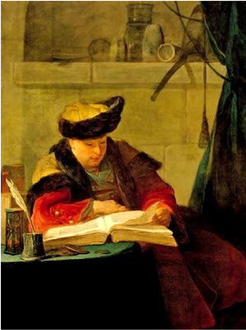
Le philosophe lisant di Jean-Baptiste Siméon Chardin (1734).

Tagliapietra ci propone una storia, anzi un'intera filosofia della metafora del lettore, che si snoda attraverso i secoli, passando per Dürer, ma anche per Le philosophe lisant di Chardin (1734), accanto a cui potremmo citare la Lettura della Bibbia dipinta nel 1755 da Jean-Baptiste Greuze, visto che le due tele sono vicine di casa nel museo del Louvre. E poi ancora The Reading Girl dipinta dal pittore anglo-francese Thèodore Roussel sul finire del XIX secolo.