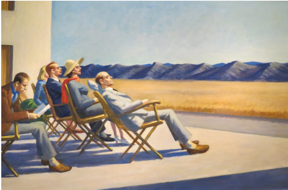
People in the Sun (Edward Hopper, huile sur toile, 1960).

Sin dall'introduzione noi assistiamo a una sottile ermeneutica, che prende le mosse da People in the Sun di Hopper: pian piano, ad ogni pagina, noi scopriamo un dettaglio nuovo in questa sapiente "lettura" – è proprio il caso di dirlo – che l'autore ci offre, pronta naturalmente per essere approfondita lungo nuove e inedite direzioni dalla nostra lettura singolare: quattro personaggi nel quadro stanno guardando qualcosa ... tranne uno, intento a leggere. Ma cosa legge? Non sembra un libro, ma allora cosa? E via di questo passo, dietro la superficie uniforme del quadro noi scopriamo una miriade di scritture, di messaggi, come se si trattasse di apparati testuali da approfondire e attraverso cui cominciare a indagare ... noi stessi.