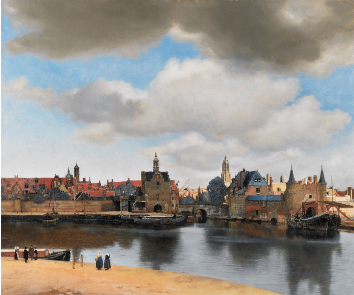
Jan Vermeer, View of Delft (1658).

Forse qui è bene anticipare l'idea secondo cui «lo scrittore è il custode della metamorfosi, ma è il lettore colui in cui essa si compie» (ivi, p. 78): le cose emergono nella loro novità, nella loro assoluta singolarità, proprio grazie alla presenza e all'operazione di lettura messa in atto dal fruitore. A proposito della Veduta di Delft , tra l'altro, non si può non ricordare il finale tragico di Bergotte nel celebre romanzo di Proust: «era morto. Morto per sempre? Chi può dirlo?». Domanda che risuona anche nelle tele di Vermeer: dipinte una volta per sempre? In realtà lette, decifrate, vissute da sempre nuovi "lettori" in cui è all'opera l'istante della singolarità.