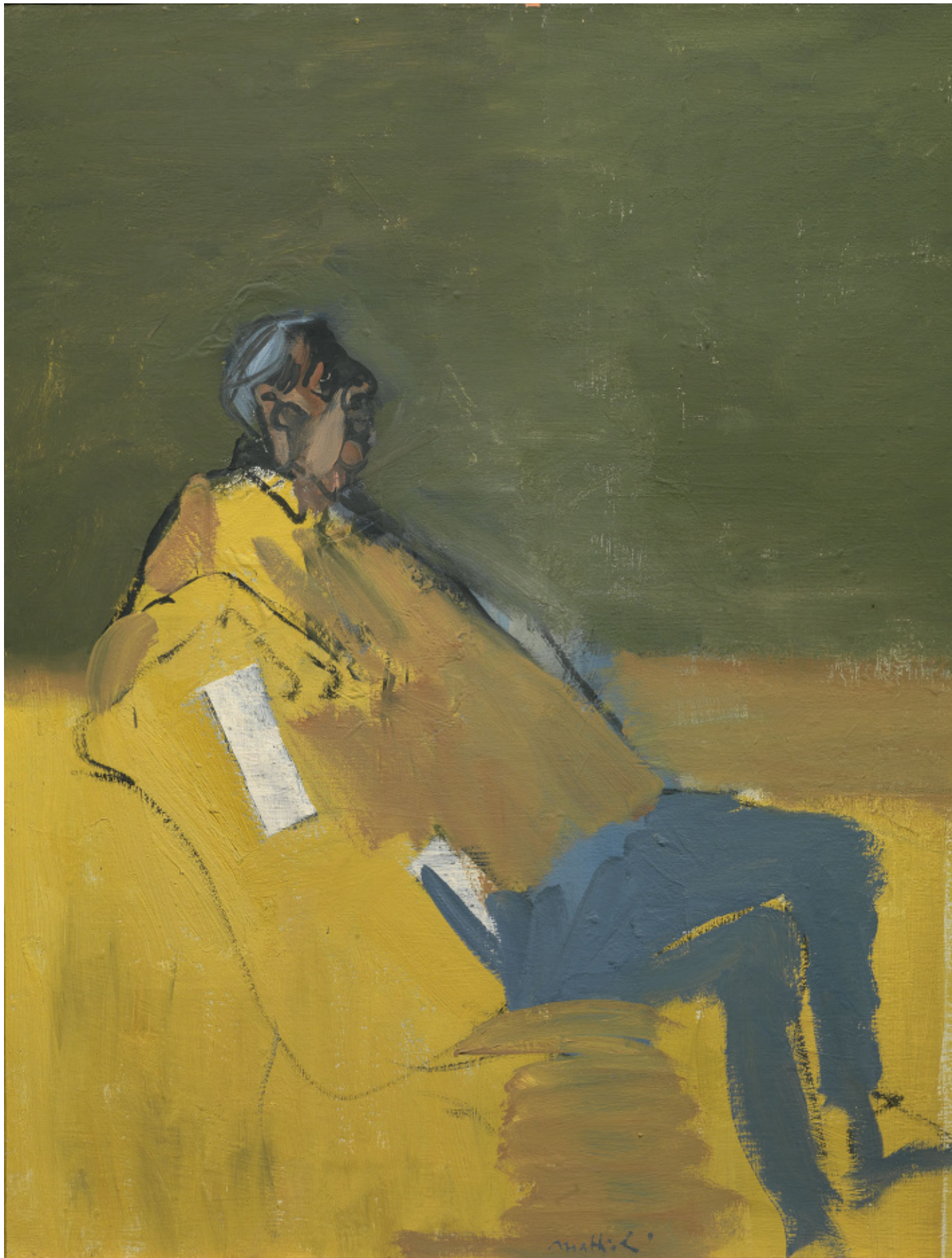
1968, Ritratto di Roberto Longhi, olio su tela, cm 70 x 60, arch 3818.