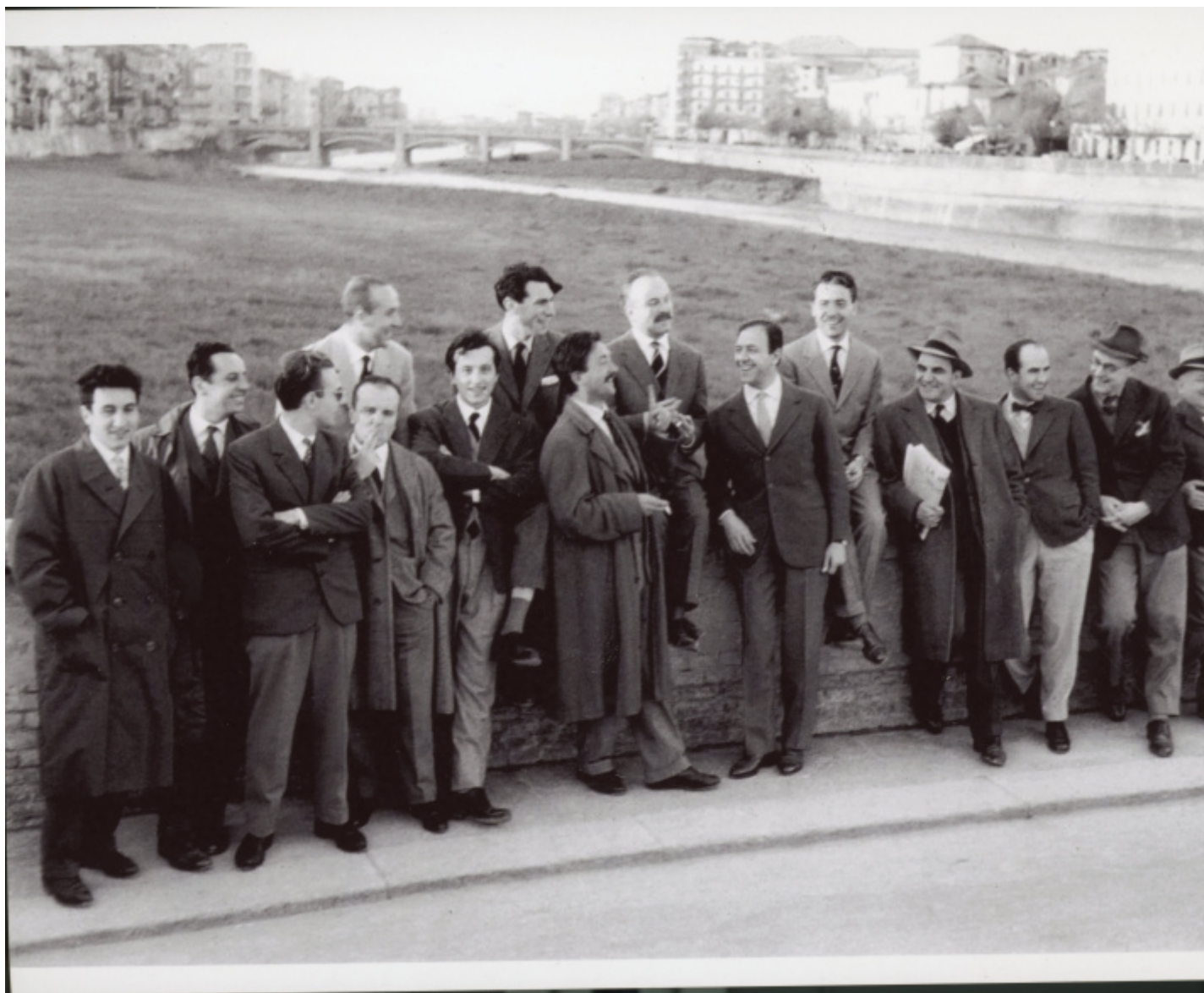
Palatina, redazione, 1950.

Avviandosi alla chiusura le ragioni per cui la rivista è esistita sono orgogliosamente ribadite: “dopo otto anni di vita”, provincia è “indicazione di una umanità lenta, riflessiva e tenacemente refrattaria al gratuito”, che “si contrappone all’“esasperazione dei valori formali, allo sperimentalismo privo di ragioni autentiche e pronto a contrabbandare, con etichette rivoluzionarie, un prodotto vecchio”, mentre si denuncia “la mitizzazione degli oggetti e dei programmi” dentro un “esilio volontario della storia”. Il convitato di pietra sembra essere il Gruppo 63 e le polemiche che spaccarono la comunità letteraria in quegli anni. A dare il tono a «Palatina» sono Attilio Bertolucci, che dal 1951 vive a Roma in una sorta di esilio volontario, e il direttore Roberto Tassi, storico dell’arte militante tra i più puntuali dell’intero Novecento (il carteggio tra i due, pubblicato a cura di Elisa Donzelli da Il Mulino nel 2019, fornisce molte informazioni sulla rivista, oltre che sull’aggiornamento artistico di Bertolucci, molto attento a ritrovare il filo della tradizione anche tra i pittori contemporanei). Alle loro spalle si intravedono le figure di Roberto Longhi, maestro per Bertolucci ed esempio per Tassi, e di Francesco Arcangeli, lo storico dell’arte bolognese amico di entrambi.