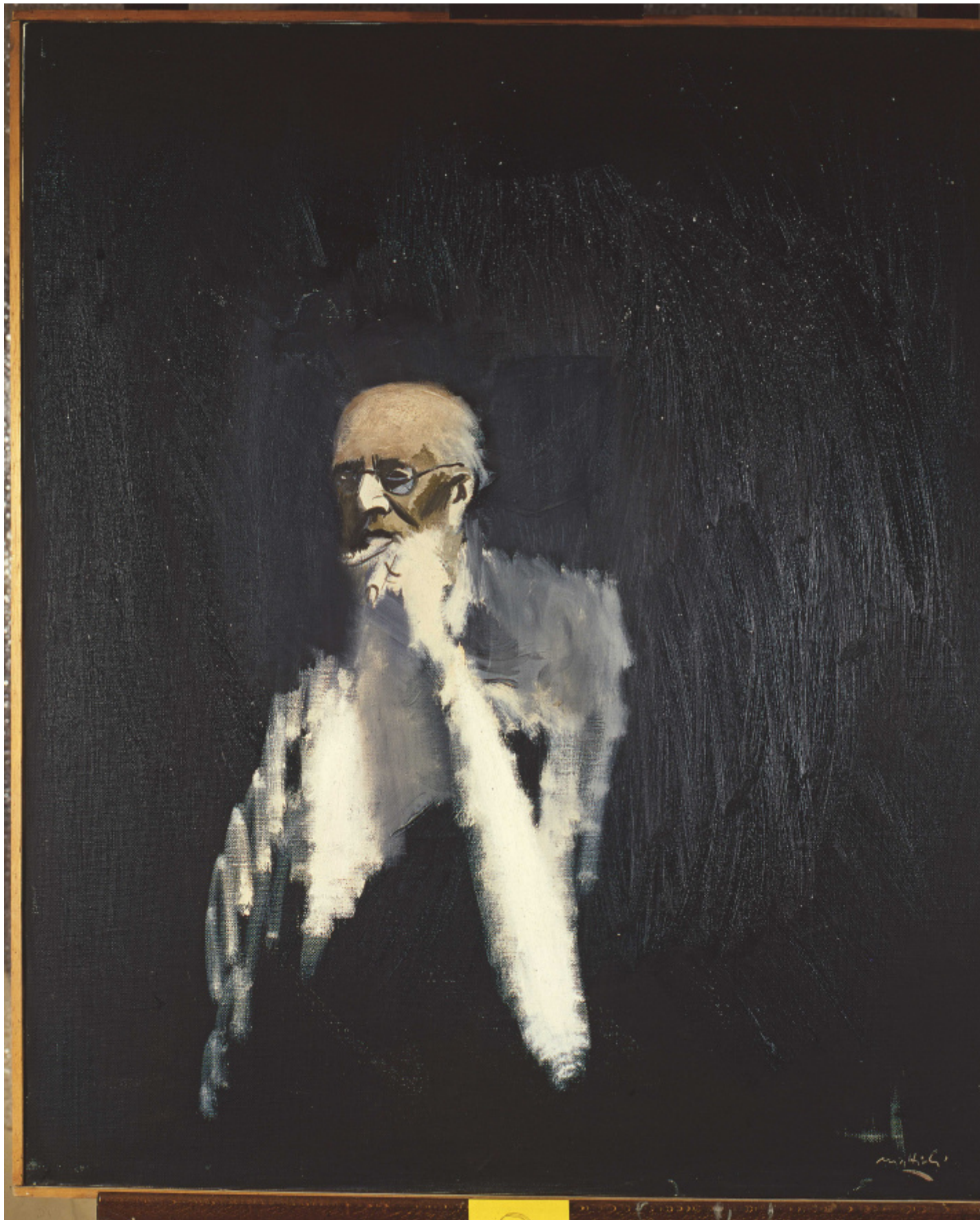
1970, Autoritratto, olio su tela, cm 90 x 80, arch 3816.

In quella foto c'è Carlo Mattioli (1911-1994), grafico della rivista, come lo fu qualche anno prima di «Paragone», ma soprattutto pittore figurativo tra i maggiori del nostro secondo Novecento, oggi ingiustamente un po' messo da parte, ma di cui si può finalmente tornare a parlare in occasione della mostra [Contro]ritratti , presso la reggia di Colorno (fino al 12 gennaio 2025), a cura di Sandro Parmiggiani e Anna