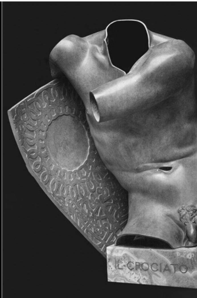
F.lli Alinari, Torso del Belvedere . Lastra di vetro, negativo gelatina ai sali d'argento, 21 x 27 cm, 1890 circa. Archivi Alinari, Firenze / Adolfo Wildt, Il Crociato , bronzo 1921 (primo esemplare in marmo 1906). Foto Paoletti, gelatina bromuro d'argento, 28,8 x 22,8 cm, 1921 circa. Courtesy Paola Mola.

Anche Adolfo Wildt, affascinato dalla scultura antica, trovò nella fotografia uno strumento indispensabile per approfondire la sua conoscenza. Le piccole riproduzioni fotografiche, con il loro accentuato chiaroscuro, divennero per lui una sorta di rivelazione: "solamente la fotografia, e la piccola fotografia soprattutto, dà quel senso così evidente di chiaroscuro [...] è lì il segreto della mia arte... rapito alle fotografie". Questa affermazione, apparentemente paradossale, rivela una profonda riflessione sull'importanza della mediazione visiva nella percezione dell'arte. Wildt, infatti, non si limitava a copiare le fotografie, ma ne assorbiva l'essenza, traendone ispirazione per la sua produzione scultorea. La visione chiaroscurale, così marcata nelle sue opere, è un'eredità diretta di questa esperienza. L'influenza di Wildt si estende ben oltre la sua generazione. Lucio Fontana, suo allievo al primo anno del corso di scultura nel 1927 (al termine Wildt lo passò direttamente al quarto con dieci in Scultura), eredita questa passione per il chiaroscuro, per i tagli che mostrano le cavità e mutilano le figure. I Concetti spaziali di Fontana, con le loro lacerazioni e i loro buchi, sono un esempio evidente di come l'eredità di Wildt si sia trasformata e rinnovata nel corso del tempo.