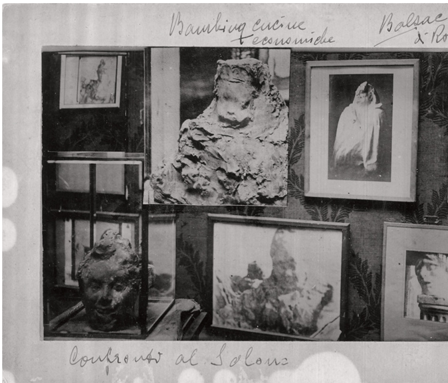
Medardo Rosso, Salon d'Automne 1904. Assemblaggio fotografico, aristotipo su cartoncino rigido, 17 x 21 cm, 1904. Le scritte sui margini sono autografe di Rosso.

Nel primo capitolo del libro, Andrighetto ricostruisce la genesi di questo modo di vedere la scultura, analizzando il passaggio dalle arti grafiche alla fotografia. Il secondo capitolo, invece, si concentra su come questa visione si sia diffusa ad altri codici visivi e verbali, prendendo in esame soprattutto le ricerche e le opere di Medardo Rosso e Constantin Brancusi. Rosso era un maestro nel manipolare le fotografie. Tagliava, incollava, rifotografava le sue sculture, creando composizioni complesse e spesso enigmatiche. Queste immagini fotografiche non erano semplici registrazioni, ma vere e proprie opere "altre" per esplorare la materialità e la temporalità della scultura. Rosso era interessato a catturare l'essenza effimera della forma, l'impronta del gesto sulla materia. Utilizzava diverse tecniche fotografiche, dalla stampa a contatto alla riproduzione su carta lucida. Interveniva direttamente sulle stampe (tagli, graffi, collage) e creava montaggi fotografici complessi.