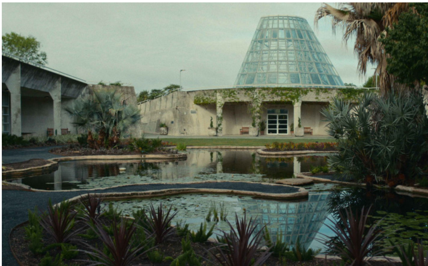
EMILIO AMBASZ, GREEN OVER GRAY, San Antonio Botanical Garden.

Un'altra struttura scelta dai registi a mostrare questa sfida a compenetrarsi con la natura è l'iconico ACROS (Asian Cross Road Over the Sea) Building di Fukuoka, forse l'opera più famosa di Ambasz: edificio polifunzionale a gradoni che ospita uffici pubblici e spazi culturali costruito dove prima c'era l'unico parco, e ricoperto di vegetazione a formare una piccola foresta urbana, tanto da far ritrovare lì, una volta cresciute le piante (che dalle trentasettemila messe a dimora sono diventate spontaneamente oltre cinquantamila), le brezze ed escursioni termiche delle montagne intorno. In questo caso, l'intento era di restituire ai cittadini il cento per cento del verde perduto, e di ribadire la possibilità di costruire nuovi spazi verdi anche al centro delle città – viene da ricordare, come già vedendo Perfect Days, che in giapponese nel kanji che significa "riposo, vacanza" (?) si saldano quelli di "persona" (?) e di "albero" (?). Un intento riuscito, dato che di Fukuoka l'Acros Building è diventato il simbolo e il cuore.