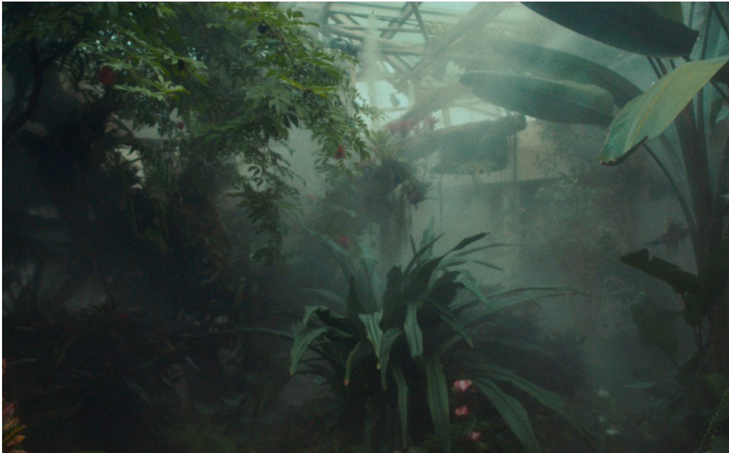
EMILIO AMBASZ, GREEN OVER GRAY, San Antonio Botanical Garden.

Lo stesso è accaduto per il Lucille Halsell Conservatory di San Antonio, giardino incantato ipogeo che pur lontano dal centro della città ne è diventato il luogo più frequentato.