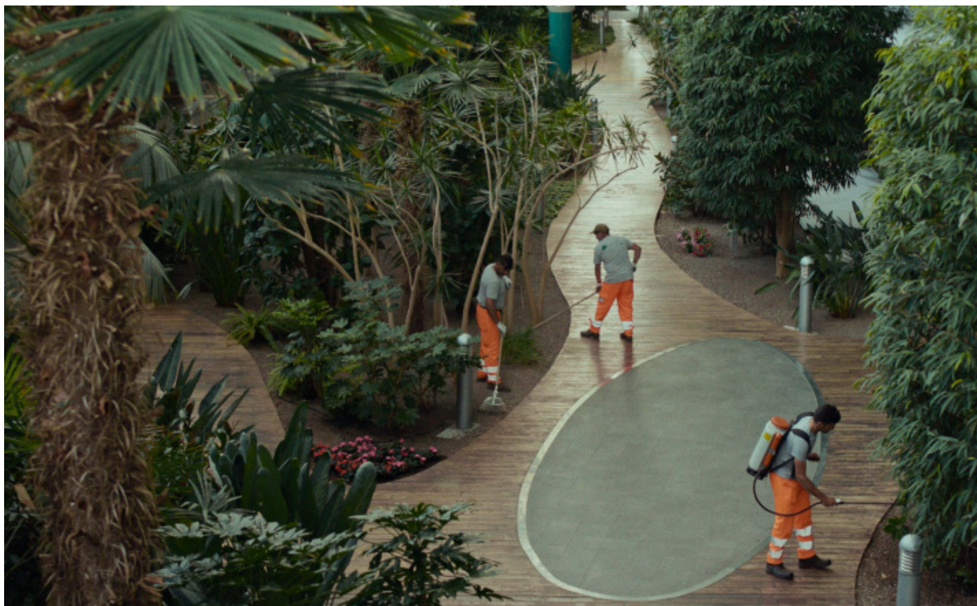
EMILIO AMBASZ, GREEN OVER GRAY, Ospedale dell'Angelo, Mestre.

Laureato honoris causa in Ingegneria civile – Architettura a Bologna nel 2021, in Design sistemico al Politecnico di Torino nel 2023, vincitore di tre Compassi d'Oro (1981, 1991, 2001, e nel 2020 l'ultimo, alla carriera), insignito di premi e riconoscimenti innumerevoli in tutto il mondo, Ambasz è stato anche dal 1969 al 1976 a capo della sezione di architettura e design del MoMA a New York. Lì ha voluto nel 1972 la storica mostra Italy: The New Domestic Landscape , evento cardine per il design italiano. Per chi volesse sapere di più anche di questo, Ambasz ne parla, in ottimo italiano, qui .