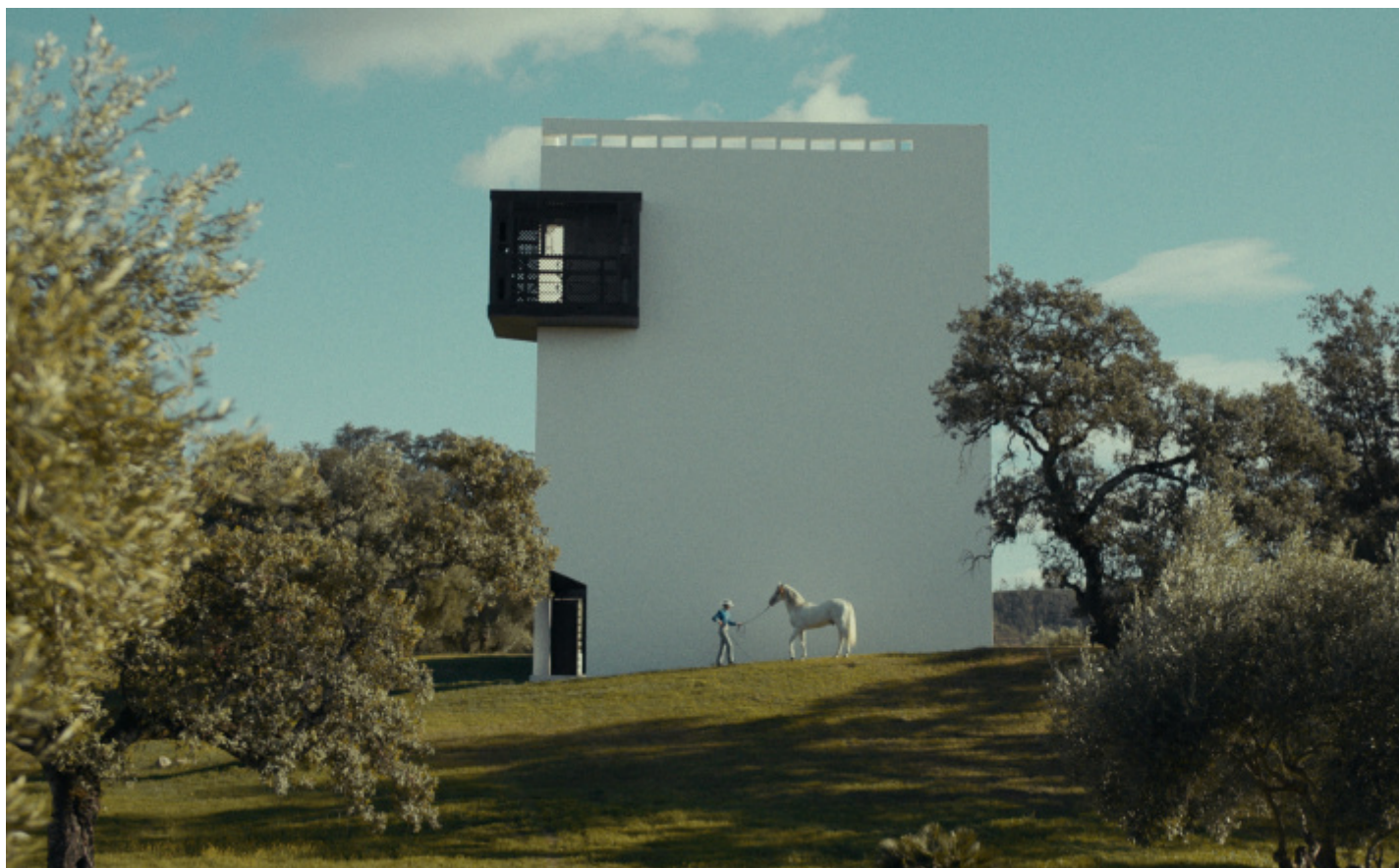
EMILIO AMBASZ, GREEN OVER GRAY, Siviglia.