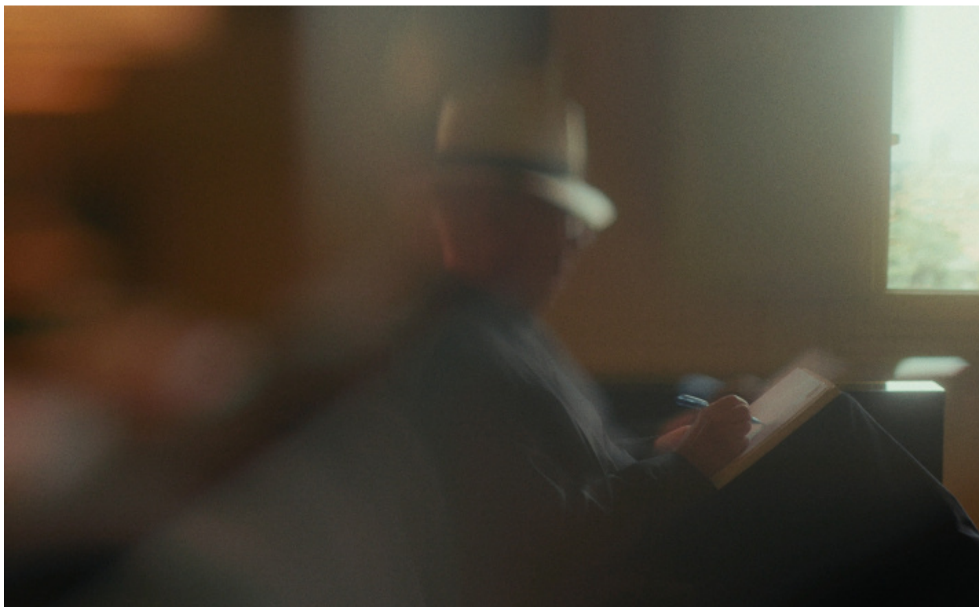
EMILIO AMBASZ, GREEN OVER GRAY.

A tenere insieme quegli elementi primi, c'è l'ala bianca della Casa de Retiro Espiritual, che si apre come un libro sulle alture e i laghi vicino a Siviglia, come sul punto di prendere il volo, e segna il luogo di uno spazio domestico ipogeo, costruito e poi ricoperto di terra e prato. Così, il movimento dalla casa interrata lungo una doppia scala speculare metafisica fino al belvedere sulla sommità esterna, contenuto nel ricamo ligneo di una griglia che ricorda le grate di certi edifici religiosi, acquisisce, a maggior ragione nel verde paesaggio idillico e privo di costruzioni che la circonda, qualcosa di sacrale e rituale, di ieratico, com'è nel film la figura lenta