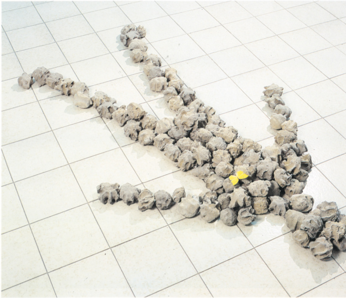
Alighiero Boetti. Io che prendo il sole a Torino il 19 gennaio 1969 - 1992.