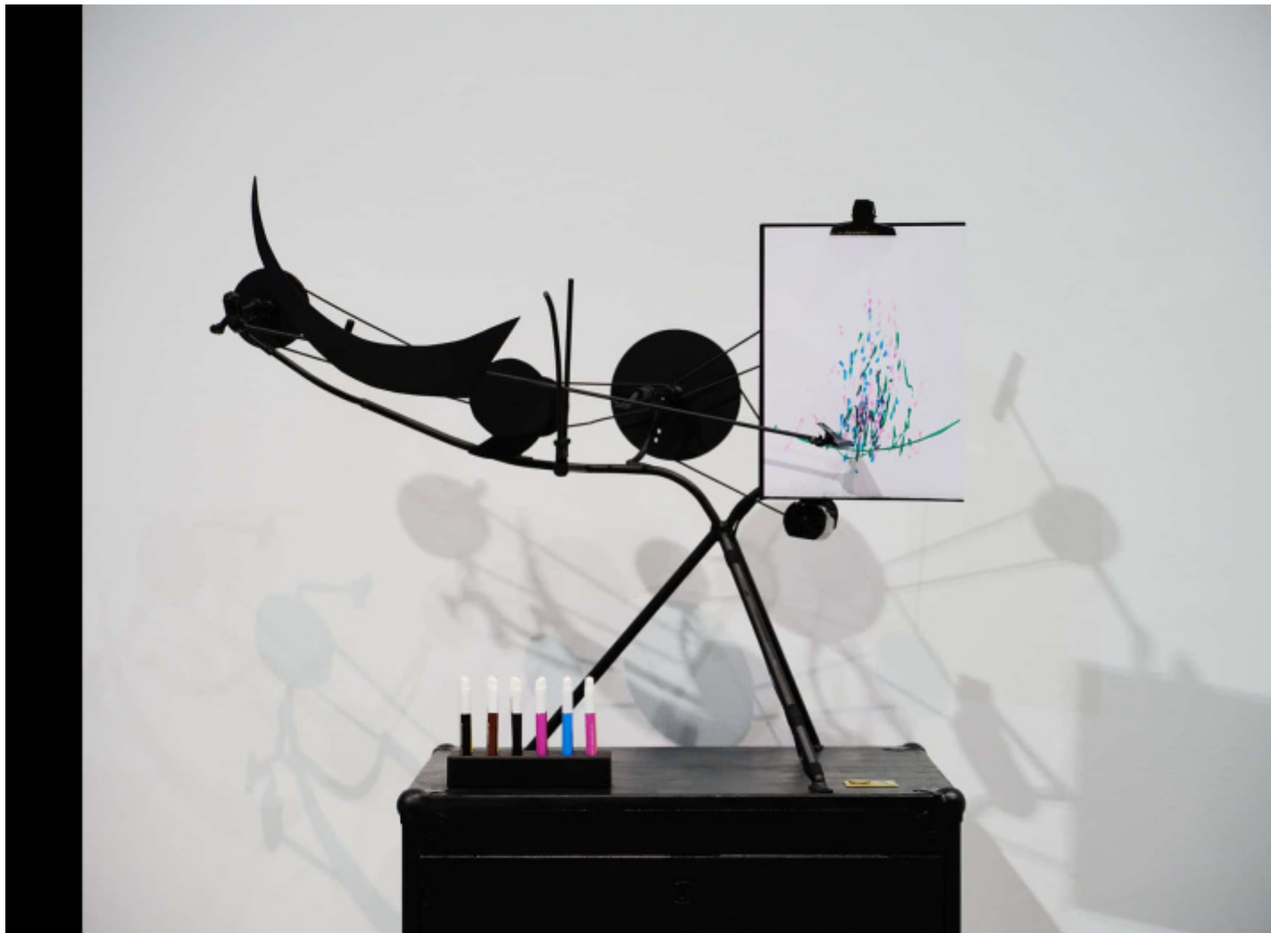
Opera di Jean Tinguely.

A prima vista, la creatività di questa ironica machina artifex non può essere altro che una parodia della creatività della machina sapiens che lavora dietro applicazioni “magiche” come GPT-4, Dall-E o Midjourney. La differenza sta ovviamente nell'intelligenza artificiale, che oggi è diventata “generativa”. Da una parte, l'azione creativa è limitata all'esplorazione casuale di movimenti meccanici; dall'altra, è in grado di esplorare enormi repertori di testi e immagini che possono contenere tutta l'arte moderna. Da una parte c'è il poeta che assembla rottami; dall'altra gli ingegneri che assemblano reti neurali addestrate a compiti complessi come la visione e il linguaggio. Da una parte c'è la fiamma ossidrica e l'immaginazione; dall'altra una matematica diabolicamente complessa.