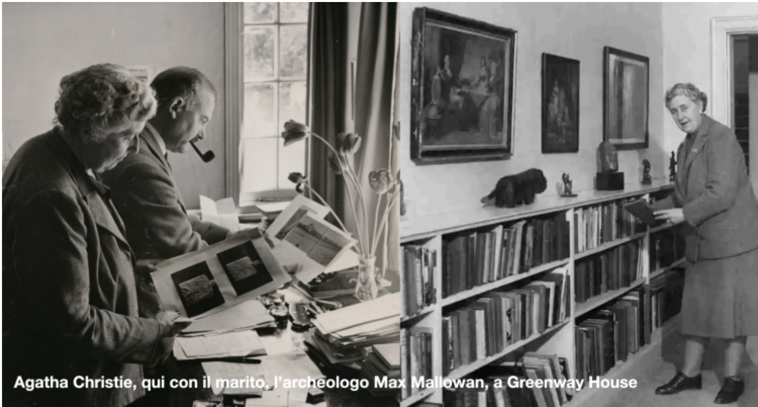
Agatha Christie, qui con il marito, l'archeologo Max Mallowan, a Greenway House

Tutti i fiori utilizzati nelle bordure avevano un preciso scopo tradizionale nel galateo botanico britannico: essere utilizzati per realizzare piccoli bouquet, vuoi per decorare la casa, vuoi da donare alle amiche affidando, al significato simbolico attribuito alle diverse specie, messaggi extra verbali di affetto, amicizia, o di particolari stati d'animo: in pratica, fiori usati come emoticon avanti lettera.