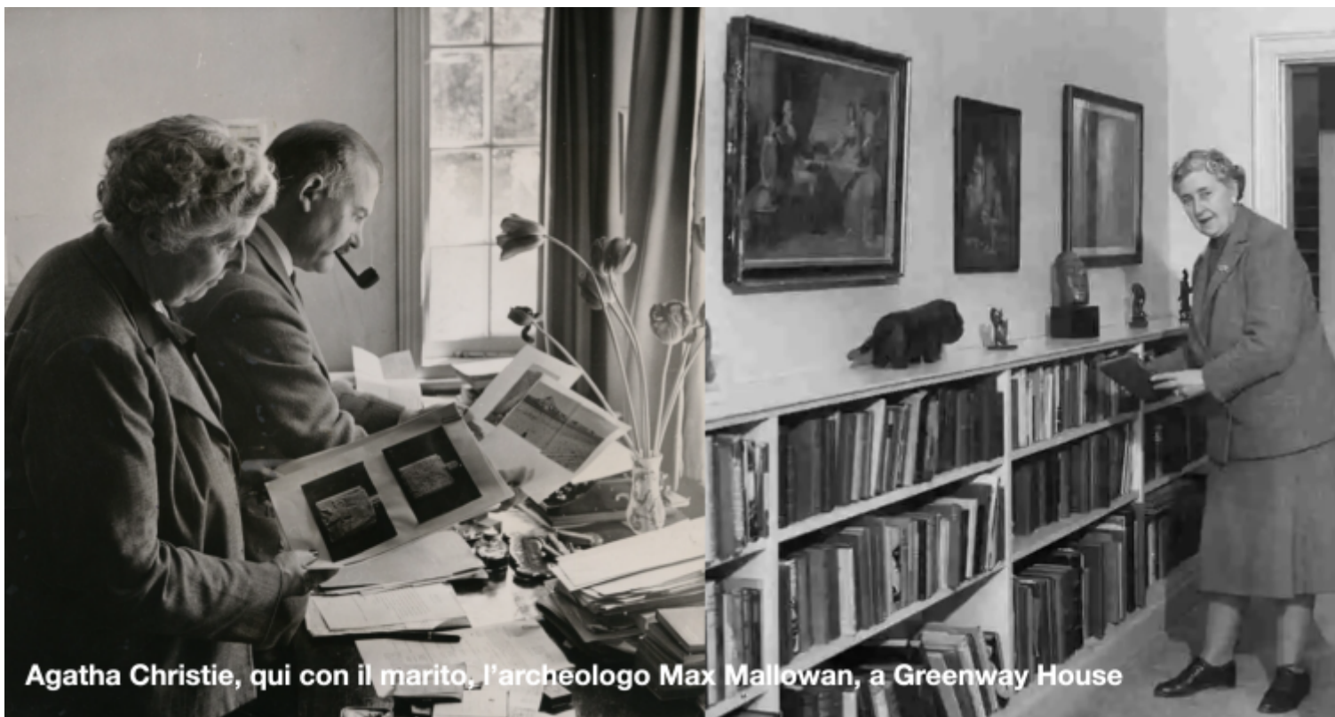
Agatha Christie, qui con il marito, l'archeologo Max Mallowan, a Greenway House

Tutti i fiori utilizzati nelle bordure avevano un preciso scopo tradizionale nel galateo botanico britannico: essere utilizzati per realizzare piccoli bouquet, vuoi per decorare la casa, vuoi da donare alle amiche affidando, al significato simbolico attribuito alle diverse specie, messaggi extra verbali di affetto, amicizia, o di particolari stati d'animo: in pratica, fiori usati come emoticon avanti lettera.