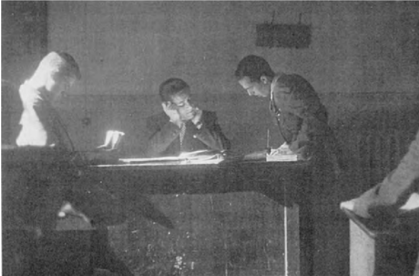
Francesco Arcangeli durante una lezione al-Liceo Minghetti di Bologna nell'anno-scolastico 1942-1943.