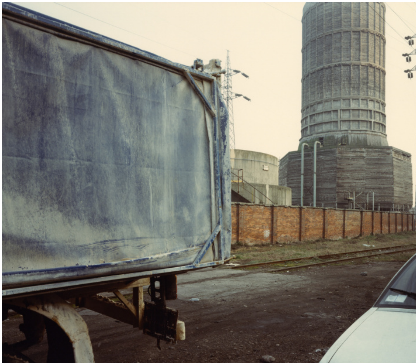
MAXXI, Guido Guidi, ColTempo, Porto Marghera 1988, ph. Guido Guidi.