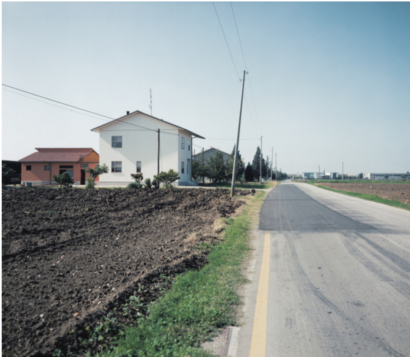
MAXXI, Guido Guidi, ColTempo, San Giorgio di Cesena 1985, ph. Guido Guidi.