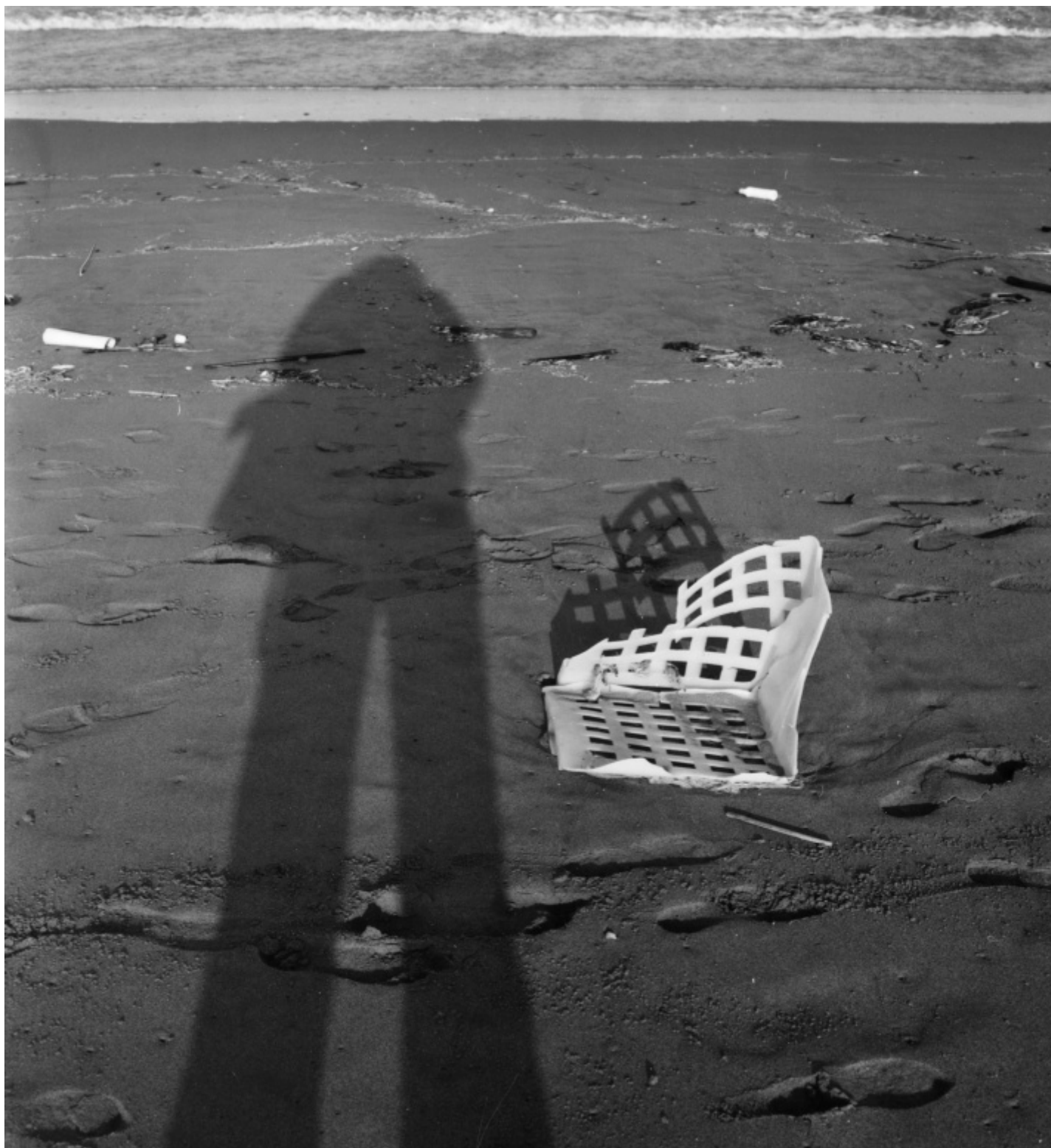
MAXXI, Guido Guidi, ColTempo, Cervia 1979, ph. Guido Guidi.

Negli anni Settanta Guidi produce numerose immagini frutto di queste continue sperimentazioni che sollevano temi importanti come la natura dell'immagine fotografica e la natura stessa dell'opera, ponendo l'accento sulla materia della fotografia. È solo una immagine realizzata con i sali d'argento? È necessario considerare anche altre parti del foglio fotografico come, ad esempio, il margine bianco? La tipologia della carta con le specifiche caratteristiche estetiche sono "opere"? I trattamenti chimici fatti a posteriori sull'immagine sono anch'essi parte integrante dell'immagine? Ma la questione che più preme a Guidi è se queste sperimentazioni o prove siano da considerarsi "opere da esporre". Sono riflessioni che portano chi guarda, in camera oscura, nell'archivio e nello studio in cui, sul grande tavolo, sono distese le immagini pronte a offrirsi all'analisi dell'autore e in seguito al pubblico. Lo studio, la biblioteca, le collezioni di immagini e di oggetti di Guidi sono i luoghi cruciali all'interno del sistema della creatività e della produzione