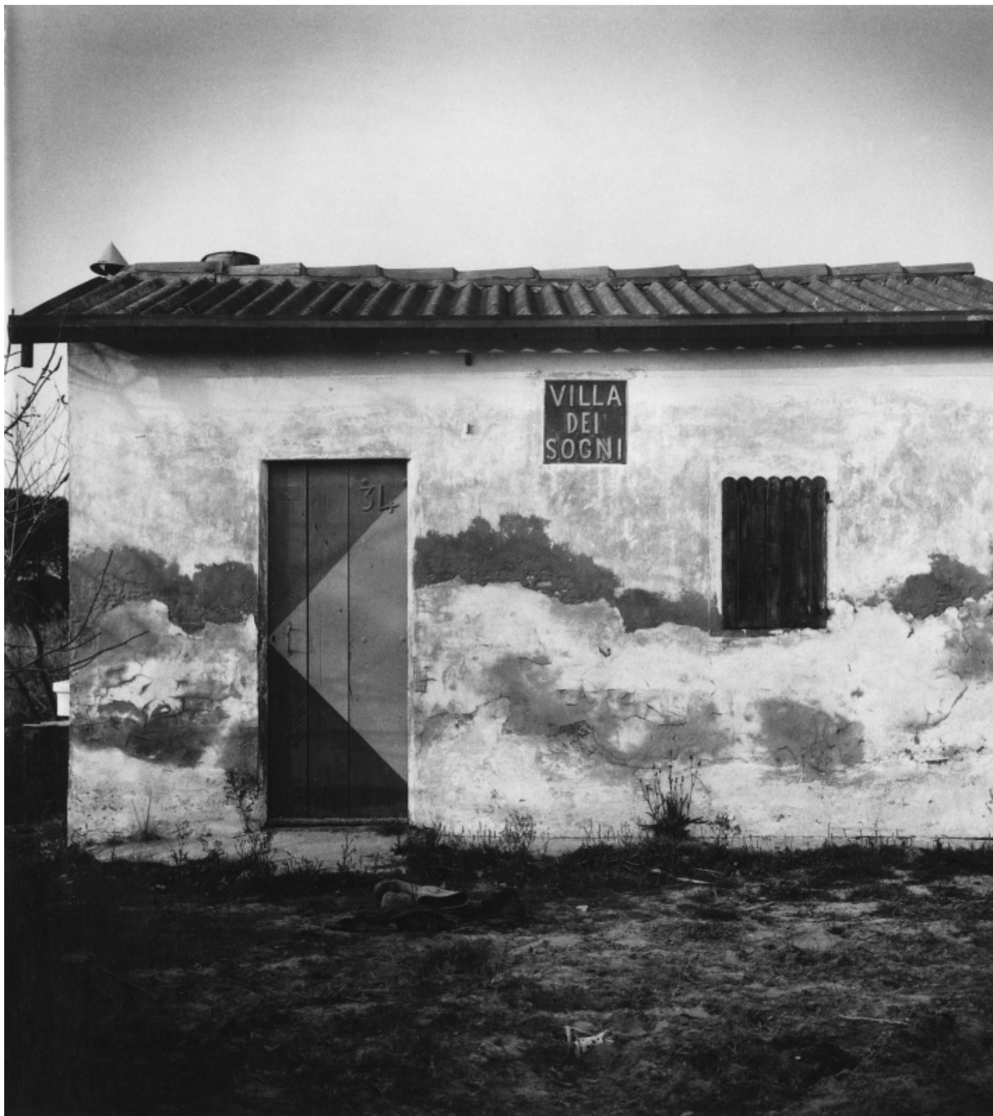
MAXXI, Guido Guidi, ColTempo, Fosso Ghiaia 1972, ph. Guido Guidi.

sue semplificazioni: un centimetro a destra o a sinistra, oppure sotto oppure sopra, oppure un minuto di più o meno l'obiettivo aperto. Oscillava senza mai palesarlo tra la distanza che si identifica con l'infinito geometrico e il battito dell'orologio, il quale all'orecchio di Strand senza dubbio aveva sussulti e linguaggi fatali." Per brevità ricordiamo solo alcuni progetti di ricerca e analisi del paesaggio a cui Guidi partecipa quali: Una città per la cultura. Istituti culturali e recupero urbano a Cesena nel 1985, a seguire Esplorazioni sulla via Emilia. Vedute nel paesaggio nel 1986, cui seguono numerosi altri come i contributi sulle riviste di urbanistica e di architettura,