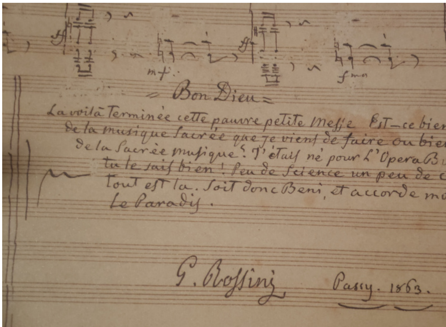
La dicitura conclusiva, nota come "Lettera al Buon Dio".

La composizione di questo insolito e affascinante ultimo capolavoro si svolse dunque in un arco di tempo piuttosto lungo, specialmente al confronto con la frenetica attività del ventennio trascorso nel mondo operistico. Ma non fu l'unica interruzione del "silenzio creativo" seguito al Guillaume Tell . Nonostante le malattie e la crisi depressiva, grazie anche all'amorevole assistenza della sua seconda moglie, Olympe Pélissier, conosciuta a Parigi fin dai primi anni Trenta e sposata nel 1846, dopo il 1829 Rossini aveva infatti composto lo Stabat Mater (iniziato nel 1833 e completato nove anni più tardi) e le Soirées musicales (1830-35), costituite da otto Ariette per soprano e quattro Duetti. E soprattutto aveva riempito quattordici album con i suoi Péchés de vieillesse , rimasti inediti finché visse. Si tratta di un'ampia serie di brevi composizioni per pianoforte solo o accompagnato da voci: un itinerario musicale di carattere autobiografico, ricco di un'espressività tagliente e ironica, riflessa anche nei titoli di molti pezzi. Il linguaggio musicale è evocativo, non di rado francamente descrittivo se non addirittura caricaturale, talvolta quasi oggettivo e perfino "meccanico". Qualcosa che agli studiosi da tempo appare come una singolare quanto spiazzante premonizione del modernismo di primo Novecento, fra Eric Satie e Igor' Stravinskij.