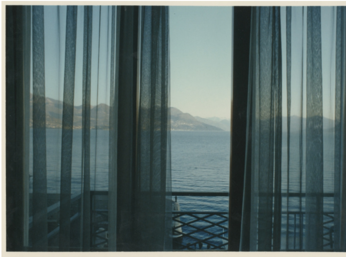
G. Chiaramonte_Senza titolo (dalla serie Finestre) 1978-1980_CSAC Università di Parma_Fondo Chiaramonte

Infatti nei primi anni ottanta del secolo scorso, Chiaramonte inizia a viaggiare per l'Italia fotografando con l'Hasselblad alternandola all'uso di una fotocamera panoramica la 6x12. In questo senso in Interno perduto , sul terremoto in Emilia del 2012, ritroviamo proprio l'alternarsi dei due formati, tra una visione più istantanea con il quadrato e più “classica” con il formato panoramico. Il passaggio dal bianconero dei primi