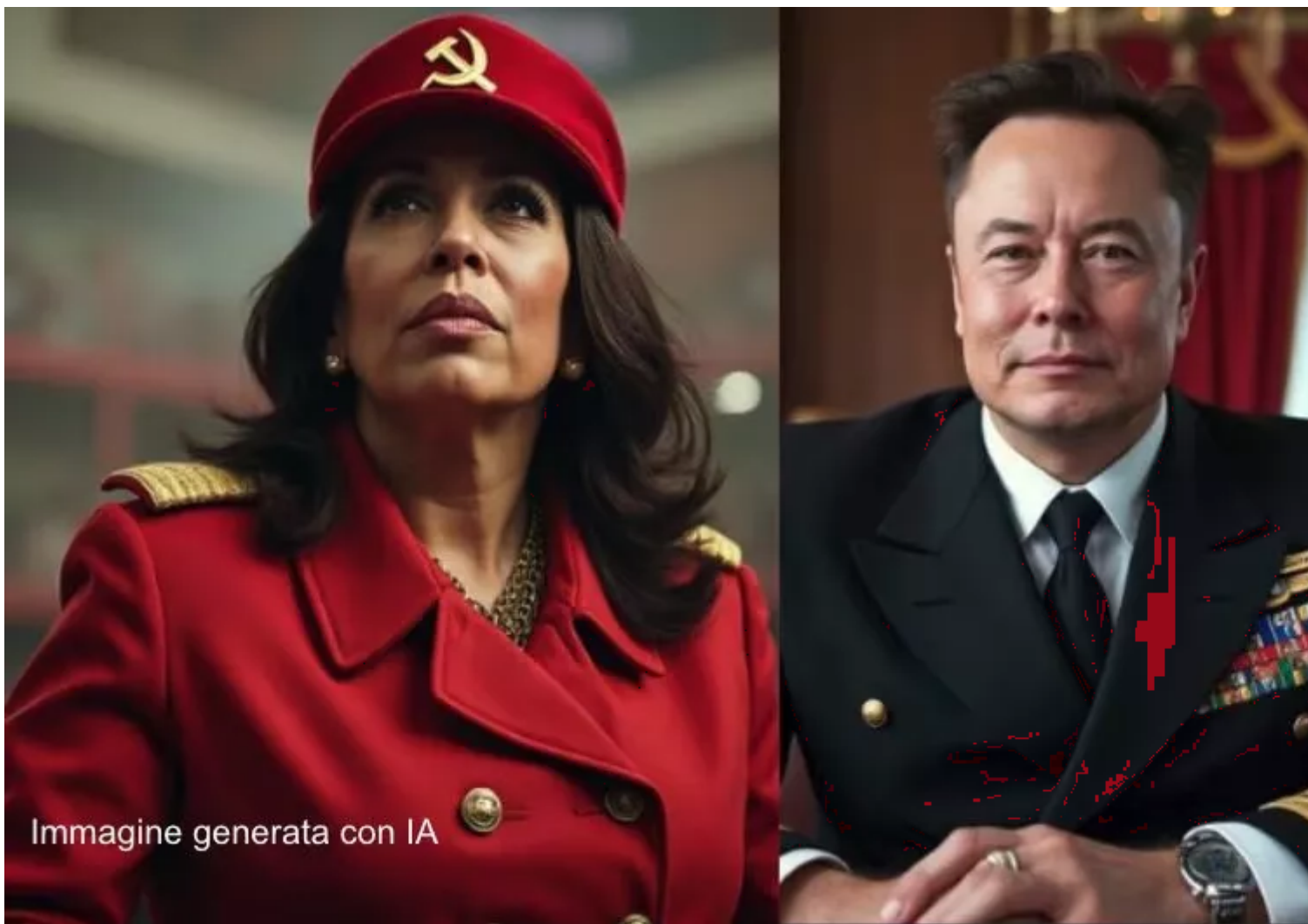
Immagine generata con IA

Se continuiamo a tenere vivo questo spazio è grazie a te. Anche un solo euro per noi significa molto. Torna presto a leggerci e SOSTIENI DOPPIOZERO