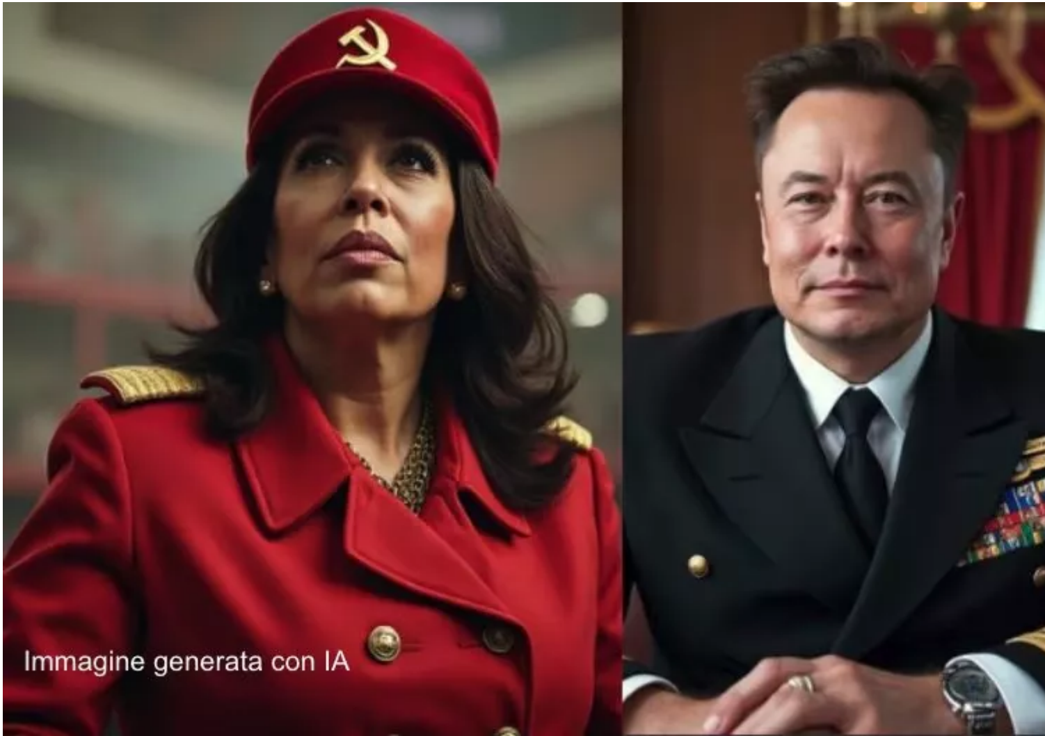
Immagine generata con IA

Se continuiamo a tenere vivo questo spazio è grazie a te. Anche un solo euro per noi significa molto. Torna presto a leggerci e SOSTIENI DOPPIOZERO