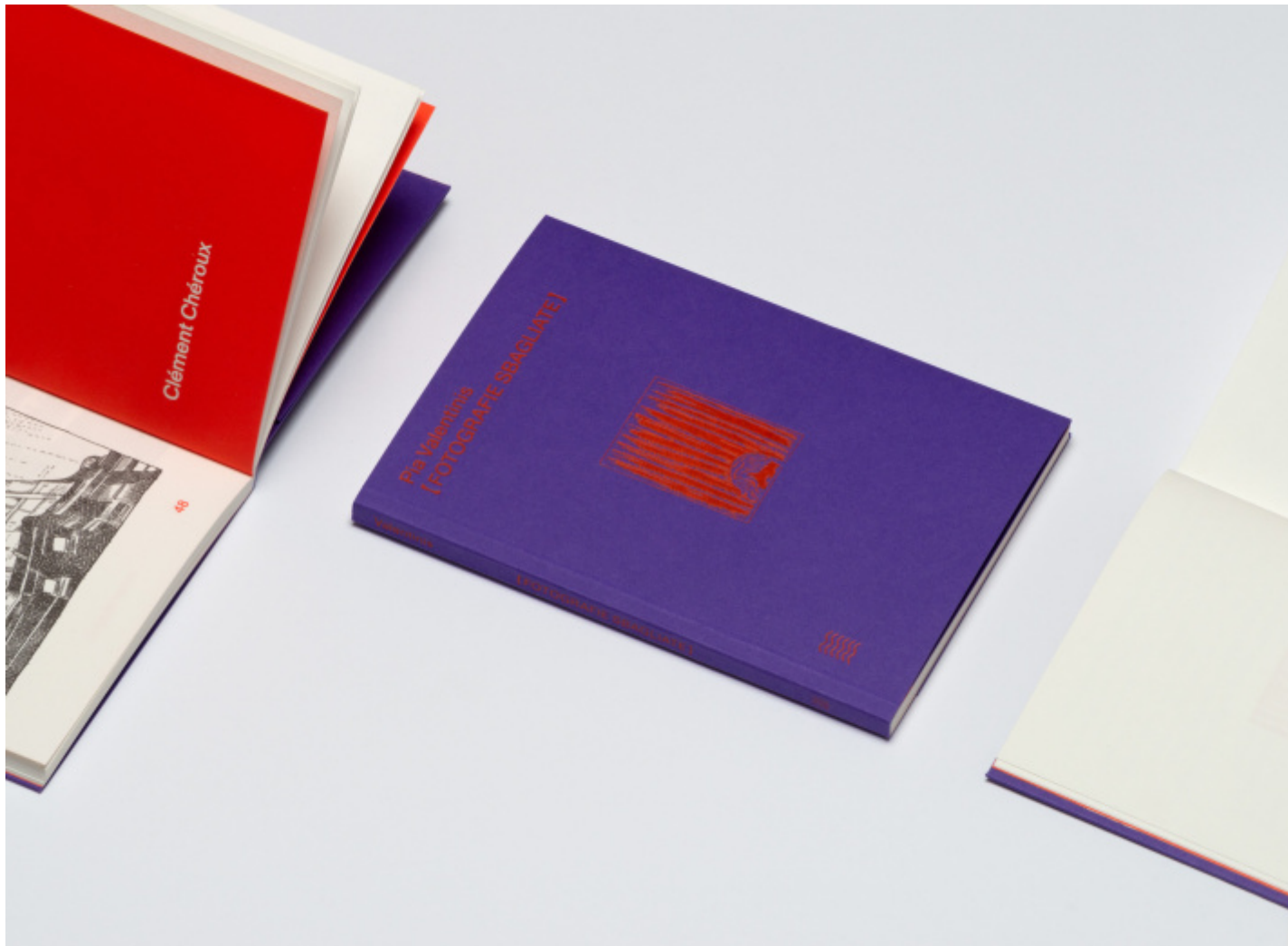
Pia Valentinis con un testo di Clément Chéroux.

Fotografie sbagliate . Mentre le disegnavo per questo libro, ho scoperto che la parola «sbagliare» significa togliere bagliore, lasciare «senza luce». La cosa mi ha sorpreso, perché il mio mestiere è quello di «illustrare», che significa «illuminare», «rendere chiaro». Scrive Pia Valentinis nell'introduzione e prima ancora dichiara che le piace “pescare” queste immagini nei mercatini, così ci permette di ritornare all'inizio della storia. Ma soprattutto al fatto che un tempo le foto non si buttavano, anche se erano sbagliate. Era più frequente che una bella foto venisse bruciata o fatta in mille pezzi se il soggetto ritratto era un bastardo traditore . Oggi le foto sbagliate hanno vita breve, pochi secondi; – fammi vedere... no, no, butta, butta! – è una frase ricorrente, rimbalza nelle feste, al ristorante, nelle gite e nelle strade.