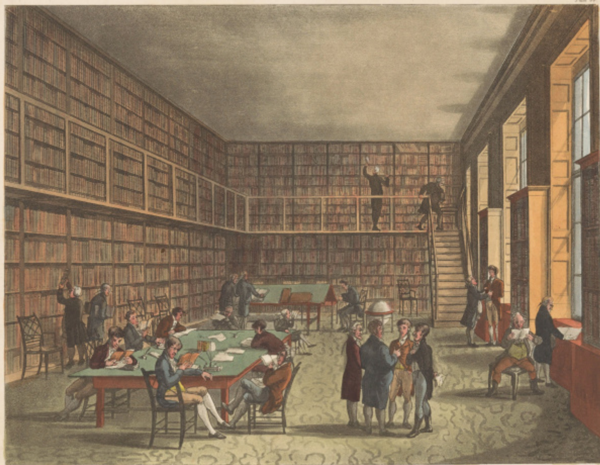
ROYAL INSTITUTION, ALBEMARLE STREET.

London: Pub. 1789. By R. Ackermann's Engraving of Art & Trade.