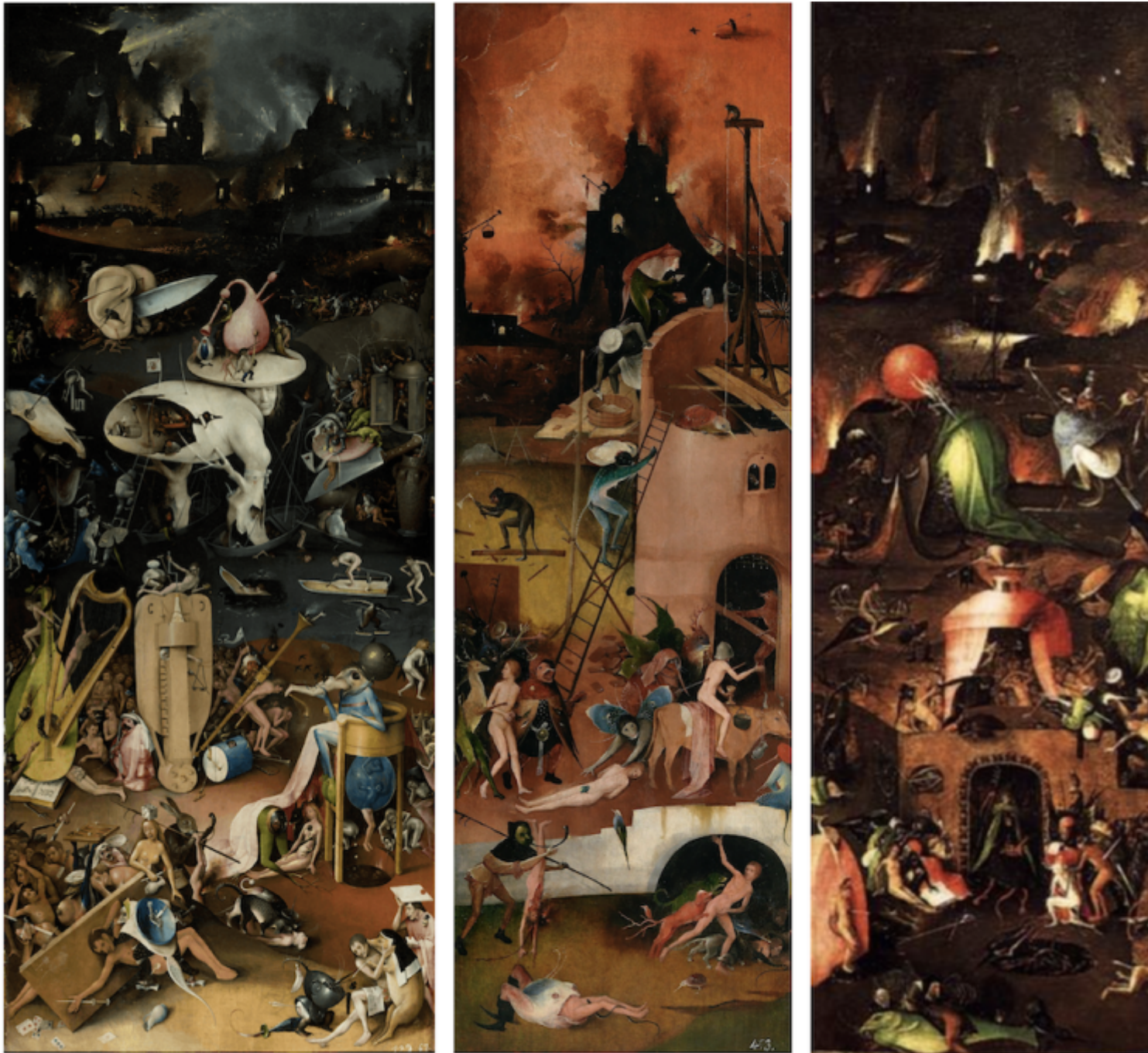
Hieronimus Bosch, Il Giardino delle delizie , Trittico del carro di fieno , Trittico del Giudizio (particolari dei pannelli di destra)

Guardi ipnotizzato quelle immagini di roghi trasmessi in mondovisione, ed è come veder prendere vita agli scenari infernali cari a Hieronymus Bosch, rappresentati in opere visionarie come il Trittico del Giudizio , il Trittico del carro di fieno , o il Giardino delle delizie , «analogamente costellati di incendi devastatori. Qui, tuttavia, non siamo nell'oltretomba, ma nel tragico inferno dell'esistenza», scrive, a proposito delle opere del maestro olandese, Laura Pasquini, storica dell'arte medievale presso l'Alma Mater Studiorum, Università di Bologna, in Il diavolo (“Storia iconografica del male”, Carocci, 2024), quasi a presagire in «una rappresentazione ostentatamente metamorfica della figura demoniaca», dell'inferno dell'esistenza presente e la fine delle sue delizie. Tanto medievali quanto contemporanee.