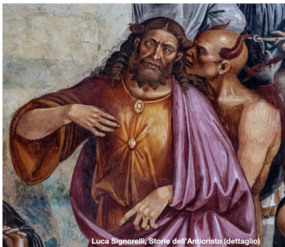
Luca Signorelli, Storie dell'Anticristo (dettaglio)

E quale controfigura migliore l'Anticristo poteva assumere, nel mondo contemporaneo, se non quella di Charles Manson, il “macellaio di Cielo Drive” – l'ispiratore ed esecutore dell'assassinio dell'attrice Sharon Tate, moglie del regista Roman Polanski, e di altre quattro persone nell'agosto del 1969 – un cantante fallito e psicotico a cui l'LSD e tutte le droghe del mondo avevano “bruciato” il cervello, uno che si credeva il Salvatore reincarnato le cui gesta avevano preso le mosse proprio in quelle aree di Los Angeles colpite dagli incendi, nello specifico nella “riserva” hippie di Topanga Canyon, tra Palisades e Malibu, il cui isolamento boschivo faceva da calamita per artisti e “anime libere”, ma anche per balordi irrecuperabili.