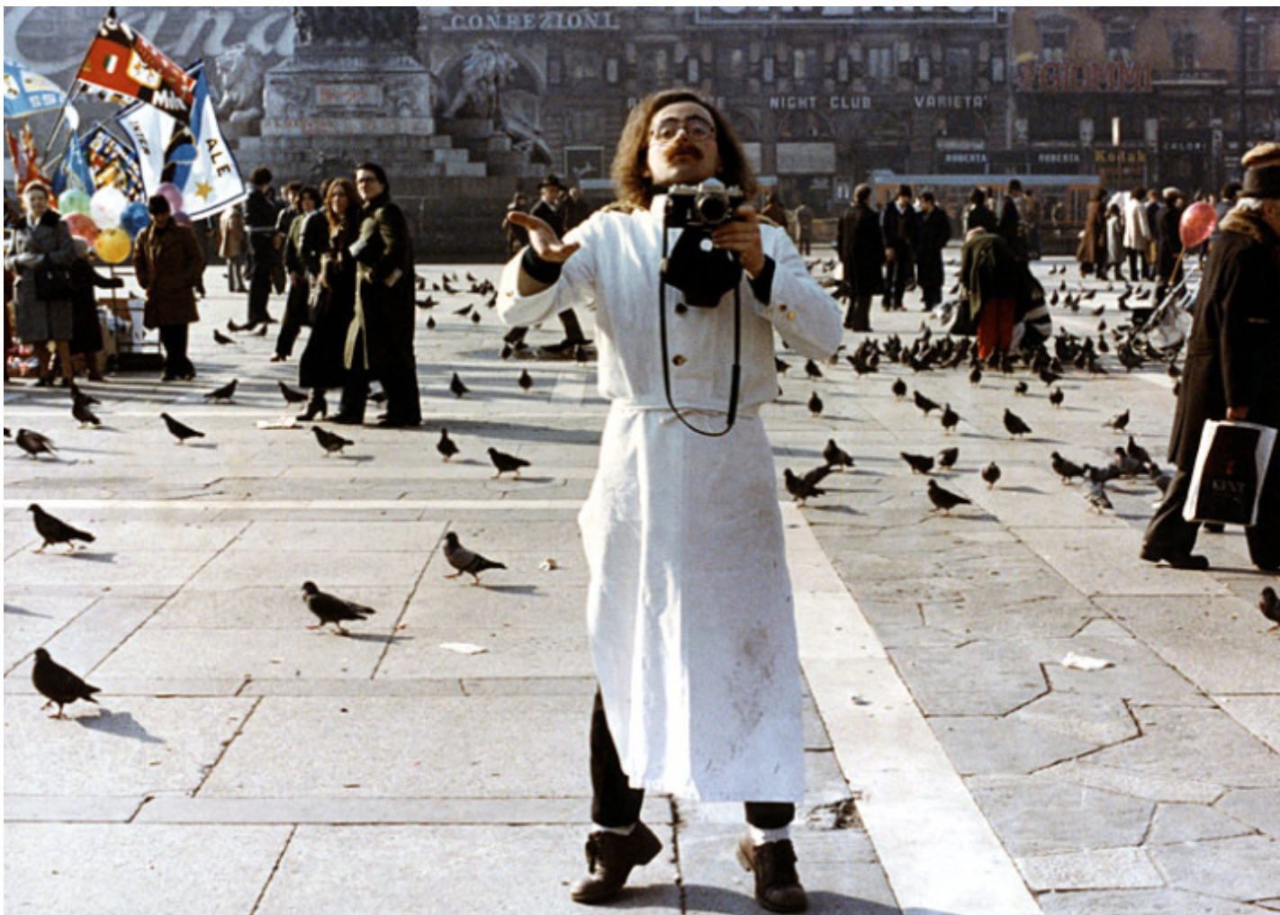
Maurizio Nichetti fra i passanti di piazza Duomo in Ratataplan , 1979.

Questi e molti altri percorsi si possono seguire in questo volume ricchissimo, che non si rinchiude in una prospettiva nostalgica ma arriva fino all'oggi e al mondo delle serie e delle piattaforme. Più che un libro di storia (o geografia) del cinema, si configura come un atlante emotivo che scandaglia e indaga i rapporti tra la settima arte e la metropoli inquieta e perennemente in movimento che risponde al nome di Milano. Il tutto attraverso un sontuoso repertorio di foto, immagini, interviste e dati. Illuminante, ad esempio, il confronto tra mappe diacroniche sulla diffusione delle sale cinematografiche in città tra 1900 e 2024, che mostra il contrarsi dei cinema e il loro concentrarsi in zone sempre più centrali (ad esclusione dei grandi multisala periferici, e di qualche benemerita eccezione nei quartieri fuori dalla cerchia interna, come lo storico cinema Mexico del compianto Antonio Sancassani).