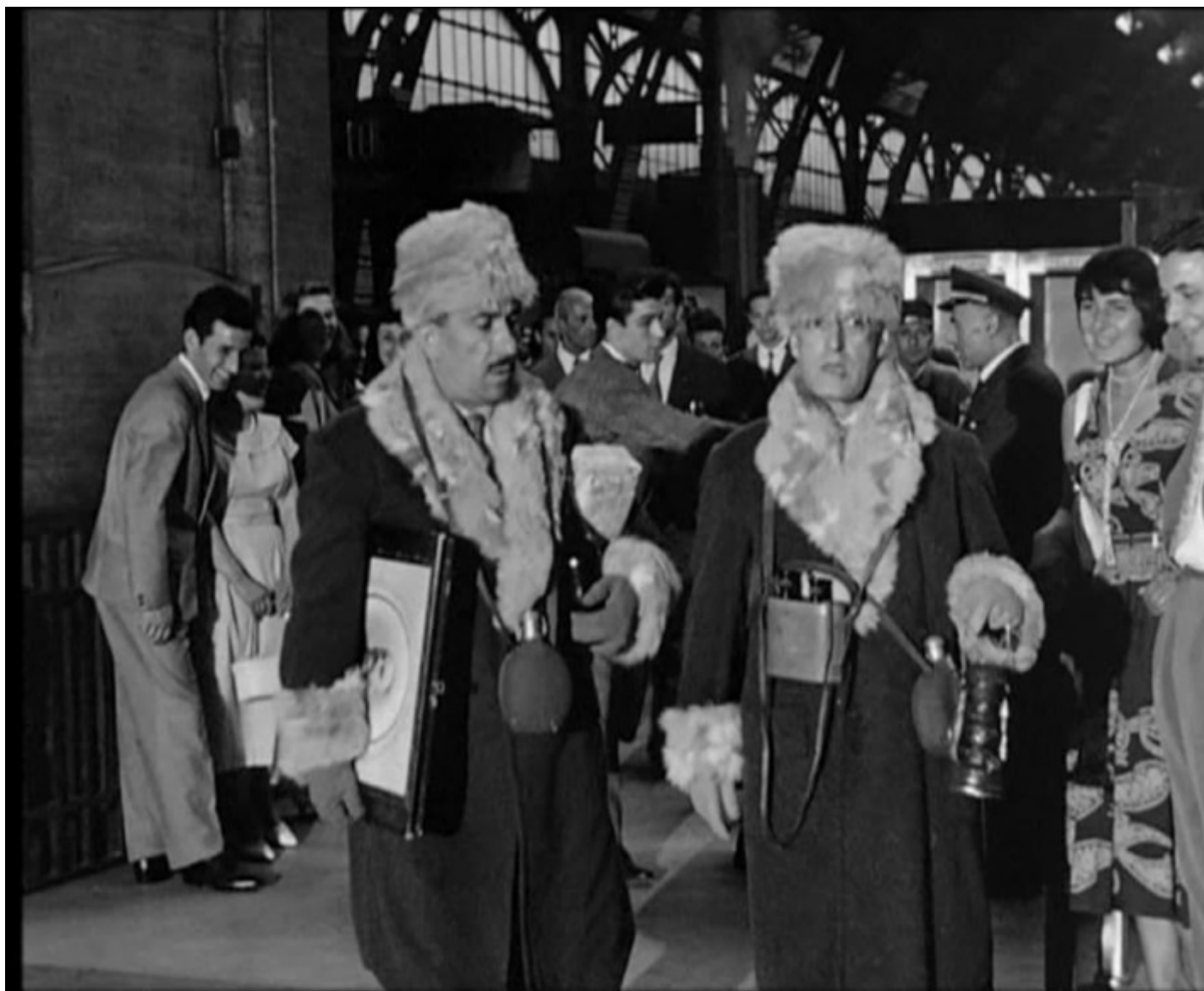
L'arrivo di Peppino De Filippo e Totò alla Stazione Centrale in Totò, Peppino e la... Malafemmina , 1956.

Sia chiaro, nel dopoguerra quegli sguardi foresti hanno saputo cogliere e dipingere con la cinepresa ritratti potenti di Milano, a volte giocati sulla cifra della commedia – gli imprescindibili e imbacuccati Totò e Peppino, di cui si occupa Gabriele Gimmelli nel suo gustosissimo contributo, che salgono nella capitale del Nord come andassero in un luogo misterioso e fantasmagorico – o, più spesso, attraverso la lente del dramma. Che fosse dramma epico-sociale – la Milano che Visconti trasforma nel suo capolavoro in una città industriale idealtipica, universale e mitica (nel libro Maurizio Porro scrive pagine significative su Rocco e i suoi fratelli ) – o all'opposto tragedia cruda e violenta (come nel caso del filone poliziottesco degli anni '70, inaugurato nel 1968 da Lizzani con Banditi a Milano , che proprio tra il basso pavé e l'alto skyline milanese trova la sua patria d'elezione).