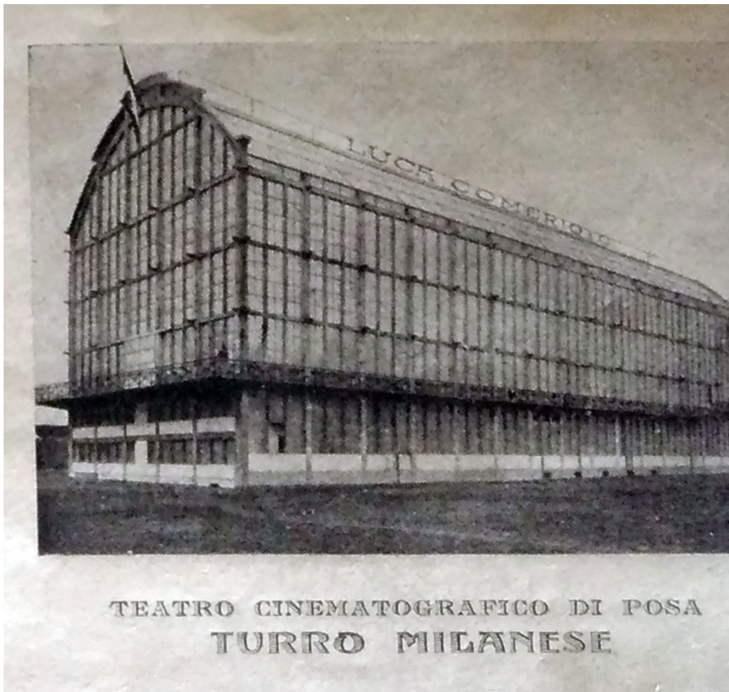
Il teatro di posa della Luca Comerio & C. intorno al 1908.

Non ha dubbi Biondillo, che di Milano è un esploratore indefesso: la città lombarda è stata relegata ad un ruolo di secondo piano dalla distanza (fisica e simbolica) con la politica nazionale, con i Ministeri, i produttori e Cinecittà, che hanno fatto di Roma – a partire già dal fascismo, per volere di Mussolini, e poi a seguire nel dopoguerra – l'unica testa, enorme e divoratrice, del cinema italiano. Non che manchino film ambientati a Milano, ma oltre ad essere numericamente non confrontabili a quelli che mettono in mostra Roma, l'industria cinematografica nazionale ha sempre guardato alla città meneghina da fuori, usando lenti stereotipate e fruste. È quella che Biondillo chiama la "funzione Milano": la milanesità come profumo di modernità e freddezza, grattacieli, smog e folla che corre. Lavoro, lavoro e ancora lavoro, una città senza passioni e in fondo senza personalità: una maschera logora e monodimensionale, una brutta copia dei caratteri regionali della commedia dell'arte.