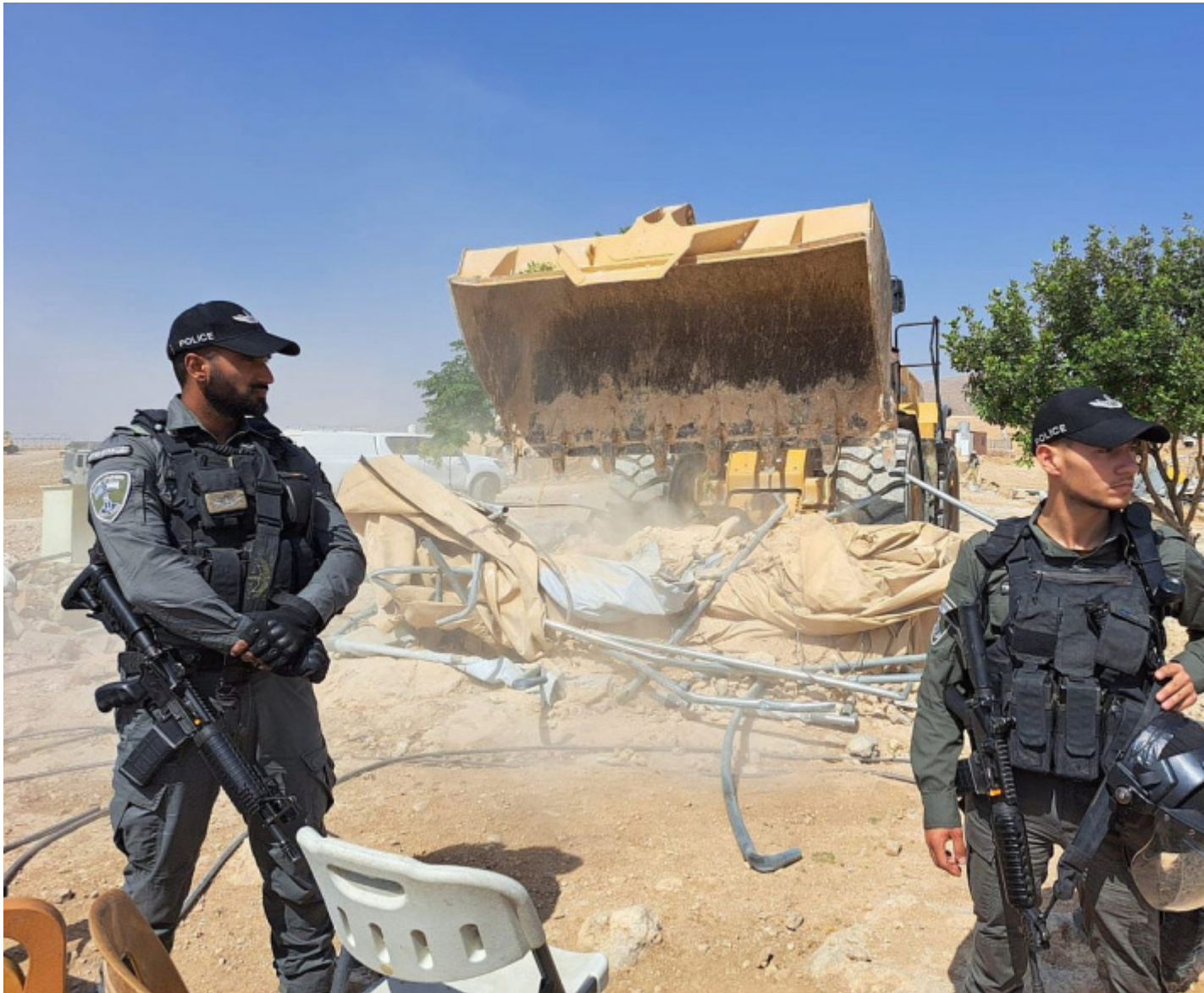
Poliziotti israeliani davanti a un bulldozer che demolisce case a Masafer Yatta, Cisgiordania occupata, 1 giugno 2022 (B'Tselem).

Ecco, No Other Land – documentario, diario di una militanza collettiva o prezioso manifesto politico della non-violenza – parla di questa forma morenica di resistenza e lo fa accumulando materiali, tornando di continuo sui propri passi, inceppando il ritmo narrativo del film per meglio aderire al tempo immobile e ripetitivo della storia di Palestina.