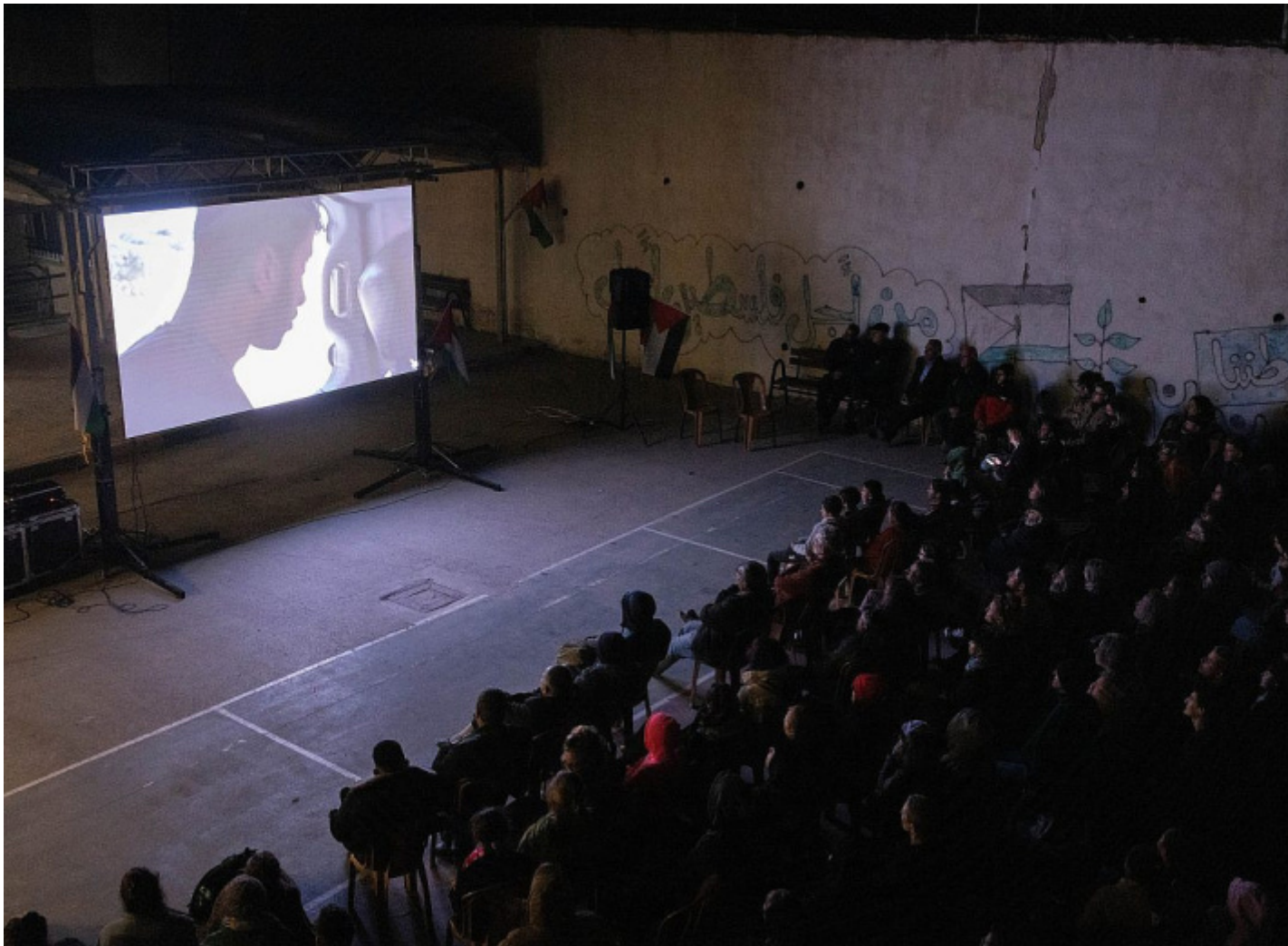
Proiezione di No Other Land ad At-Tuwani, Masafer Yatta, Cisgiordania occupata, 14 marzo 2024.