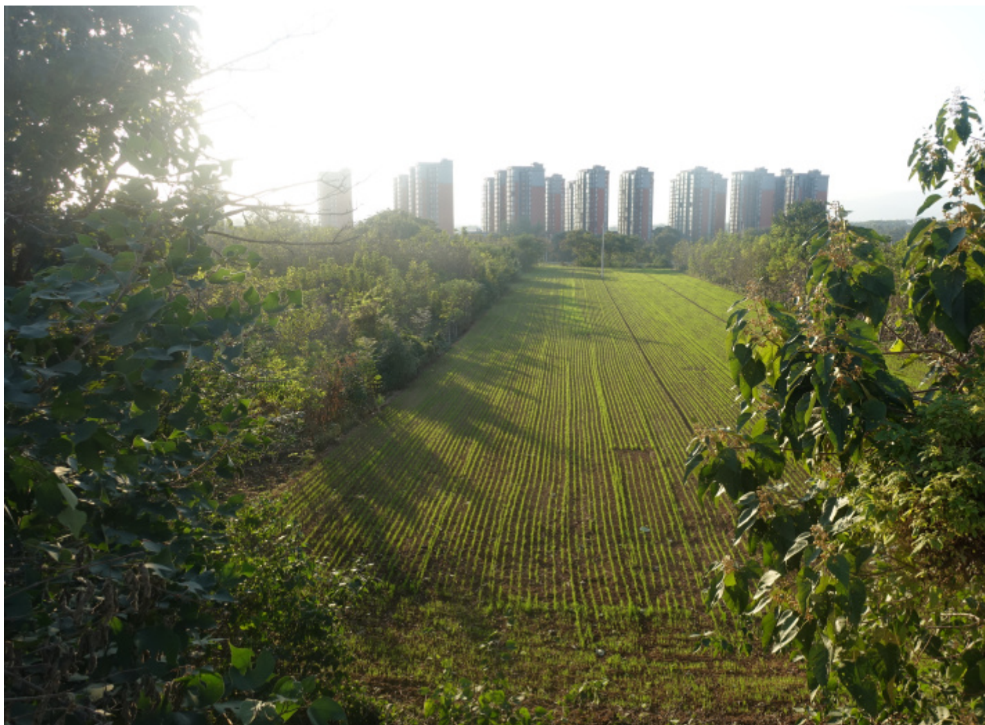
Grattacieli alla periferia di Xinmi, Henan.

Xinmi è un agglomerato piuttosto spontaneo, formatosi nei secoli attorno a una collina che vanta, sì, una tomba di epoca Han (la tomba della caccia alla tigre, Dahuting ???) ma oggi è formata in gran parte di costruzioni recenti o recentissime, ivi comprese alcune distese di grattacieli che si spingono fino ai campi di grano.