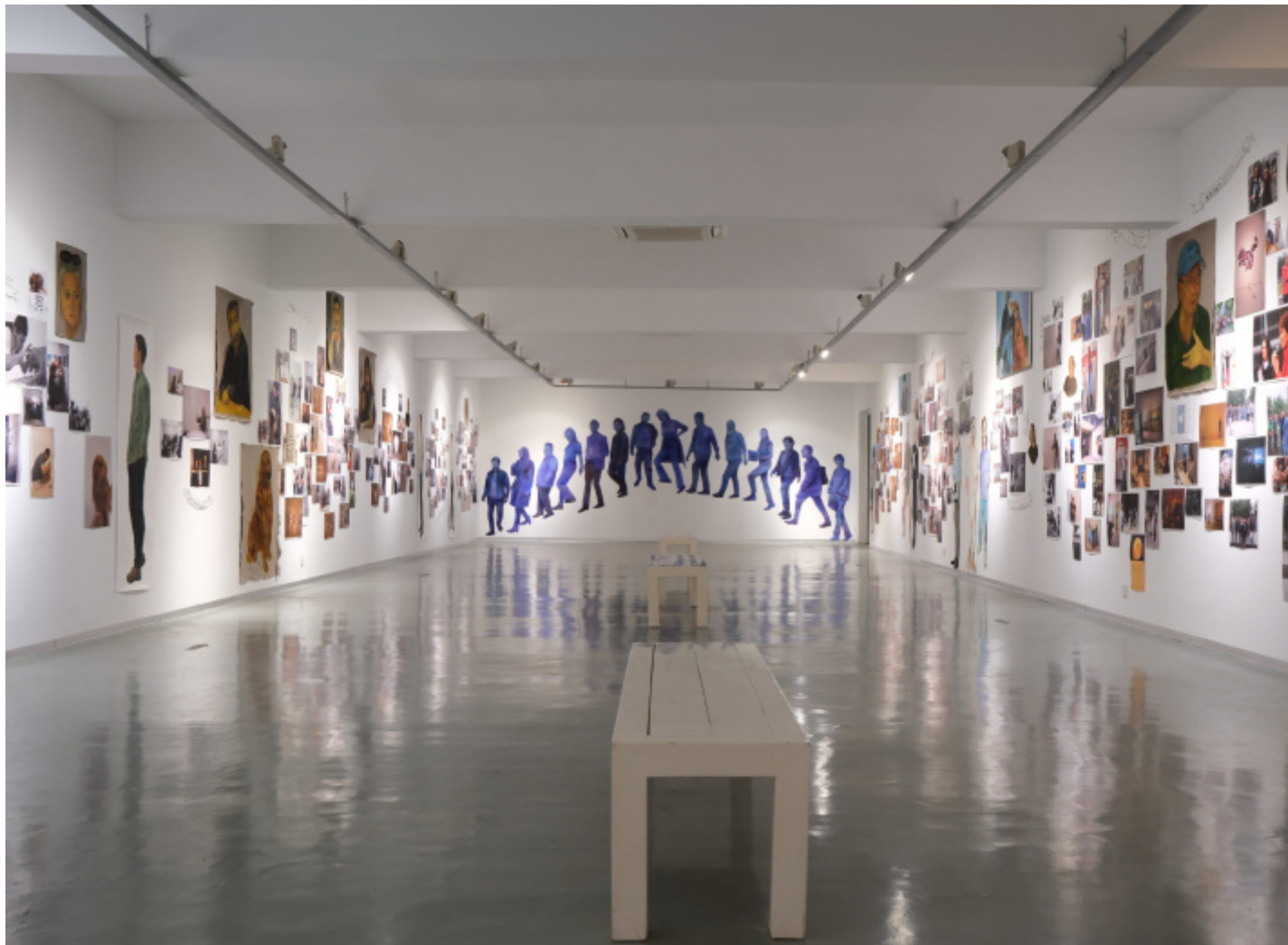
Spazio espositivo del Mo Art Space durante l'evento 10 anni al Mo Art Space , ottobre 2024.

Il visitatore che, uscito al casello dell'autostrada di Xinmi xi ??? (Xinmi Ovest) si ferma sullo stradone polveroso ( guodao ??, o strada statale), battuto ininterrottamente da lunghi camion sferraglianti, ed entra nel cortile interno alberato, si trova proiettato in una specie di hortus conclusus che stupisce piacevolmente e disorienta.