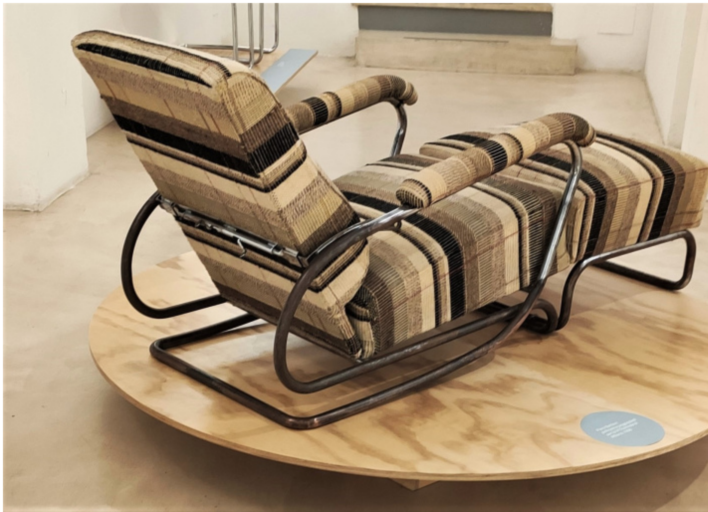
Poltrona con poggiatesta (realizzazione Columbus), 1936.

piano urbanistico per la città di Milano. Il progetto, che andrà sotto il nome di Piano A.R., rimarrà sostanzialmente sulla carta. In seguito alla richiesta Bottoni fornì un'ottantina di disegni di mobili singoli, ma anche quello sforzo non fu ripagato. La fornitura si limitò a tre mobili, e la figura di Bottoni venne silenziosamente esclusa dalle cronache.