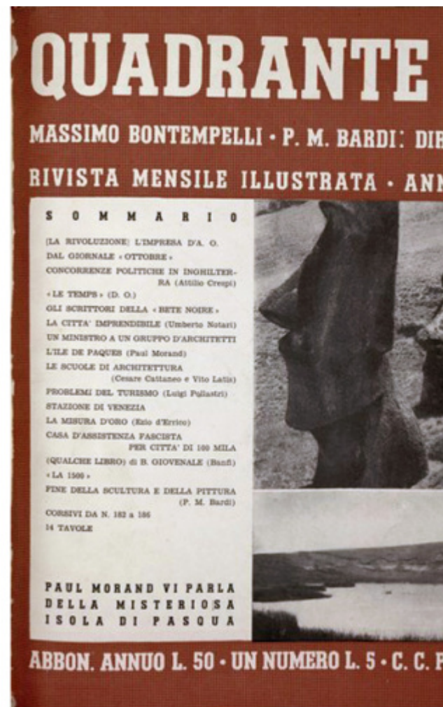
Studi per la copertina della rivista «Quadrante» e copertina del numero 27/28, 1935.

Un’ultima opportunità per attuare i propositi di Bottoni si ebbe nel 1945, pochi giorni prima della Liberazione, quando tramite una lettera l’A.P.E. – Società per lo sviluppo e l’esportazione delle produzioni artigiane – sollecitava l’invio di “progetti inediti e possibilmente di recente attuazione” da parte degli architetti del gruppo A.R. – in questo caso acronimo di Architetti Riuniti – i quali stavano lavorando a un