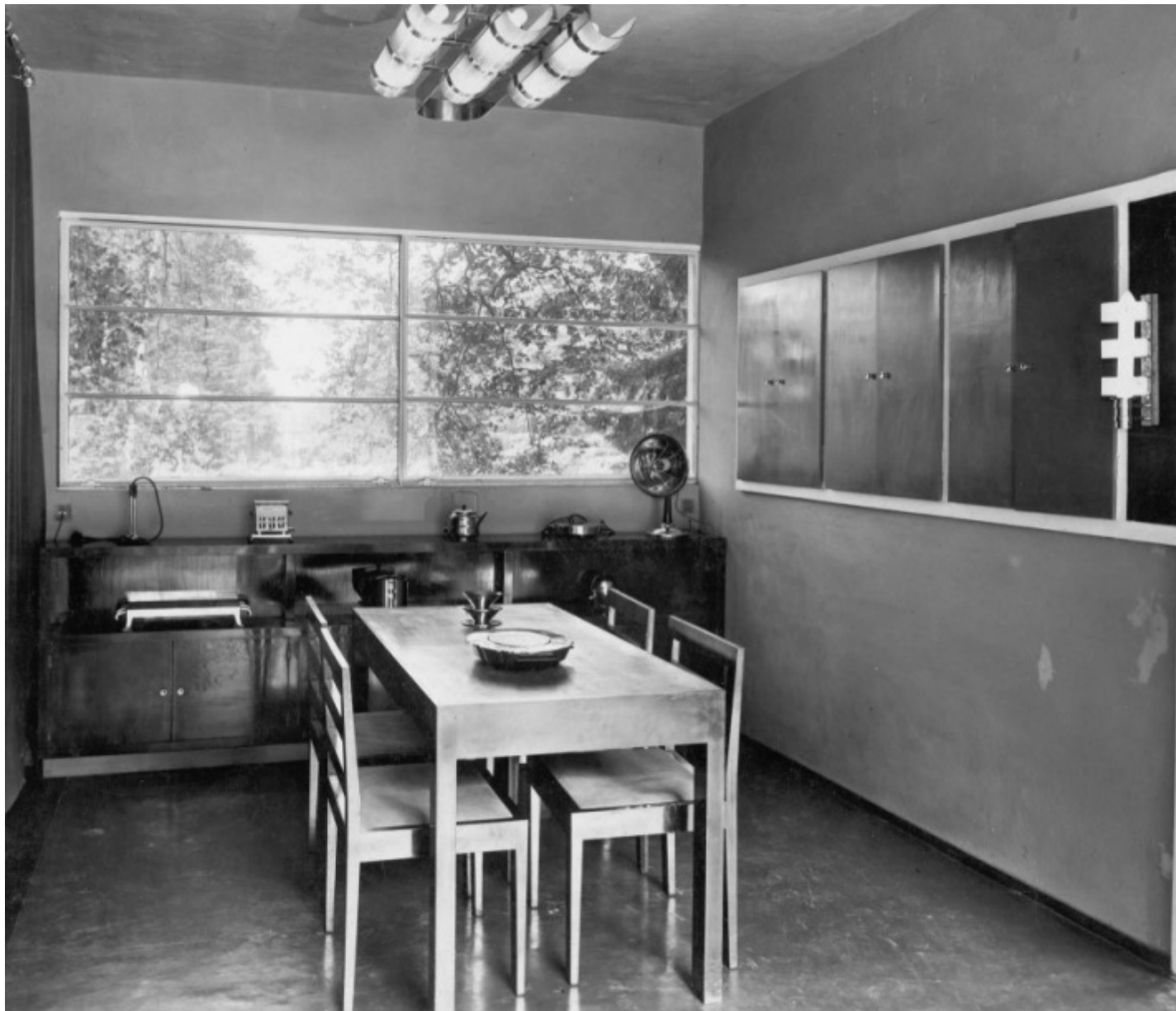
Locali di servizio nella Casa Elettrica, IV Esposizione internazionale delle arti decorative e industriali moderne di Monza, 1930. La sala da pranzo.

La straordinaria sintesi raggiunta nel titolo del volume di Giancarlo Consonni – Il design prima del design. Piero Bottoni e la produzione di mobili in serie in anticipo sulla società dei consumi (Edizioni La Vita Felice, 2024, pp. 180) – restituisce in una sola espressione gli esiti di un approfondito lavoro di ricerca intorno alla figura di Piero Bottoni e al tema della produzione di mobili in serie in anticipo sulla società dei consumi. L'indagine, frutto di oltre quarant'anni di studi all'interno del patrimonio documentale conservato nell' Archivio Piero Bottoni , presso il Politecnico di Milano , riscrive in larga misura le premesse che hanno caratterizzato la genesi del design italiano, portando alla luce alcune vicende fino a oggi poco note. Episodi da cui emerge in maniera chiara il valore civile dei modi attraverso cui si strutturano le prime società che già a partire dagli anni Trenta riuniscono gruppi di progettisti – tutti tra i trenta e i quarant'anni – associati in imprese commerciali con finalità condivise per la produzione di oggetti in serie.