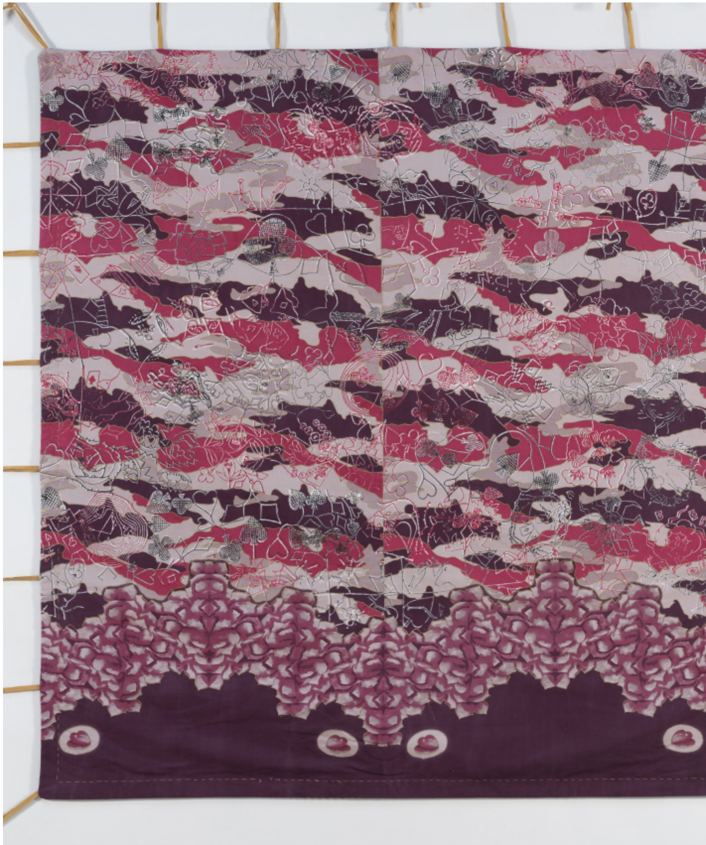
Tenda del diavolo, 2013-2014 (particolare)Tempera su cotone, ricamo, cuciture a mano, pali di bambù, finali in legno, corde, pesi in ferro, cm 600 x 400 x 300, Collezione dell'artista.

Unendo i suoi studi, le sue ricerche, le suggestioni vissute durante i suoi viaggi, da autodidatta ha elaborato un particolare linguaggio visivo profondamente simbolico, che trae linfa dalla cultura occidentale e da quella orientale, espresso mediante una varietà di tecniche e materiali. Dalla pittura ad olio alla tempera; dall'acquerello ai pastelli, all'encausto, all'affresco, fino alla scultura e alla ceramica. Un variegato