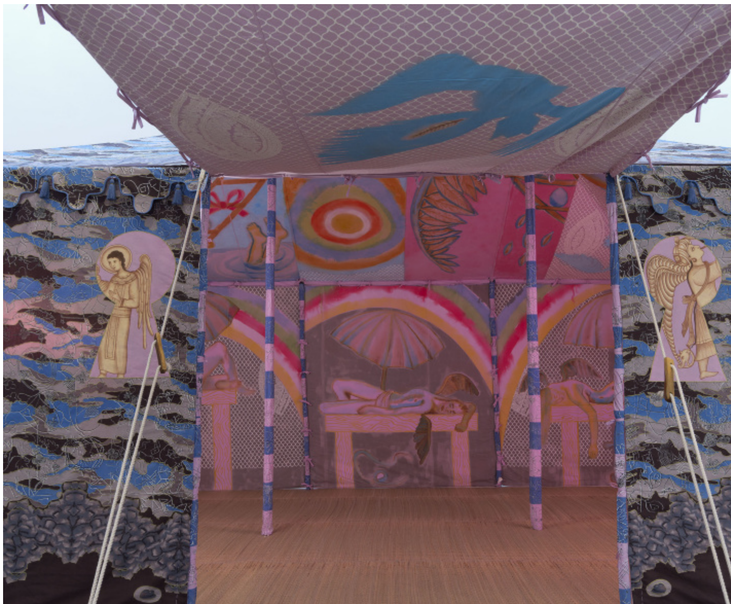
Tenda degli angeli, 2013-2014 (particolare, esterno)Tempera su cotone, ricamo, cuciture a mano, pali di bambù, finali in legno, corde, pesi in ferro, cm 600 x 400 x 300Collezione dell'artista.