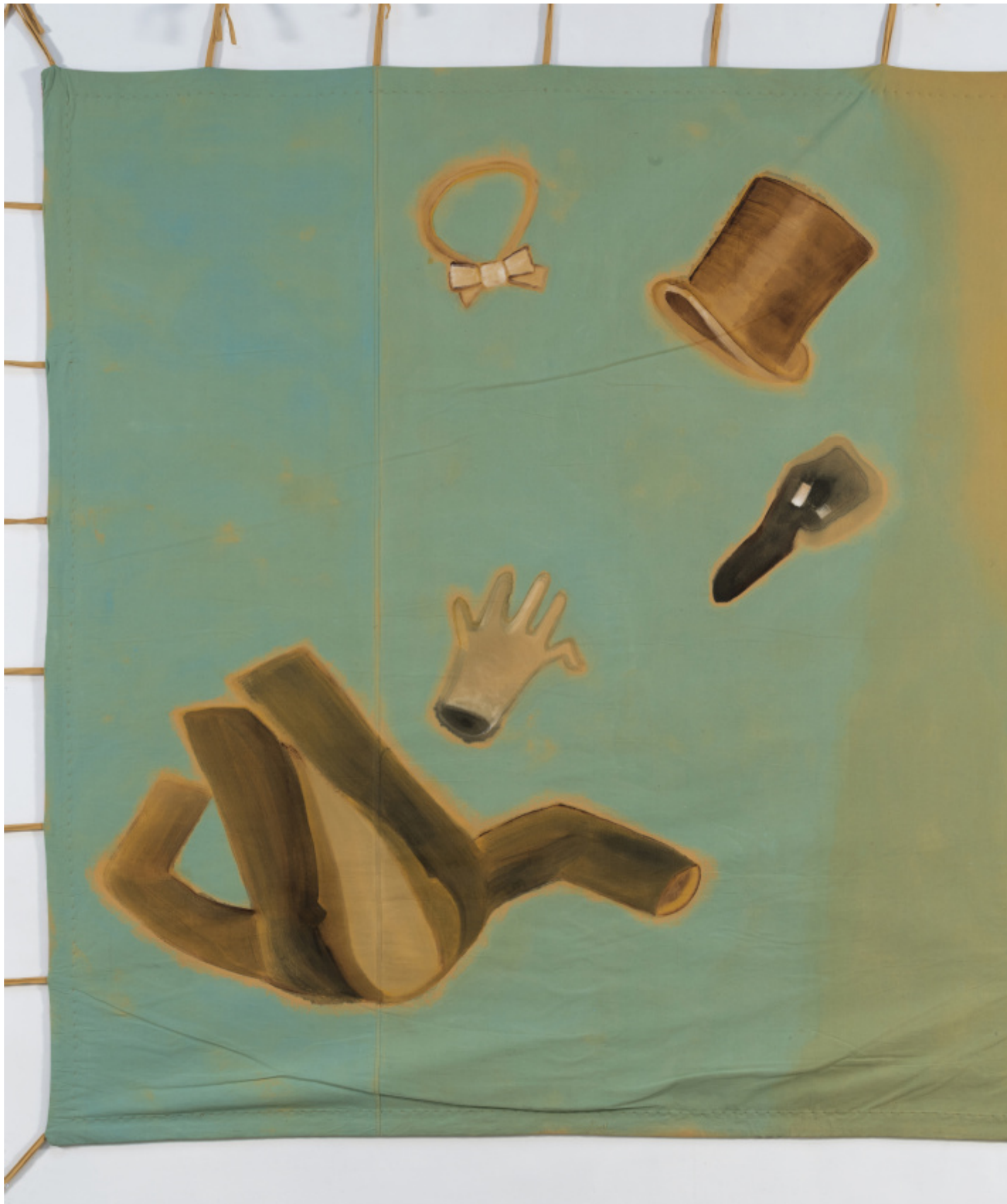
Tenda del diavolo, 2013-2014 (particolare)Tempera su cotone, ricamo, cuciture a mano, pali di bambù, finali in legno, corde, pesi in ferro, cm 600 x 400 x 300, Collezione dell'artista.

Prassi, quella di realizzare i propri lavori a più mani, che da sempre lo caratterizzano. Basti ricordare il libro creato insieme al poeta Allen Ginsberg, o le collaborazioni con Jean-Michel Basquiat e Andy Warhol, con i quali ha avviato la composizione di lavori di grande formato. È sempre negli stessi anni Ottanta, che si fissano alcuni dei momenti salienti della sua carriera artistica. A partire dalla sua presenza alla 39. Biennale di