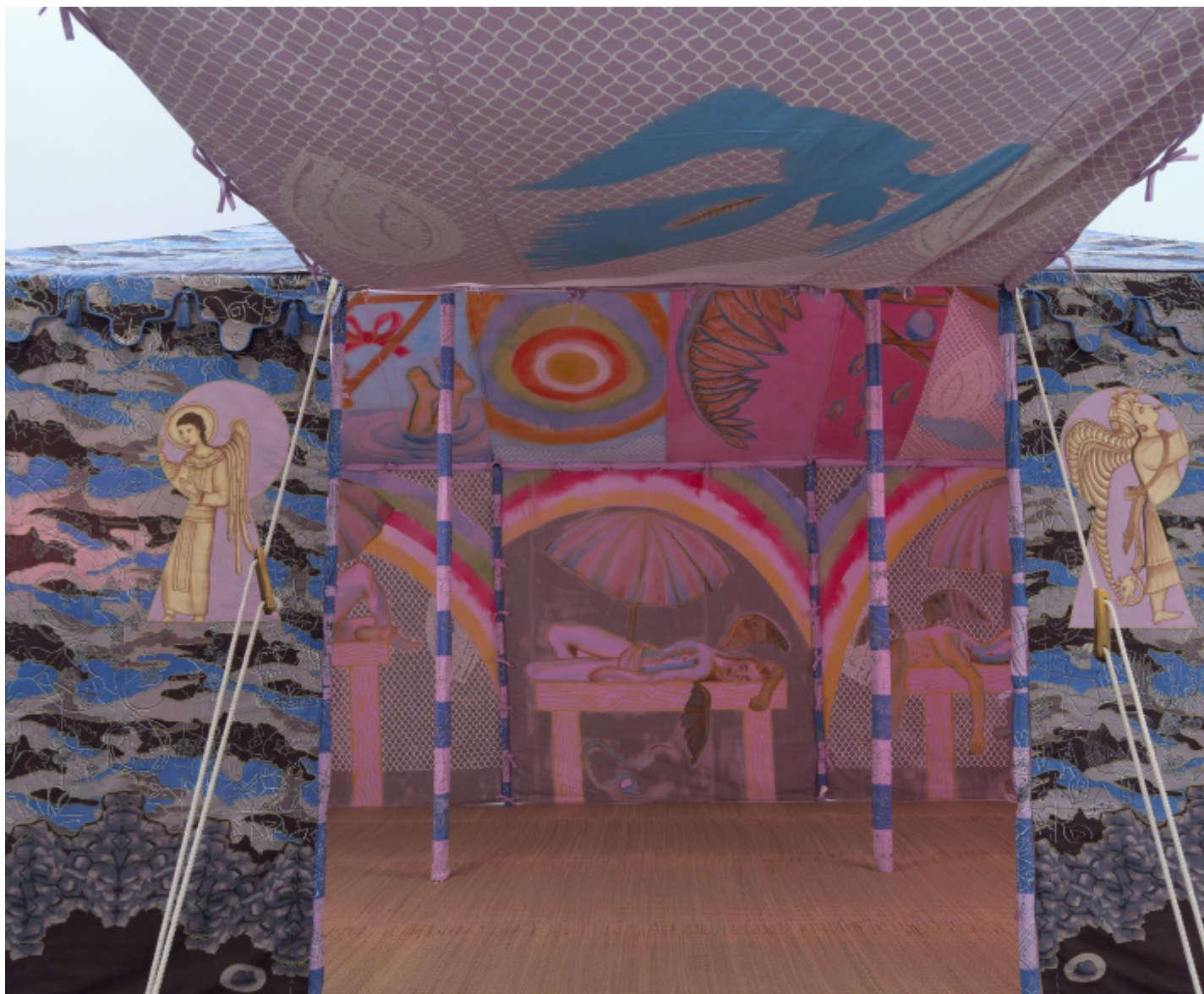
Tenda degli angeli, 2013-2014 (particolare, esterno) Tempera su cotone, ricamo, cuciture a mano, pali di bambù, finali in legno, corde, pesi in ferro, cm 600 x 400 x 300 Collezione dell'artista.