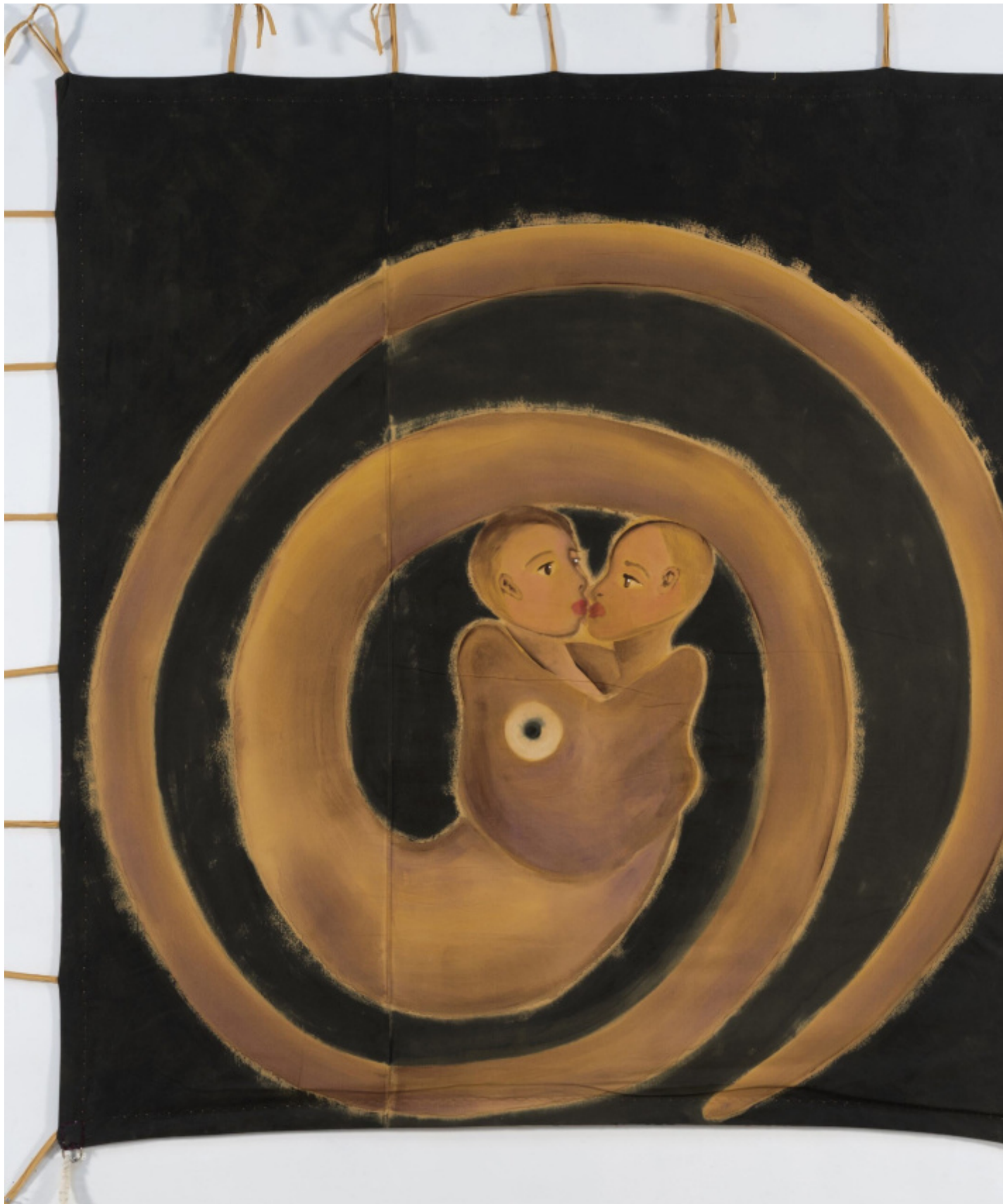
Tenda del diavolo, 2013-2014 (particolare)Tempera su cotone, ricamo, cuciture a mano, pali di bambù, finali in legno, corde, pesi in ferro, cm 600 x 400 x 300, Collezione dell'artista.

Nonostante dagli anni Ottanta risieda a New York, non ha mai avvertito il distacco dalla sua città d'origine, Napoli (dov'è nato nel 1952), perché è «una periferia» della grande mela. Radici ben salde nella città partenopea, attestate altresì da Ave, Ovo! , il monumentale affresco site specific realizzato, nel 2003,