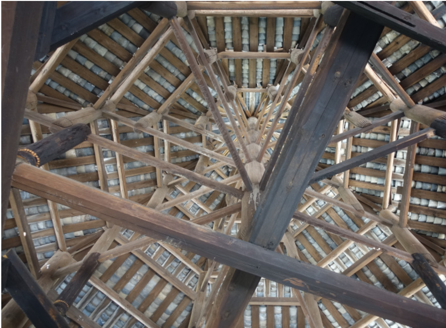
Vista dall'interno di una torre del tamburo Vista dall'interno di una torre del tamburo