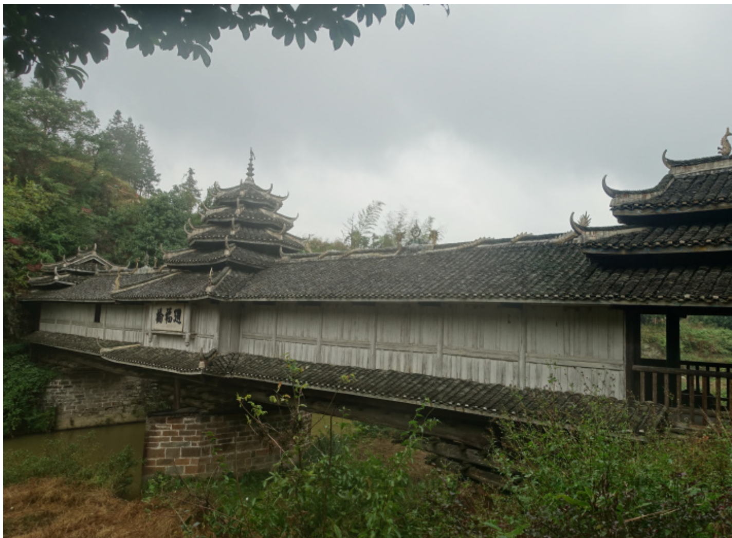
Ponte 'vento e pioggia' Pingtan nello Xiangxi

Si ha la sensazione che ogni sentimento religioso o anche culturale venga sostituito a poco a poco da vuote apparenze, ma gli esseri umani sono pieni di risorse e potrebbero riservarci delle sorprese, soprattutto in queste regioni così misteriose.