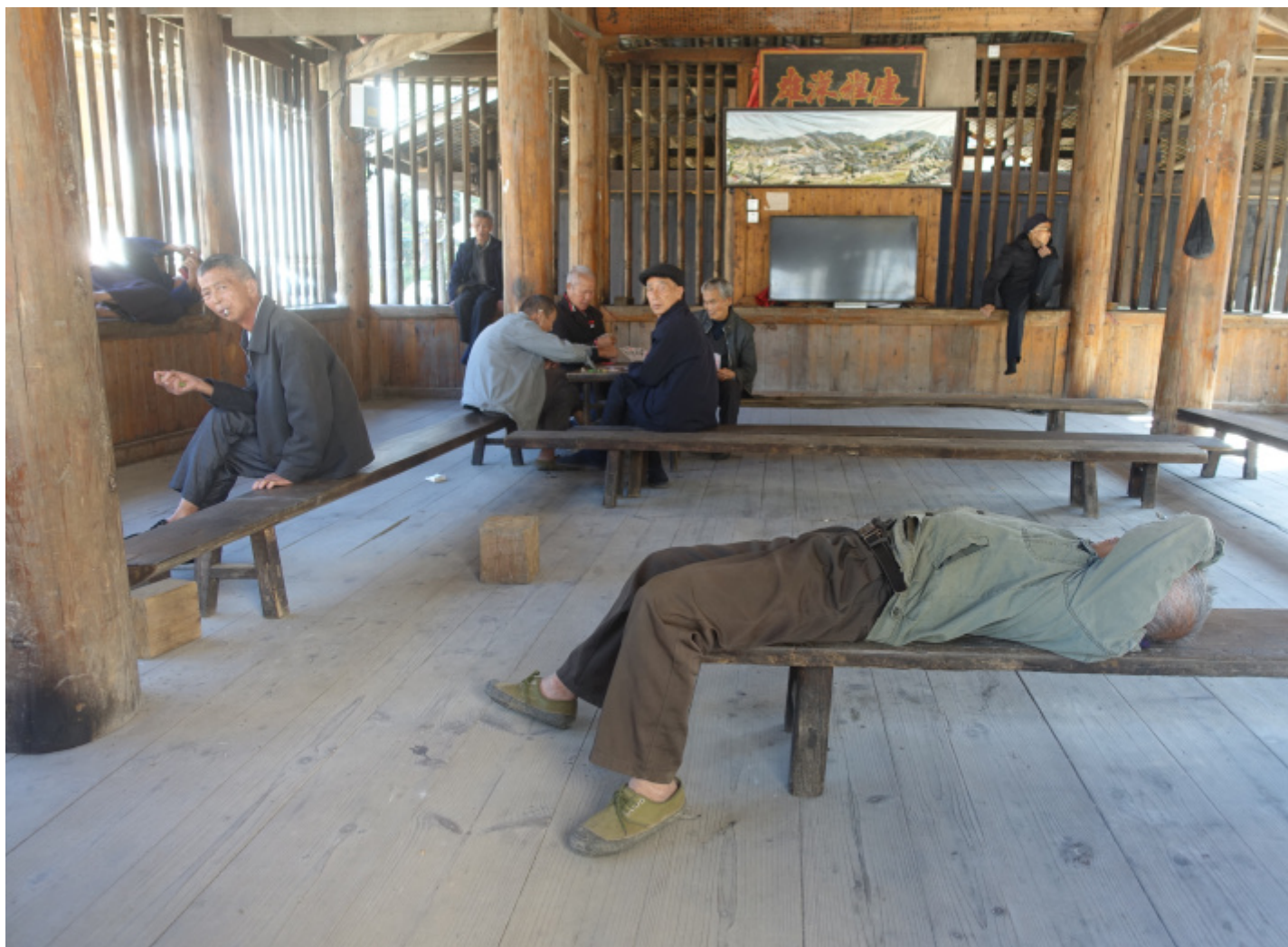
Uomini in ozio nella torre del tamburo.

Al pianterreno ci sono panche su cui si chiacchiera, si gioca a carte, si fa il pisolino (ma solo gli uomini! Le donne sono sempre sveglie), si fissa il vuoto con espressioni assortite, si guarda la televisione se c'è, si alimenta il fuoco acceso al centro. In alcuni casi al secondo piano, con pavimento anch'esso in legno, sono conservati strumenti musicali di bambù, a fiato, fotografie, oggetti utilizzati nelle festività. Conto otto o nove tetti sovrapposti, suddivisi su otto lati; i più alti a volte hanno orientamenti sfalsati rispetto agli altri. Il gioco di tettoie è sostenuto all'interno da teorie di pilastri a vista in legno, rotondeggianti, spesso rastremati verso il basso. Quelli portanti arrivano fino a terra, altri sono molto corti e collegano fra di loro le travi orizzontali, rettangolari. Anche le tegole di terracotta che ricoprono l'edificio sono perfettamente visibili dall'interno dell'edificio, appoggiate sulle assi allineate con cura. Le torri ad uso collettivo sono decisamente ancora il centro della vita locale, frequentate soprattutto da persone di età piuttosto avanzata perché, come in tutte le zone rurali, i giovani sono andati a lavorare altrove.