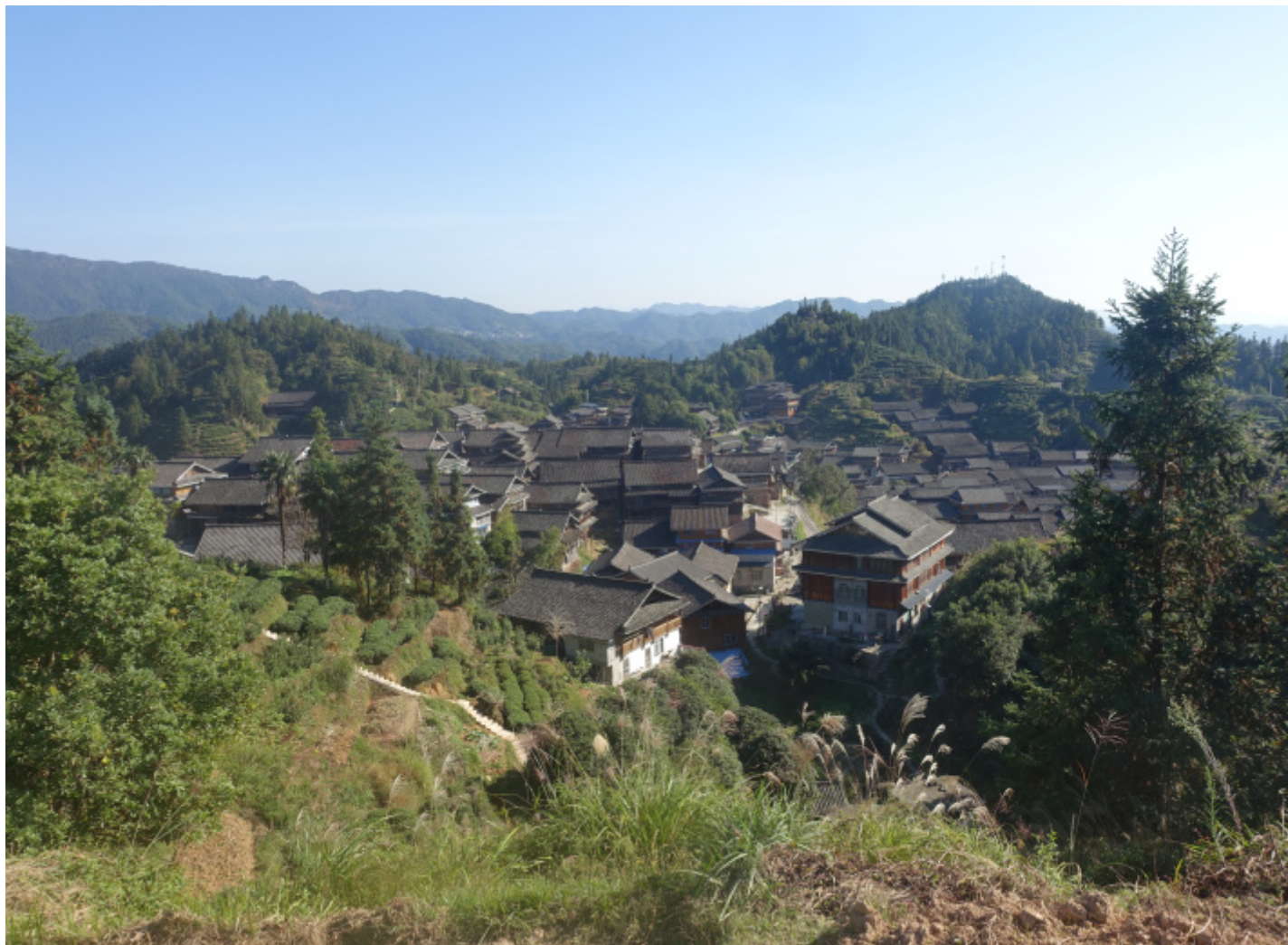
Villaggio di Gaoyou

Piccoli appezzamenti coltivati a camellia sinensis (tè).