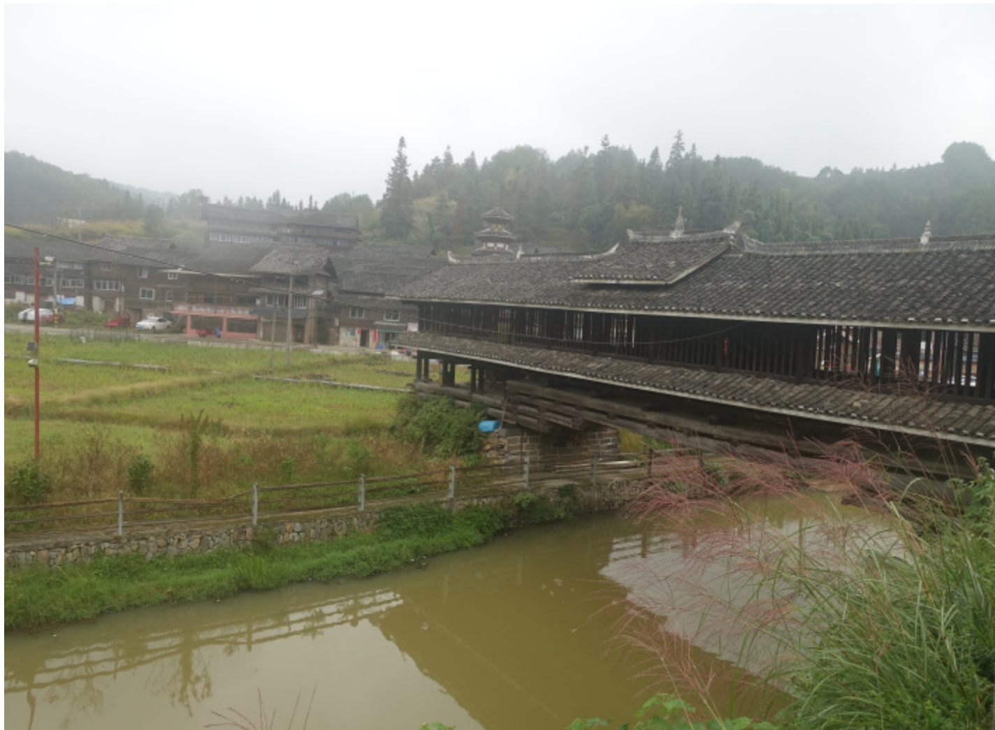
Ponte 'vento e pioggia' nello Xiangxi