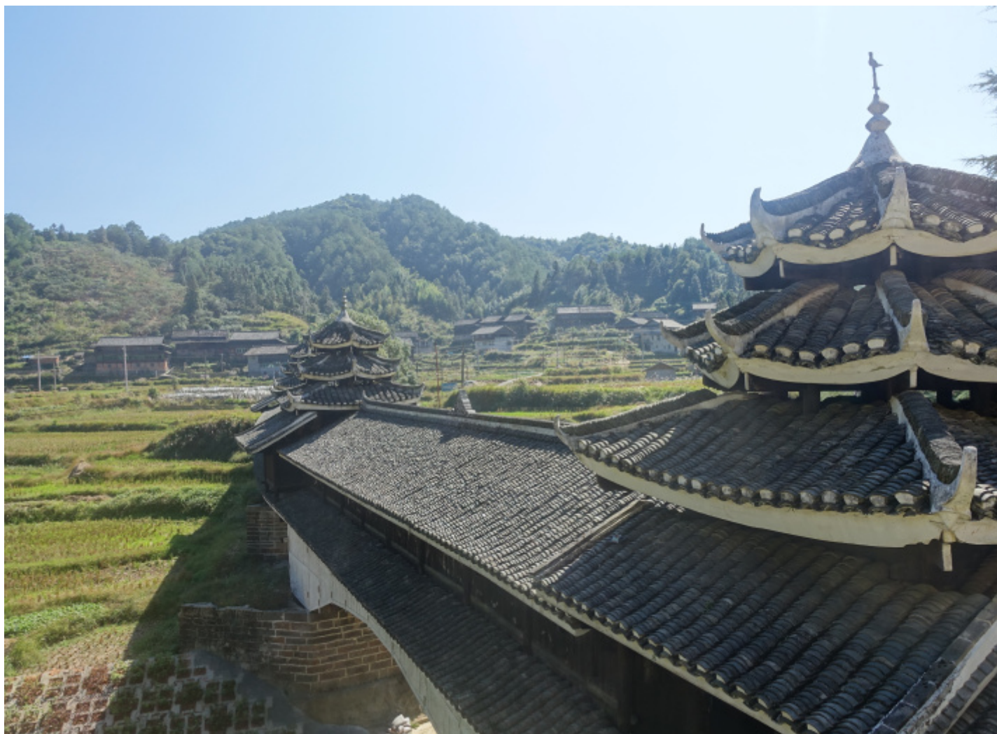
Torre del tamburo con palco per spettacoli

certificato di residenza) è registrato – per qualche motivo ormai dimenticato – come esponente dell'etnia Dong, per quanto entrambi i genitori siano Han, e ciò gli ha portato il vantaggio di essere ammesso in un'università dedicata alle minoranze etniche, ma anche risvolti meno favorevoli. Per esempio chissà perché non può ottenere il permesso per andare a Hong Kong.