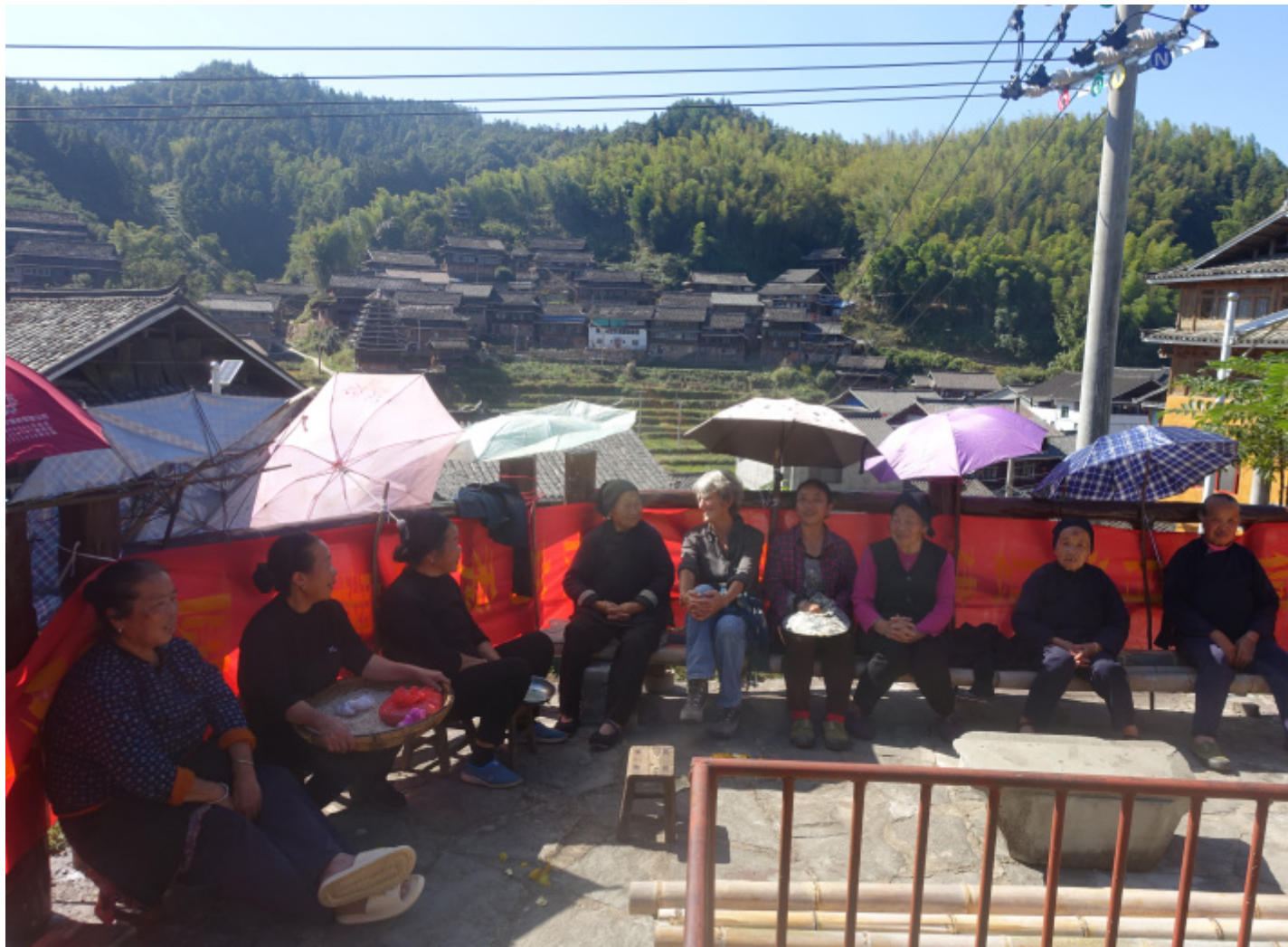
Consesso di donne al sole.