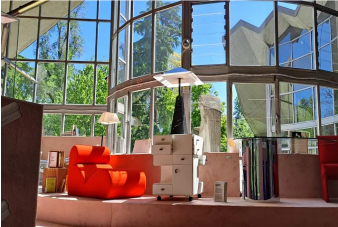
Uno scorcio della mostra dedicata a Cini Boeri, allestita da Triennale dal 15 al 28 aprile 2024 nella Biblioteca del Parco Sempione; a sinistra la libreria girevole.