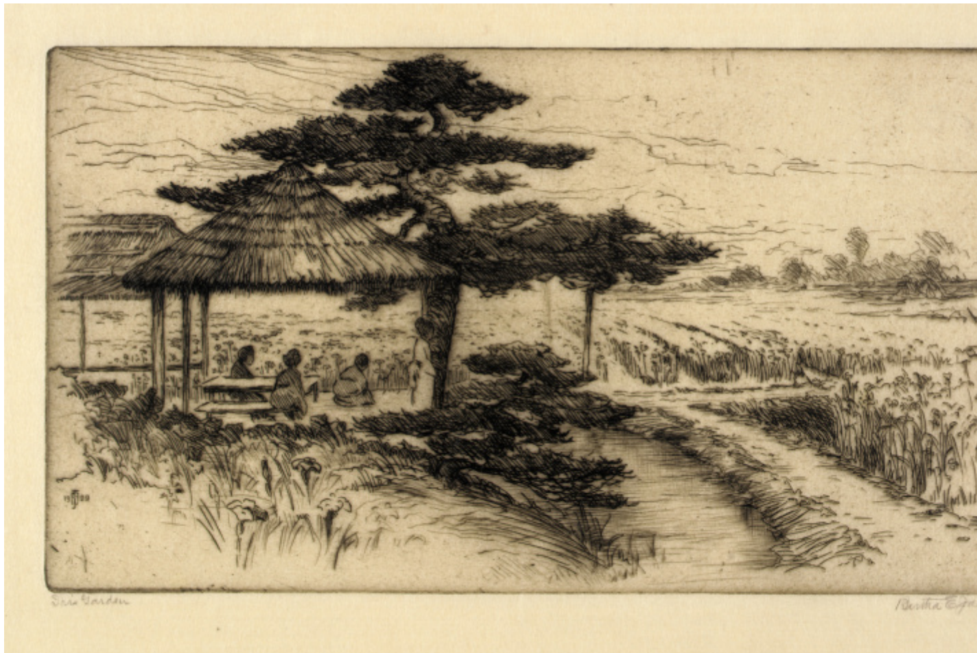
Bertha E. Jaques, Iris Garden , 1909, etching on paper, plate/ 5 x 8 7/8 in. (12.6 x 22.7 cm), Smithsonian American Art Museum.

«Pensavo di essere più orientale che occidentale» osserva Amélie nelle prime pagine rievocando la propria infanzia, salvo poi opporre la sentenza più ardua «scoprii che in Giappone non potevo vivere», ovvero rievocare l'abbandono, stavolta volontario, cui la costrinse l'età adulta. Il secondo "trauma giapponese" fu rievocato da Nothomb nelle tragicomiche peripezie narrate in Stupori e tremori (1999) in cui raccontava la propria drammatica esperienza lavorativa presso la multinazionale Yumimoto. Vessata dalla sua superiore, l'algida e inflessibile Fubuki, oppressa e dequalificata da una cultura professionale che non considerava l'individuo ma solo il sistema, alla scadenza del contratto Amélie, ventitreenne, lasciava il Giappone e tornava in Belgio – era la sua partenza ultima, definitiva. Da quel momento sarebbe iniziata la sua seconda vita, la vita da scrittrice, che in qualche maniera si poneva come un risarcimento della prima, ovvero l'esistenza giapponese mancata. Un susseguirsi di cause-conseguenze che Nothomb esprime bene e analizza con dovizia in L'impossibile ritorno :