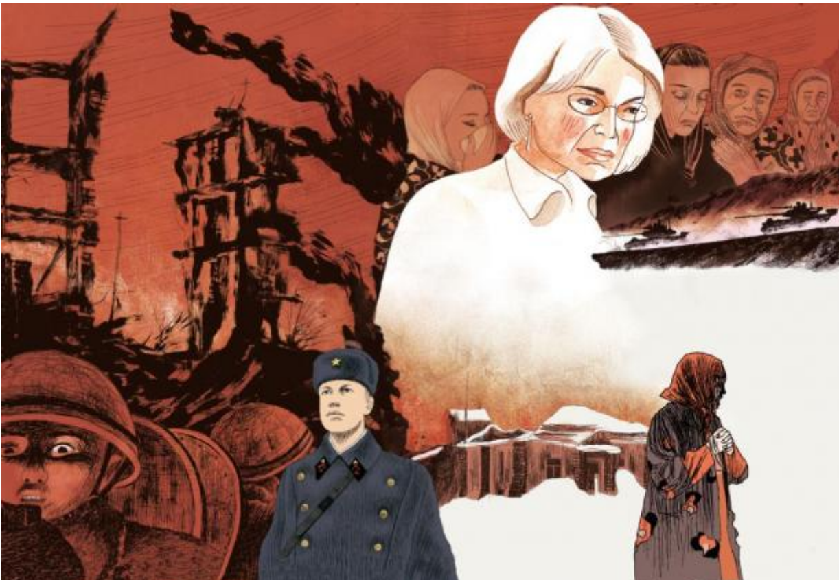
Igort, Quaderni Russi.