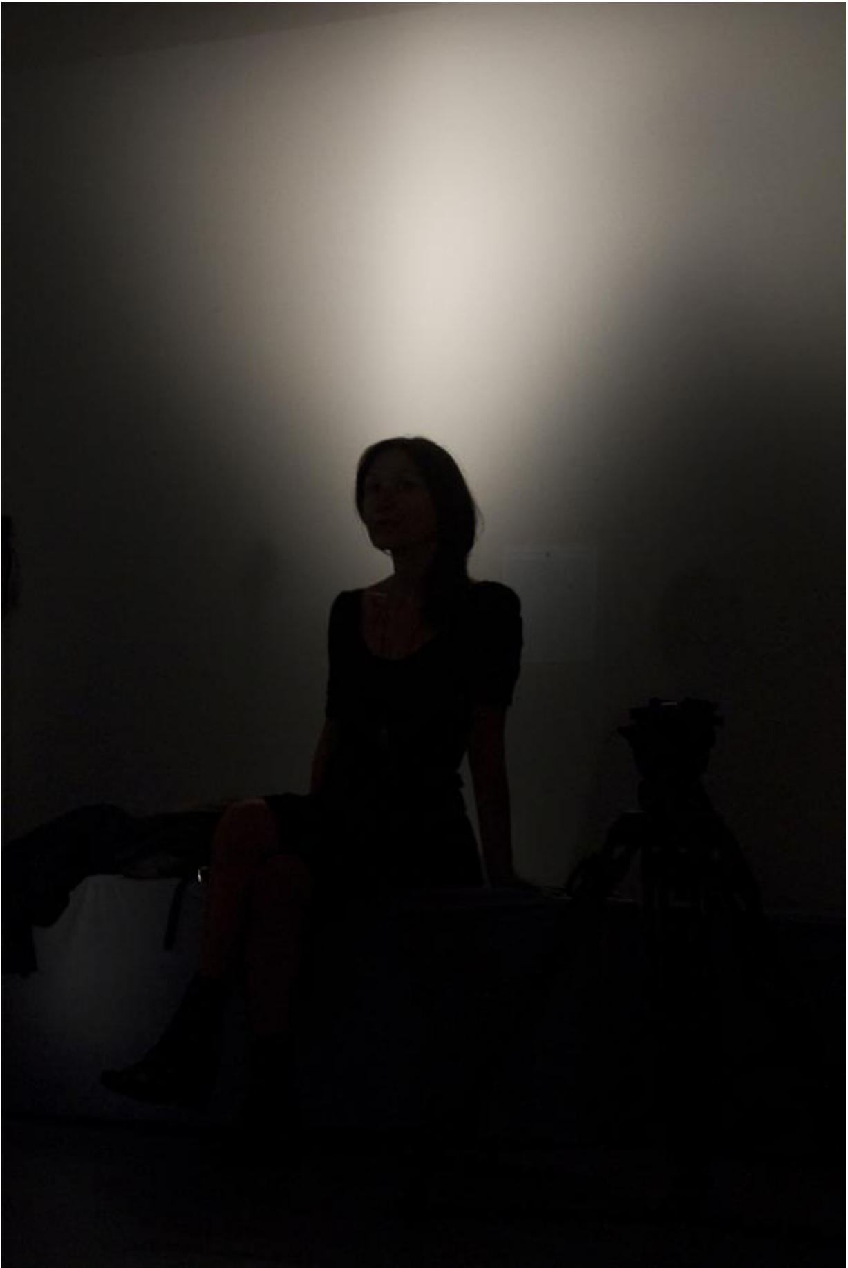
Poco lontano da qui, foto di Claire Pasquier.