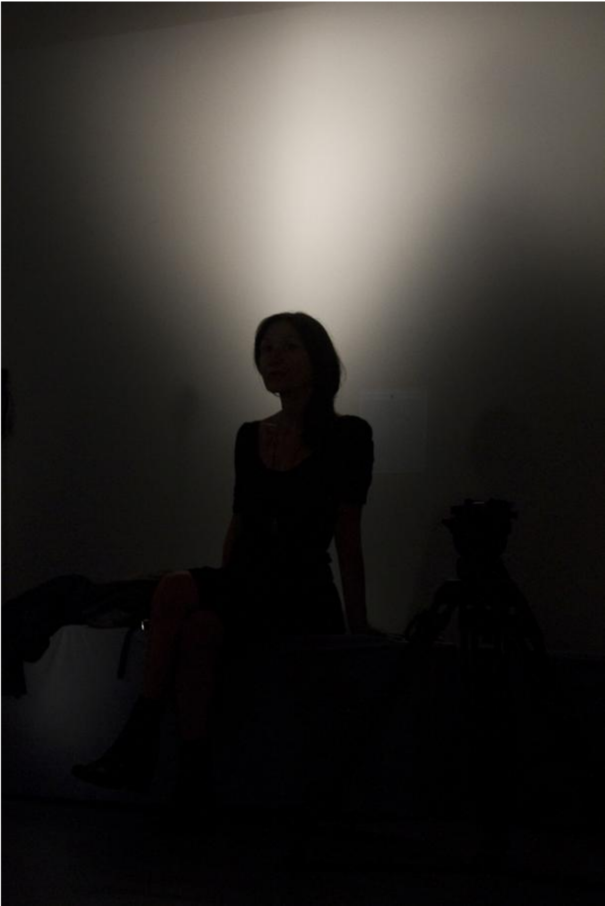
Poco lontano da qui.