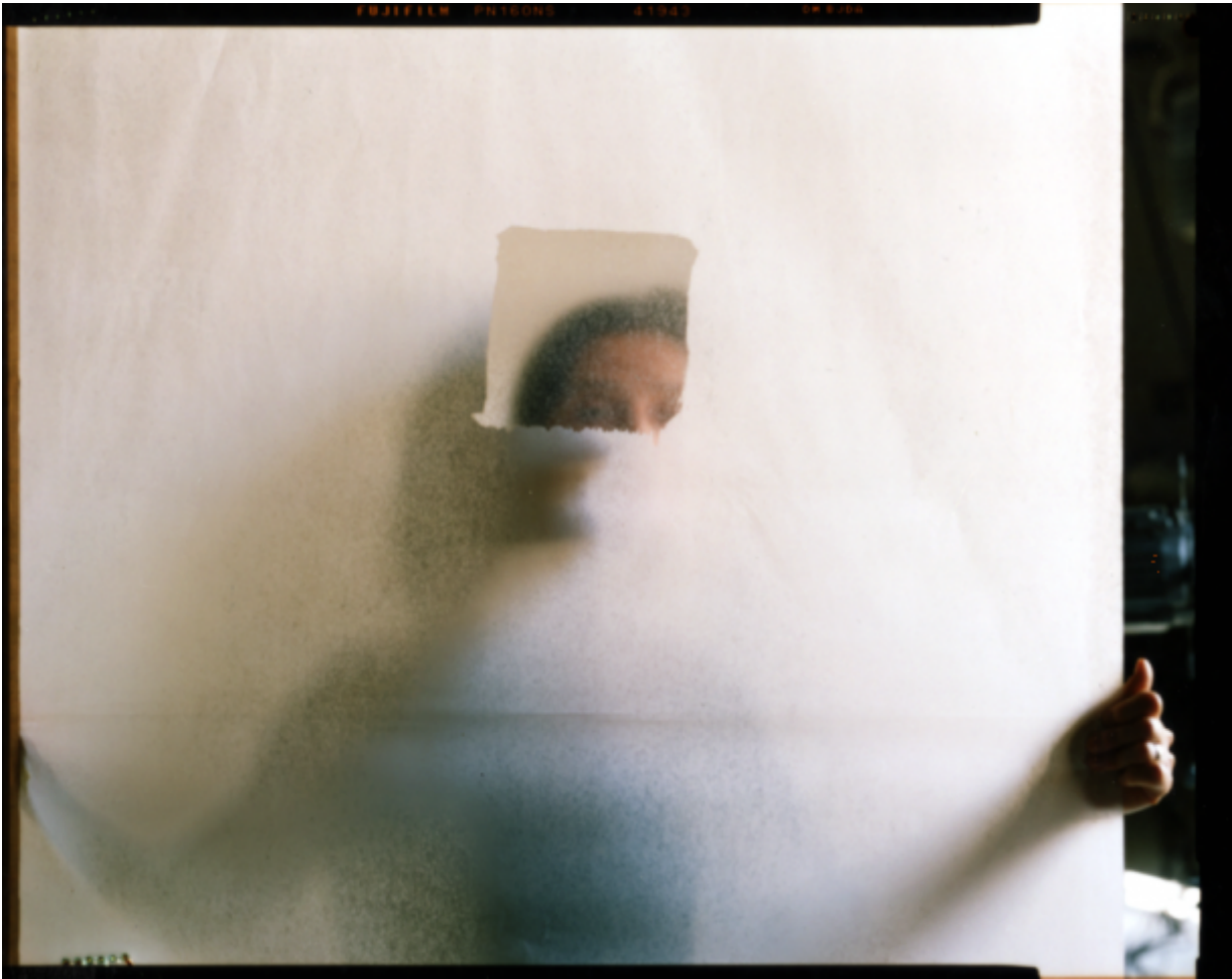
Poco lontano da qui