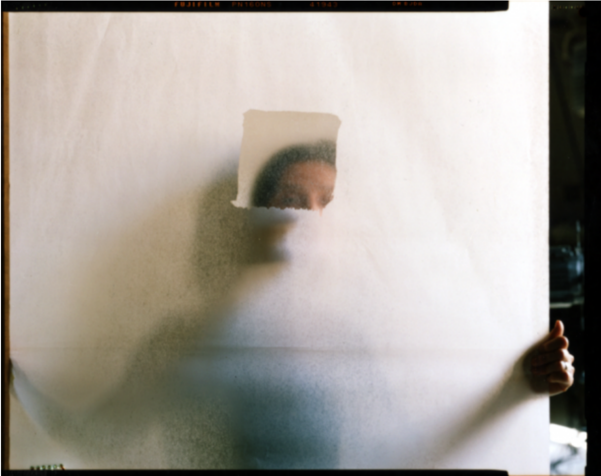
Poco lontano da qui