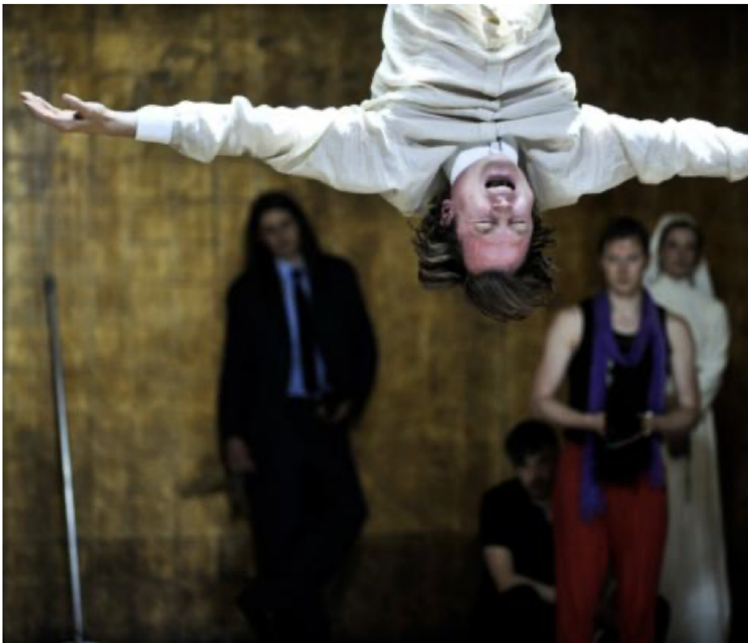
Mass fuer Mass.

violenza, le nostre vite. L'Amleto interpretato da Eidinger, che il giorno del cinquantesimo anniversario ha calcato le scene della Schaubühne, è un uomo del nostro tempo, grassoccio, nichilista e arrabbiato, che sembra aver già risolto dentro di sé il dubbio se essere o non essere, ma che si diverte ancora a smontare il sistema delle apparenze di una società dominata dal consumismo. È il classico, di nuovo, a rivelare noi stessi.