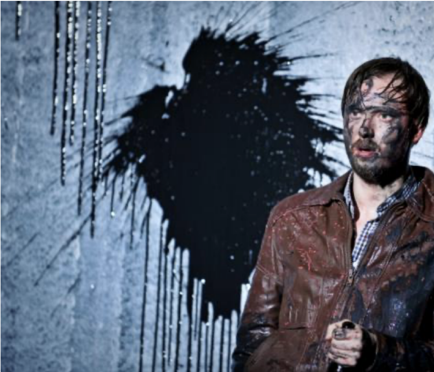
Ein Volksfeind.

Ma l'avventura della Schaubühne Ostermeier non l'aveva iniziata da solo: dal 1999 al 2004 il teatro è diretto da quattro artisti, Jens Hillje, Jochen Sandig e Sasha Waltz. L'intento era quello di ritrovare la dimensione del lavoro collettivo e della collaborazione tra diverse discipline come il teatro e la danza. Esperimento, quest'ultimo, mai riuscito, almeno con la Waltz; Ostermeier riuscirà tuttavia a dare vita a questo progetto con lo spettacolo Sommernachtstraum , rifacimento del 2006 dal Sogno di Shakespeare, il cui testo scompare quasi del tutto sciogliendosi nella coreografia di Constanza Macras.