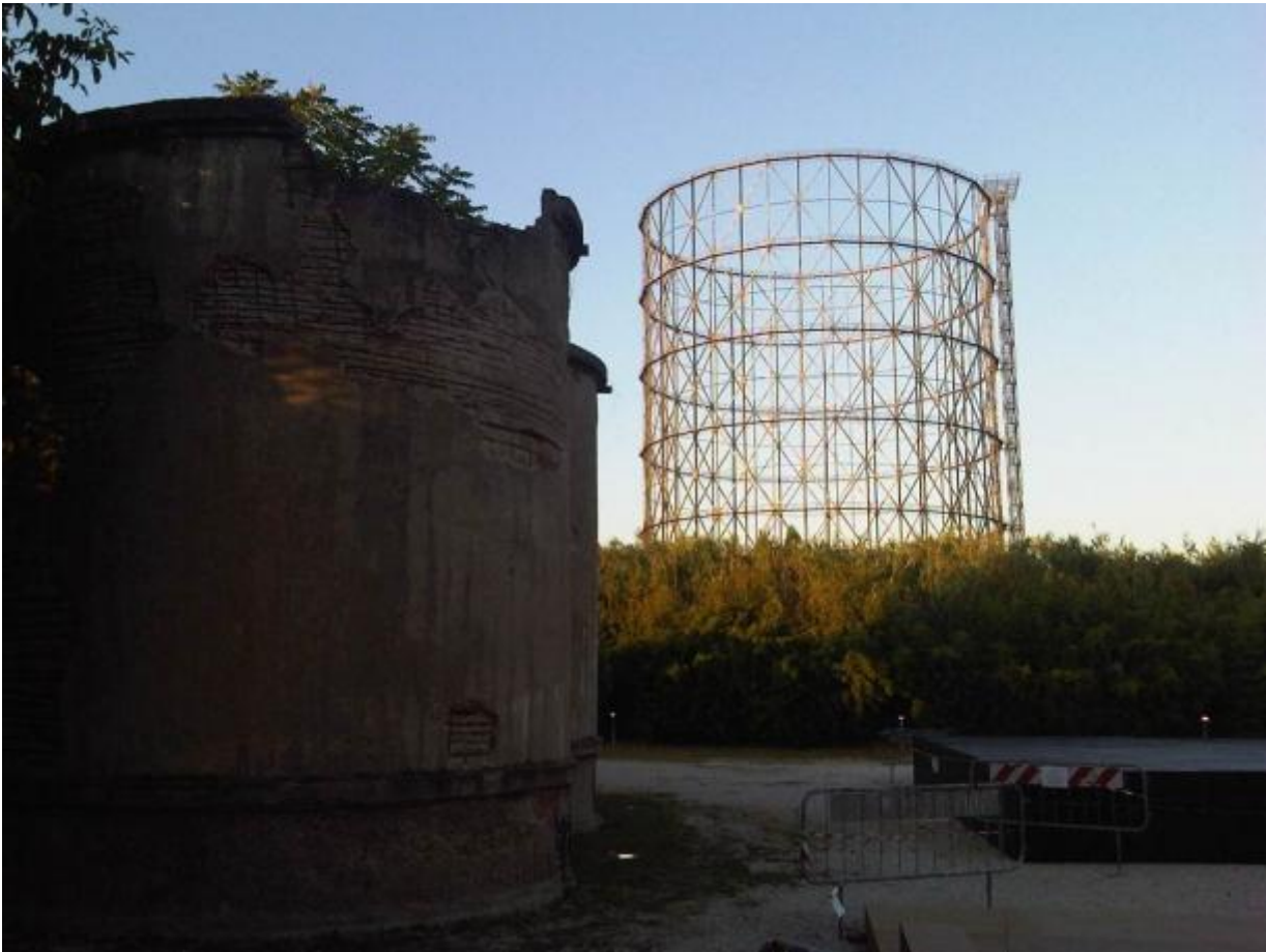
Spazi esterni del Teatro India

Mentre questo articolo viene redatto alcuni dei progetti sono già noti.