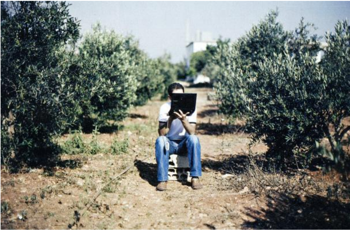
Siria 2011

Studiosi come Mark LeVine si spingono a parlare dell'aura di Apple che, dopo aver "irradiato" artisti, designer e creativi della Silicon Valley , ora investe l'"Arabo", trasformandolo in un rivoluzionario. Come suggeriscono alcune foto pubblicate nel 2011 dal New York Times nella consueta galleria di fine anno, l'aura emessa dai dispositivi tecnologici occidentali è capace di illuminare e restituire una individualità anche alle donne rese tutte uguali dal velo, come avviene nelle foto di una manifestazione in Qatar.