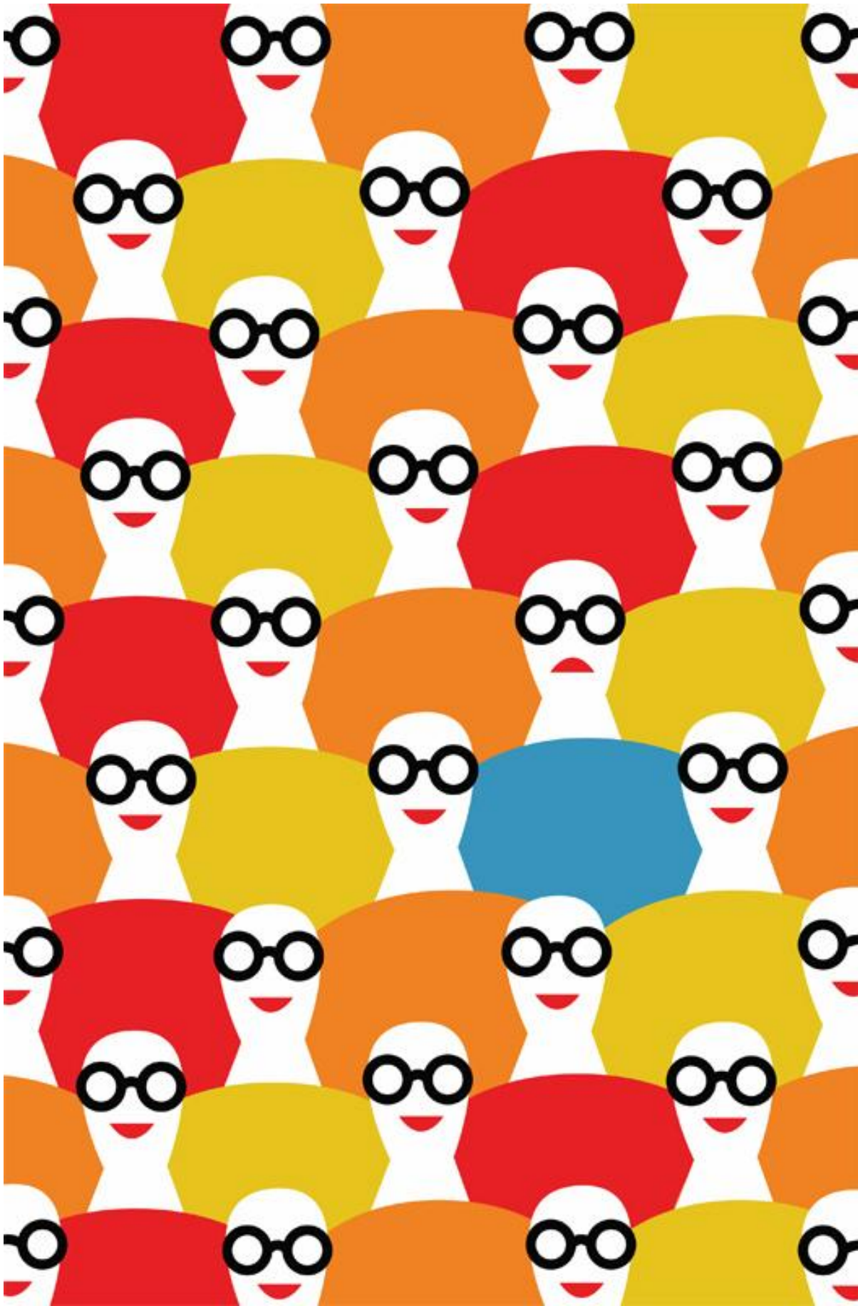
Happysm, cover per La Repubblica/Cult