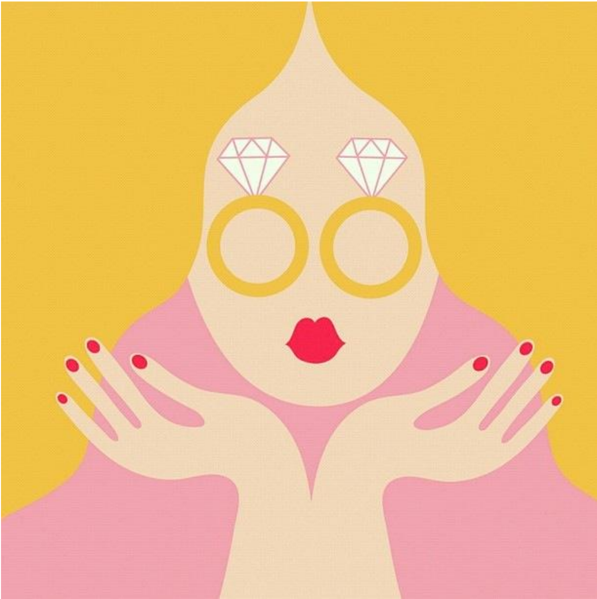
Marry me!, illustrazione per il magazine francese Be