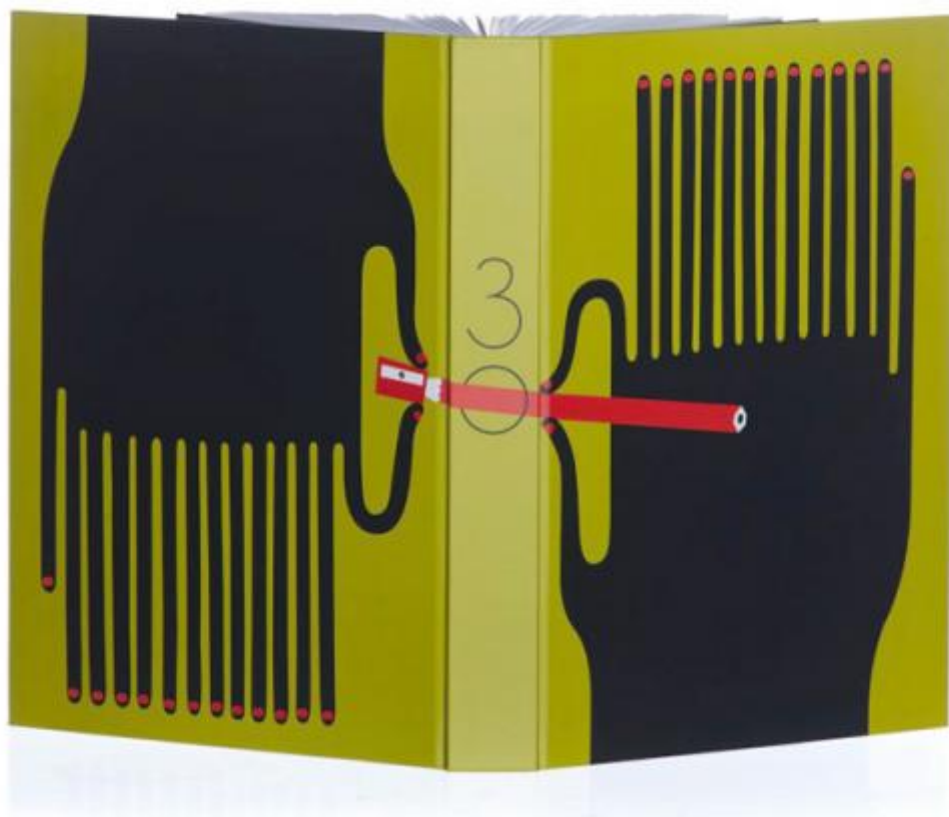
Mano a mano, illustrazione per la copertina di American Illustration, 30