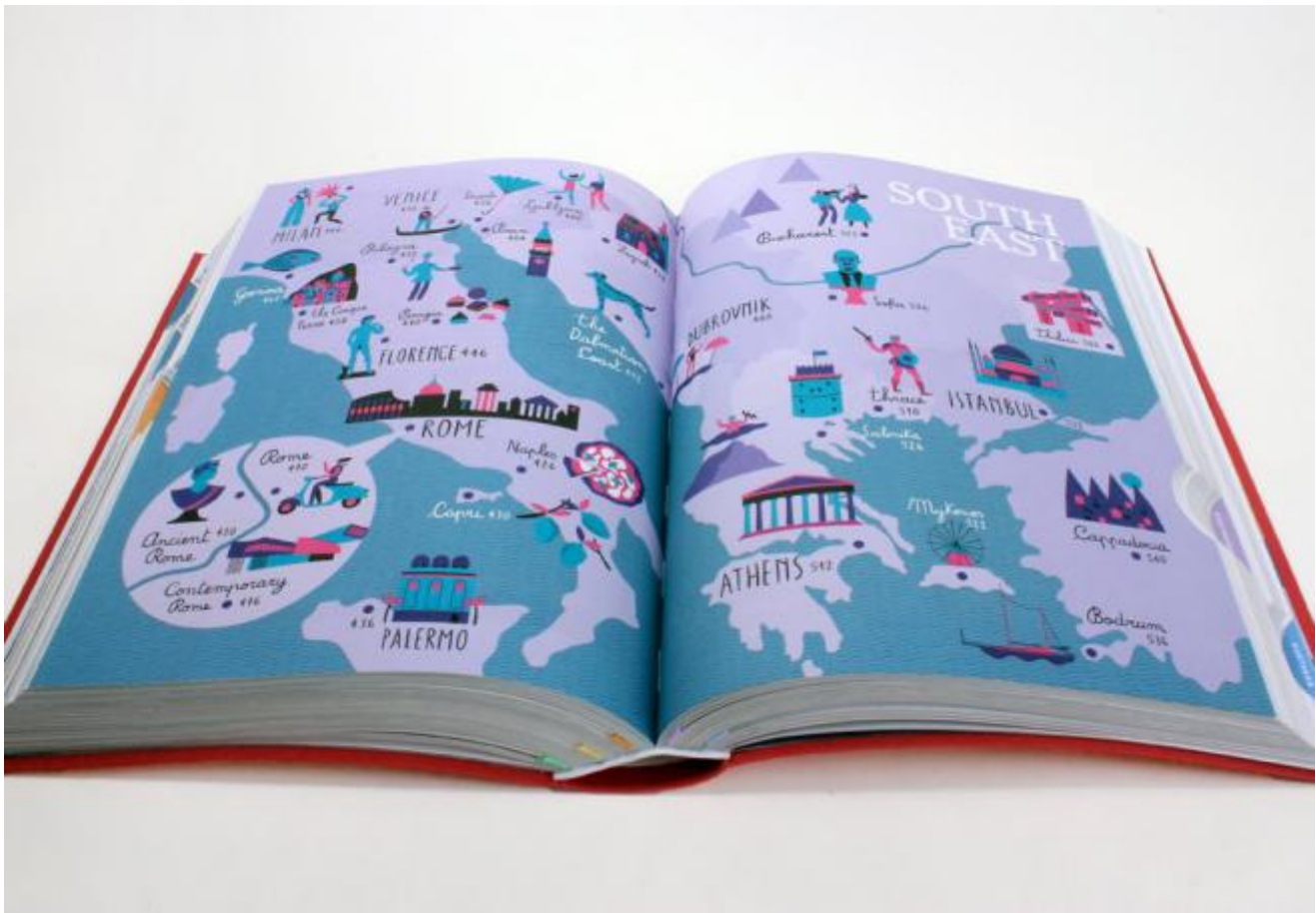
Illustrazione per la guida del The New York Times 36 Hours - 125 Weekends in Europe

OZ – altro modo in cui si firma – non ha paura del confronto e della contaminazione, e passa dalle illustrazioni per libri e riviste alla regia di video musicali (come quello per Non ho tempo di Bugo) o all’ideazione delle icone e della grafica per l’app del New York Times su New York.