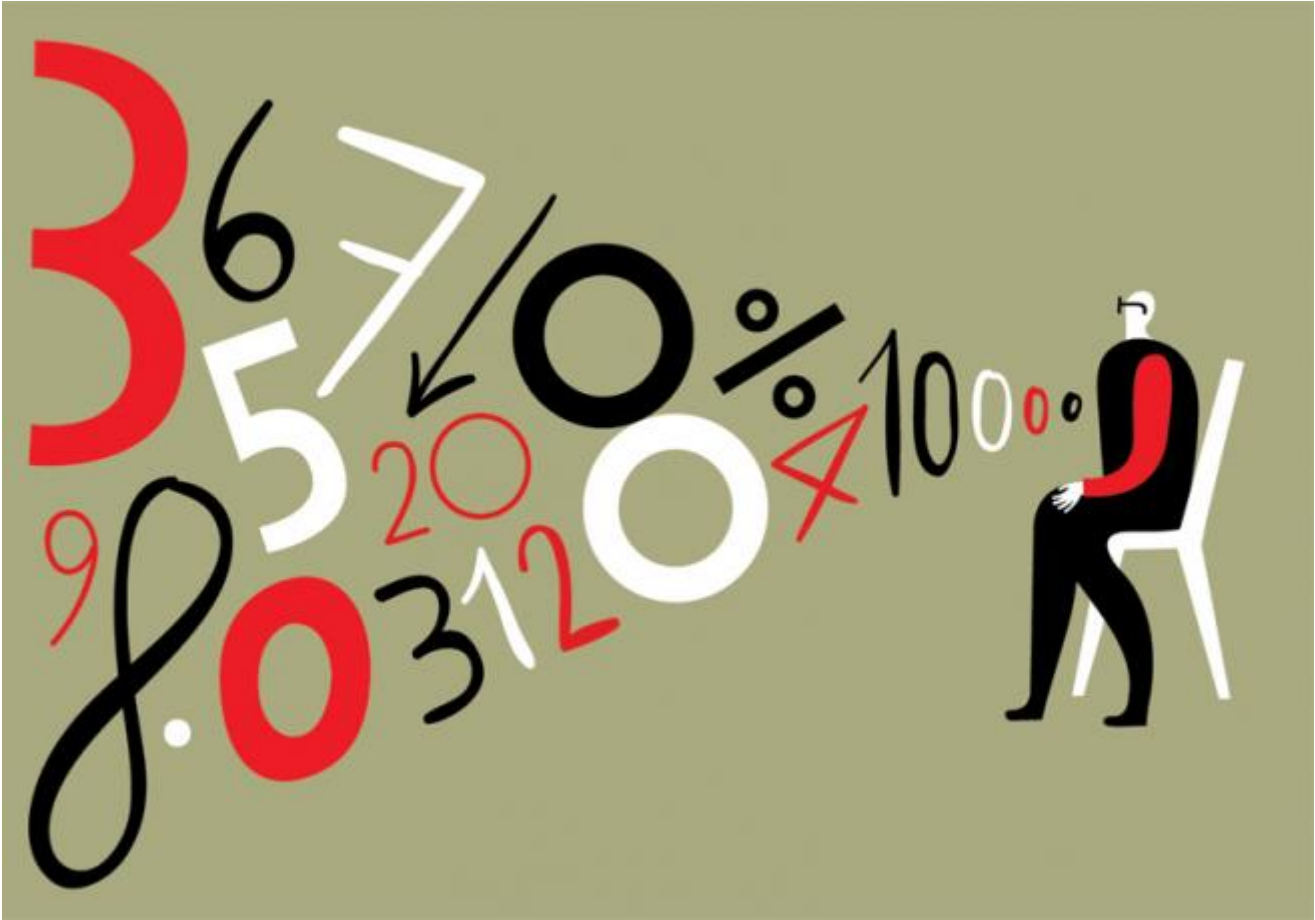
Illustrazione per The Harvard Business Review

Ci si può divertire anche con la scrittura, dunque? “Certo, la scrittura a mano in qualche modo è una forma di illustrazione”.