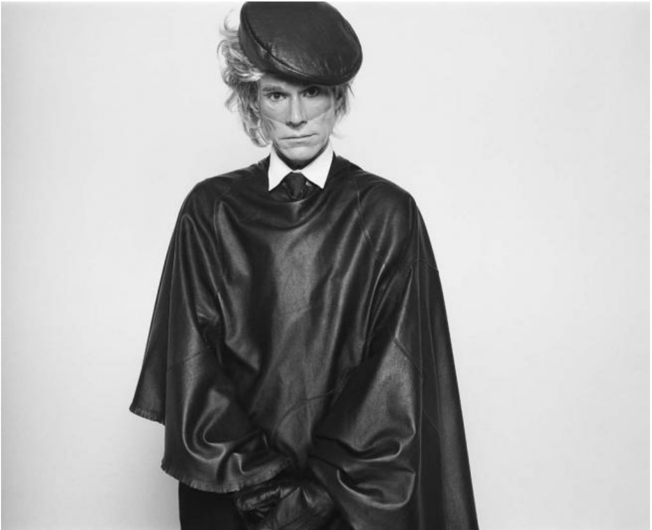
Andy Warhol.

Lei insiste spesso sul suo orrore per i resti. Dice che alla sua morte le piacerebbe sparire senza lasciare traccia.