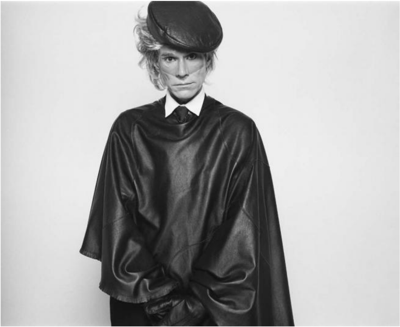
Andy Warhol.

Lei insiste spesso sul suo orrore per i resti. Dice che alla sua morte le piacerebbe sparire senza lasciare traccia.