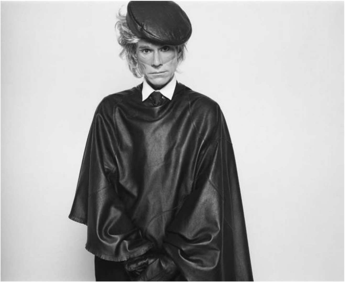
Andy Warhol.

Lei insiste spesso sul suo orrore per i resti. Dice che alla sua morte le piacerebbe sparire senza lasciare traccia.