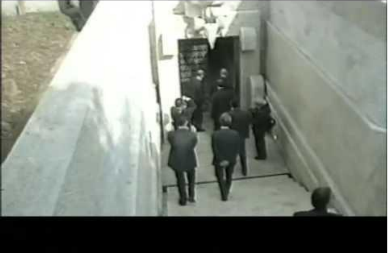
Berlusconi mostra a Mihail Gorbačëv il suo mausoleo

Con ogni probabilità è, appunto, solo una leggenda, una fantasia; tuttavia il suo contenuto inconscio coglie nel segno riguardo un aspetto della personalità del tycoon televisivo. Berlusconi non sembra volersi rassegnare a un declino politico che è un dato inevitabile della stessa esistenza dei leader nel corso della storia repubblicana - De Gasperi, uno dei padri fondatori della nostra Repubblica, è durato in carica dal 1948 al 1953: solo cinque anni. Questo è un elemento caratteriale, psicologico, che trova tuttavia nell'ossessione per il proprio corpo la sua più profonda spiegazione. La scorsa estate un articolo comparso su Oggi descriveva nel dettaglio in cosa consistesse il trucco assai complesso cui ricorre Silvio Berlusconi per nascondere il degrado fisico del suo viso, della pelle e dei capelli. Un'attività di maquillage che ricorda le assai lunghe sedute cui si sottopongono le attrici di Hollywood, e i divi in genere. Non era solo una notizia gossip, degna dei pettegolezzi estivi. Nel trattamento estetico si evidenziava non solo la volontà di Berlusconi di nascondere la sua età, ma anche il complesso di Sansone di cui soffre. I capelli sono collegati alla potenza virile, alla forza fisica, e la capigliatura, segno di un appeal che per il tycoon televisivo risulta molto