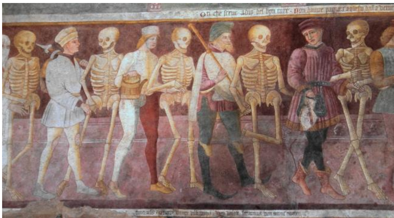
Borlone de Buschis di Clusone

Una gita a Clusone e una a Pinzolo non guastano. La danza macabra di Borlone de Buschis di Clusone (1485) e quella di Simone Baschenis di Pinzolo (1539) segnano forse l'inizio e la fine di un periodo di comunità inconfessabile (Blanchot, 1983). Inconfessabile perché composta di trapassati, che, in quanto tali, già sono passati in giudicato, ingiudicabili. In molti accomunano questa comunità a un'altra, che potrebbe essere anche la medesima, chissà. Si tratta della Stultifera Navis . Cos'hanno in comune gli stolti e i morti? Il semplice fatto di non essere confessabili. Gli uni per il regno dei cieli, gli altri per la terra, sono inguaribili. Bosch e le illustrazioni a Brant di Dürer ne danno rappresentazione figurativa. Ecco una figura chiave, il centro del primo capitolo, della prima parte della Storia della follia di Foucault: Sebastian Brant (1458-1521). Vissuto tra l'opera del de Buschis e quella del Baschenis. Nel giugno 1984 Francesco Saba Sardi (1922-2012) ci regalò, in versi endecasillabi, la traduzione di Das Narrenschiff .