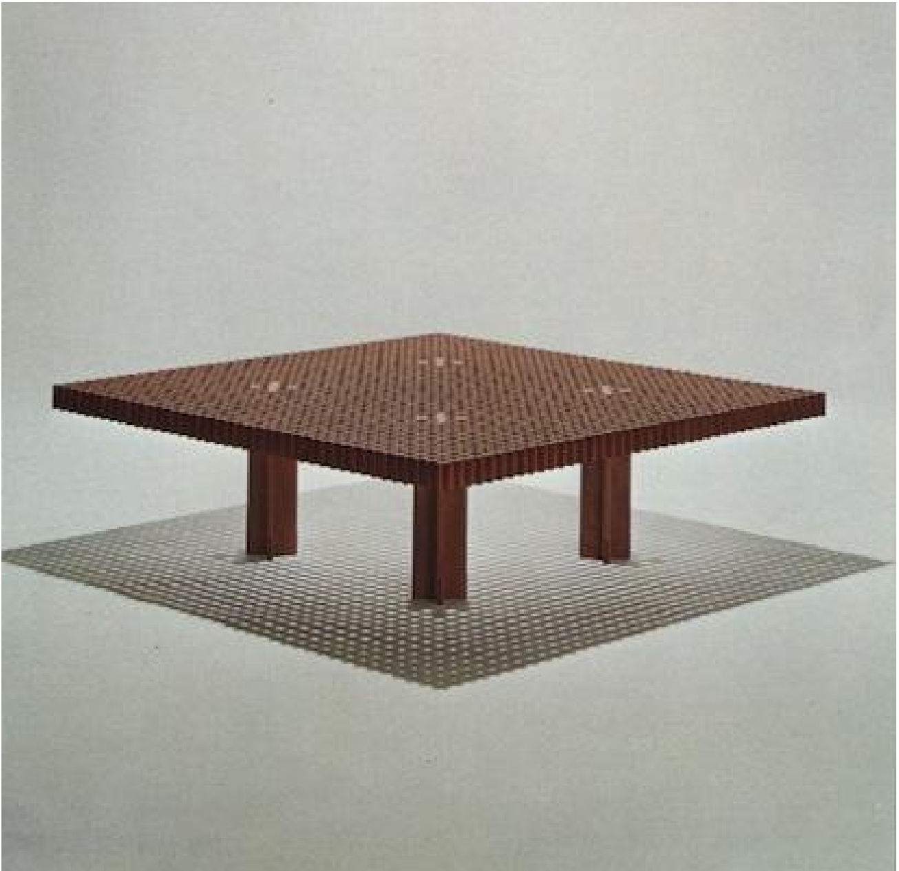
Kyoto, G. Frattini.

Allora l'incontro con la bottega Ghianda, insieme agli appigli degli altri fermenti che affiorano nel paesaggio della crisi, ci sarà utile per immaginare davvero quella figura di nuovo artigiano a cui si attribuiscono forse troppe speranze, ma che ci sfuggirà sempre se la pensiamo dal fondo di una contraddizione irrisolta, invece di viverla dall'interno, come una apertura di possibilità attive per il fare-pensare presenti.