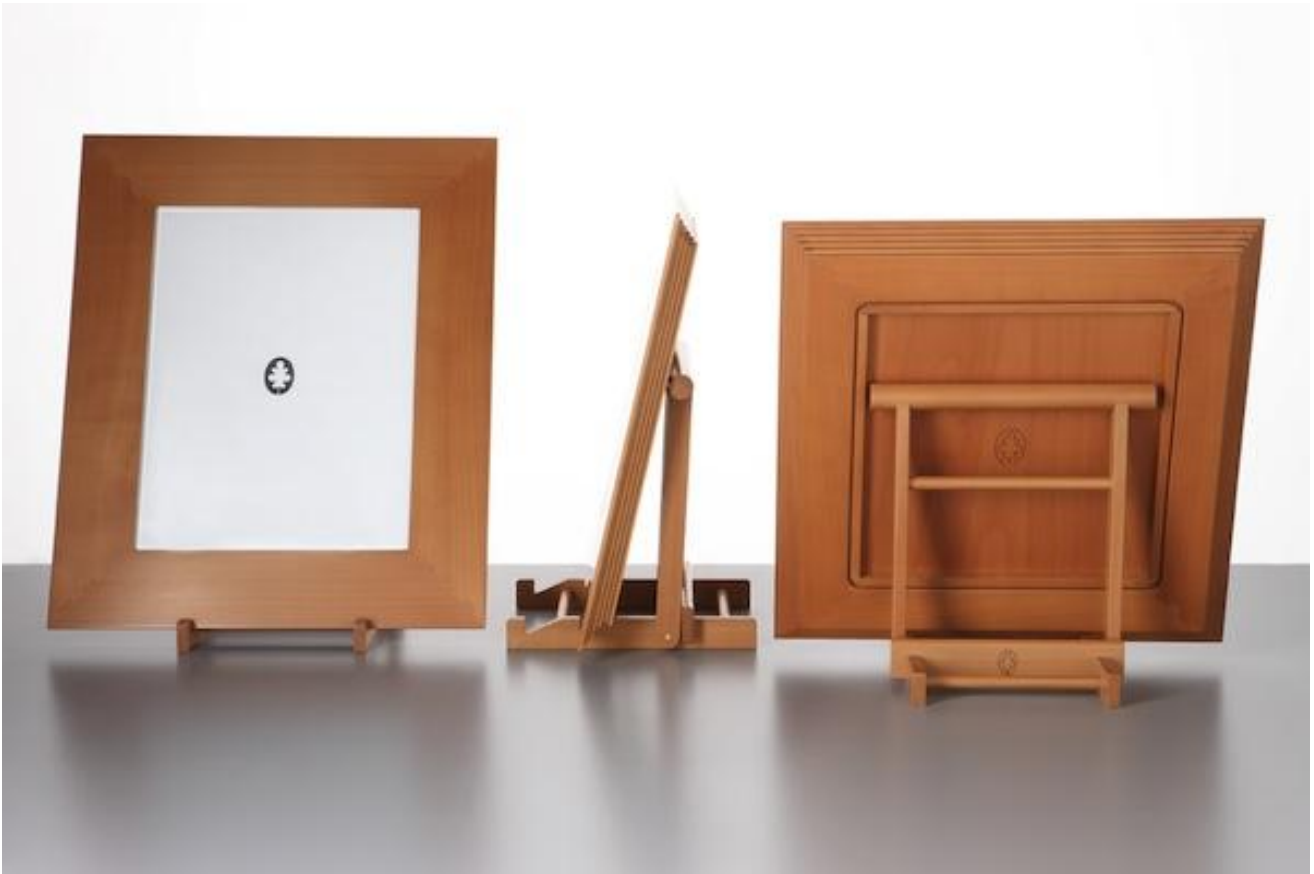
Cornici Gae Aulenti

Gli oggetti della bottega di Ghianda stanno insieme per la precisione delle svasature, prendono spazio e forma allineando le bacchette in geometrie esatte e leggere, come nelle librerie voliere su progetto di Bellini: non è questo il luogo dove si affermi l'imponenza delle masse legnose, né il laboratorio dove sperimentare la flessuosità dei pannelli del compensato curvato, perché qui si ricorre al massello polito negli spessori minimi delle tavole e nelle trasparenze di un disegno lineare; qui vale la congiunzione in giusta sede, come nella serie di lettere AMORE che si scavano e stringono in una parola-cubo.