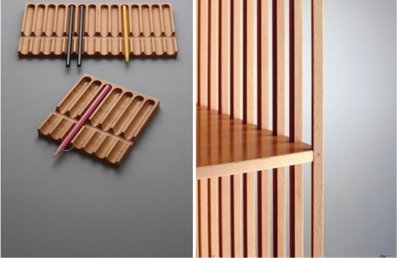
Portamatite / ètagère M. Bellini.

Questo dovevano saperlo i tanti designer che hanno cercato da Ghianda il sapere della bottega artigiana, e vi hanno trovato il luogo in cui si esercita non la separazione dei compiti, ma la curiosità congiunta, la disposizione a imparare sempre dentro un lavoro comune.