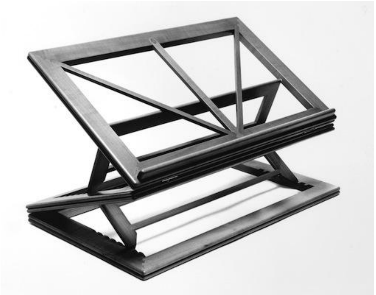
Leggio Gae Aulenti

Fatte di legni più o meno rari, sono cose preziose in virtù di un lavoro pensato e di una cura operosa, prima che per l'economica scaltrezza: esse affermano la qualità di un fare-pensare, che troppo spesso si destina al lusso, ma che ci appartiene e si rivendica come necessità etica, non come esibizione di possesso. Per questo, più che la seduzione da intenditore, più che il richiamo alla degustazione della rarità o della preziosità del legno antico e lungamente cercato, negli oggetti di Ghianda è la passione per il lavoro che risuona e chiede un ascolto rinnovato, utile ora.