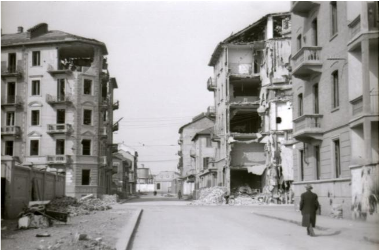
Via Vinadio a Torino, dopo un bombardamento, nel 1944. Sullo sfondo si vede il muro della Diatto, in quegli anni ormai SNIA Viscosa, e al di sopra del muro sventa, integra, la cisterna sulla quale è in corso la battaglia per evitare la demolizione della fabbrica da parte di Sniarischiosa un comitato di cittadini congiunto al coordinamento di Associazioni ambientaliste Italia Nostra, Legambiente Ecopolis e Pro Natura Torino.

Questi nuovi inserti urbani ci raccontano storie che ogni grande città come la nostra conosce molto bene, ci raccontano le storie di tanti quartieri in cui tutti noi abbiamo abitato, ci raccontano dell'incapacità della nostra società di produrre ambienti organici a se stessa in continuità con i valori della tradizione e della storia. Il risultato è un ambiente ancora inespessivo, contraddistinto da una certa genericità dei segni, privo di quei connotati di seduzione e di fascino che sappiamo riconoscere e apprezzare nei quartieri storici.