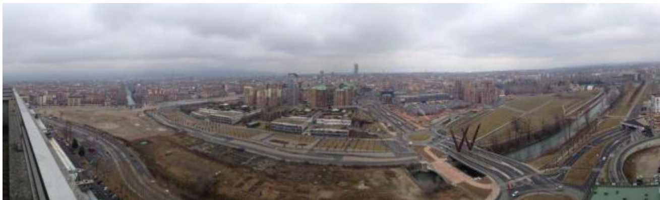
Il Parco Dora nel nuovo quartiere di Spina 3, Torino.

Se il primato dell'Architettura è la complessità del suo linguaggio, saper ascoltare ed entrare in dialogo con i contesti, interpretare nel profondo la natura dei luoghi, rendere espressivi e confortevoli gli spazi, nei suoi pieni e soprattutto nei vuoti, stiamo vivendo un'epoca infelice dove la pratica del costruire e disegnare gli spazi sembra aver smarrito il rapporto con l'elaborazione dei significati. I tratti di forza del linguaggio universale dell'Architettura, in continuità dialogica con il passato, nella totale assenza di argomenti maturi di dibattito e delle sue regole di gioco fatte anche di ironia e contraddizioni, sono impoveriti a tal punto da sembrare svaniti, perduti in una frantumazione di idiomi a volte non traducibili. Ovvio risultato di un simile scenario, il progressivo affermarsi di un grave equivoco di fondo, al dibattito sui significati, dei valori sociali della disciplina, della responsabilità del ruolo dell'architetto, si è sostituita la logica di un mercato dell'apparenza, dove a vincere è sempre più spesso la matrice genetica di individualismi, ardite e incomprensibili geometrie plastiche, che in nome del bisogno di colmare i vuoti di un abisso dialettico hanno gradualmente sostituito la significazione del disegno , rifugiando il progetto nelle complicazioni aberranti della modellazione 3D, tristezza.