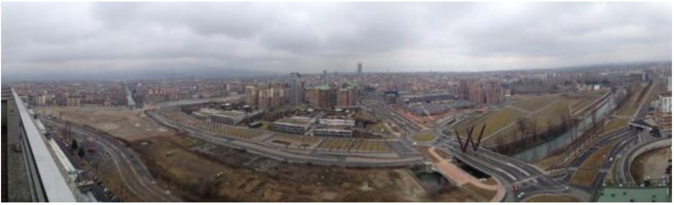
Il Parco Dora nel nuovo quartiere di Spina 3, Torino.