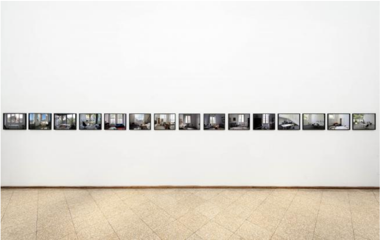
Vedute, 2012, GNAM

Al mezzo video, che come hai detto è la cifra stilistica che ti accompagna sin dagli esordi, hai poi aggiunto altre espressioni formalmente distinte, nelle quali fai confluire la tua ricerca: la fotografia, il libro d'artista e l'uso del neon come scrittura.