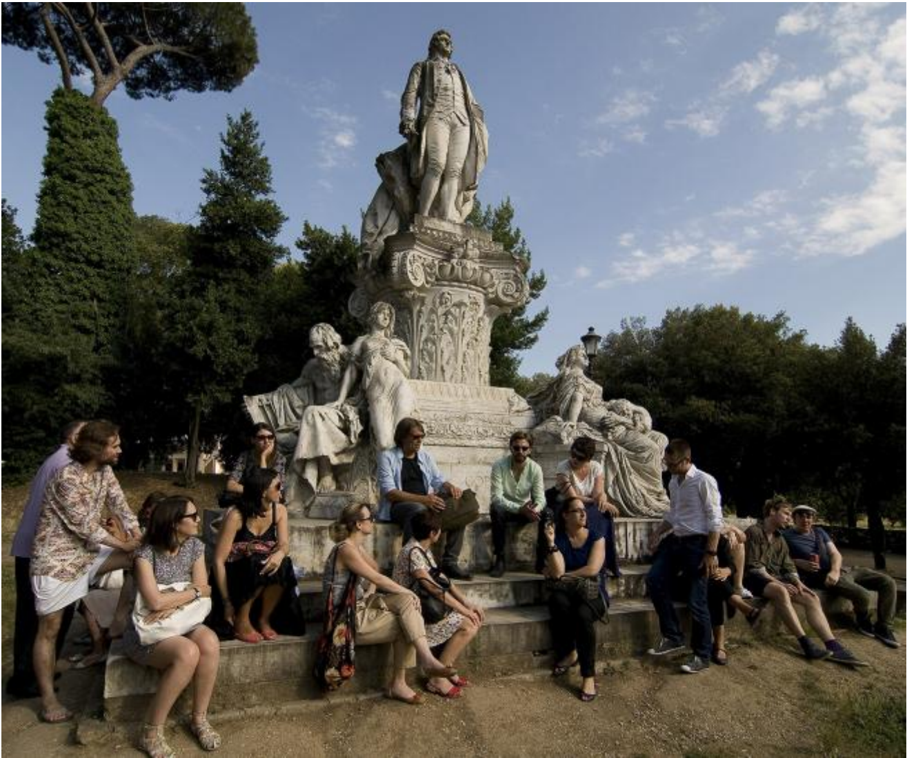
Promenades, 2012