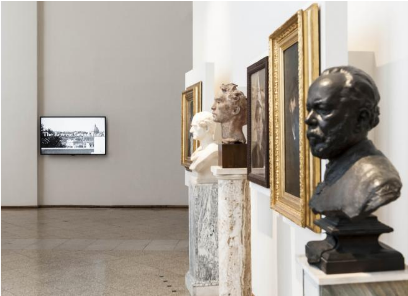
The Reverse Grand Tour, 2012, GNAM, ph. Sebastiano Luciano

Sembra esserci una soglia molto sottile tra il sistema teatrale, la narrazione e la messa in scena di certe confidenze, ma come avviene il passaggio dalla dimensione individuale a quella comunitaria?