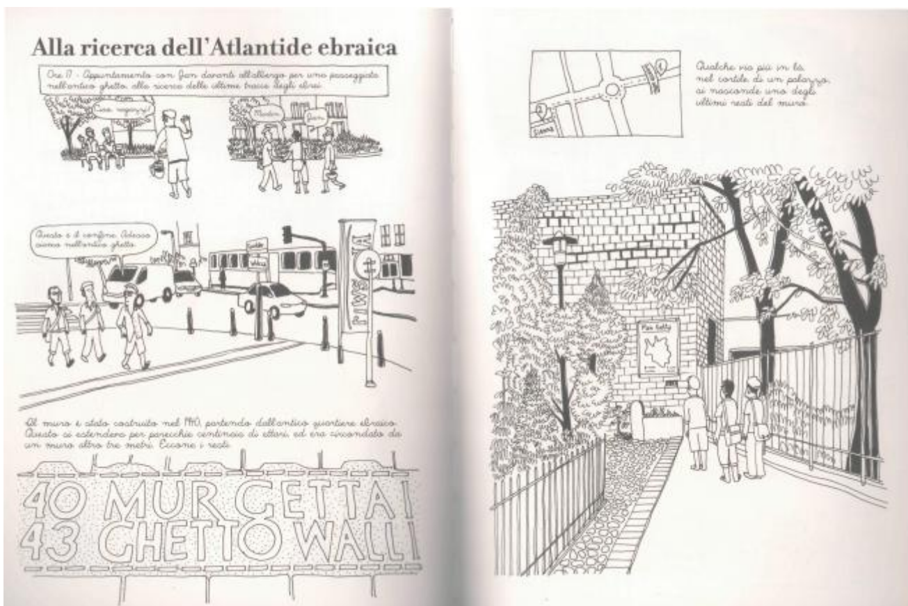
Copyright Jérémie Dres e per l'edizione italiana Coconino Press-Fandango 2012

Prima della seconda guerra mondiale a Varsavia vivevano 375000 ebrei principalmente concentrati nella zona nord della città: si trattava della più grande comunità ebraica europea e della seconda del mondo dopo New York (ma in verità, se chiedete alla guida della sinagoga Nozyk, vi dirà “che era più grande e importante anche di quella di New York”).