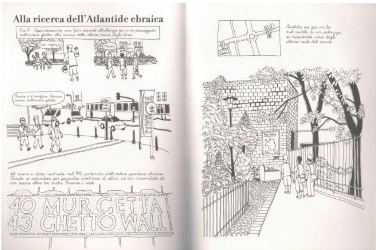
Copyright Jérémie Dres e per l'edizione italiana Coconino Press-Fandango 2012

Prima della seconda guerra mondiale a Varsavia vivevano 375000 ebrei principalmente concentrati nella zona nord della città: si trattava della più grande comunità ebraica europea e della seconda del mondo dopo New York (ma in verità, se chiedete alla guida della sinagoga Nozyk, vi dirà “che era più grande e importante anche di quella di New York”).