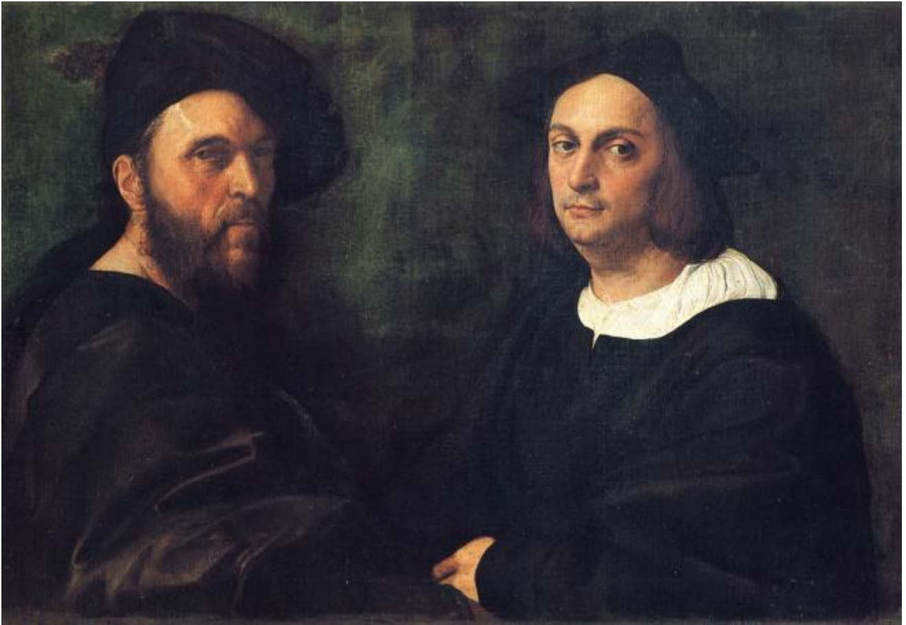
Raffaello, Ritratto di Navagero e Beazzano, Roma, Galleria Doria

assieme a Raffaello e Castiglione durante una gita a Tivoli nel 1516. Quelle antichità che ispirano alcuni splendidi disegni di progetti grandiosi e mai finiti.