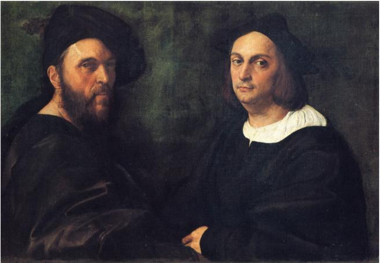
Raffaello, Ritratto di Navagero e Beazzano, Roma, Galleria Doria

Come gli artisti visivi imitano le antichità Bembo teorizza l'imitazione di Cicerone e Petrarca, ma il suo fine è normativo non sperimentale. La tesi della mostra è che Bembo risponde alla crisi politica italiana codificando il rinascimento, e che il suo percorso è uno dei miti fondatori dell'identità italiana e delle possibili risposte alle ricorrenti e terribili crisi che la travolgono. I curatori hanno raccolto una sfida divulgativa ambiziosissima: raccontare come prendono forma le idee senza inciampare nella filologia o nella specialistica. A giudicare dagli sguardi incantati e assorti dei visitatori è una sfida vinta. Ed è sempre un piacere scoprire che la complessità non spaventa nessuno.