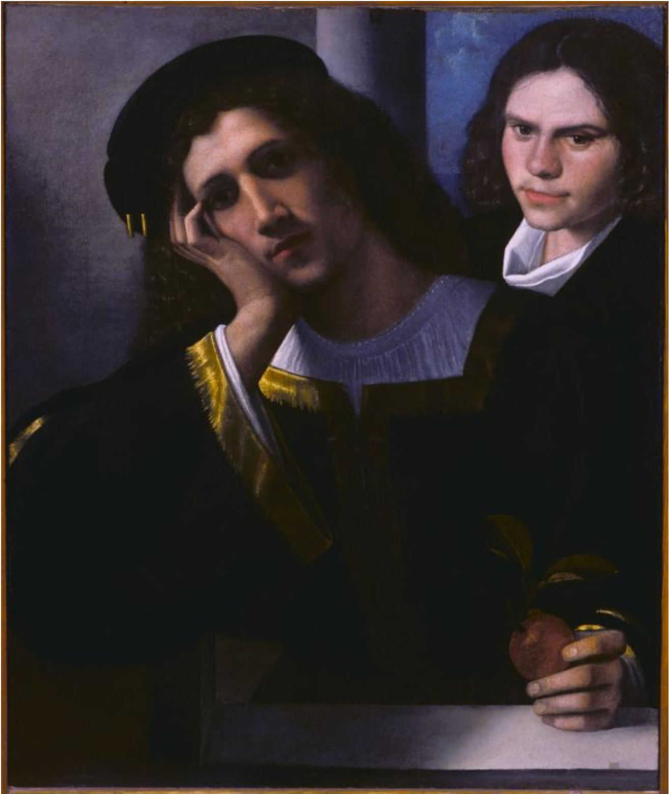
Giorgione, Doppio Ritratto, Roma, Palazzo Venezia

caratteri romani in uso ancora oggi. Alziamo gli occhi dall'incunabolo e ci troviamo di fronte il Ritratto di giovane con libro verde di Giorgione. Anche lui ha appena alzato gli occhi dal suo libro, un oggettino che si tiene con una mano sola, mentre l'altra indossa un guanto che lascia i polpastrelli nudi, per sfogliare meglio le pagine; è il lettore moderno, in una delle sue prime apparizioni. Nei primi anni del cinquecento Bembo e Giorgione danno forma a una nuova soggettività maschile, Bembo con gli Asolani , i dialoghi in volgare sull'amore pubblicati nel 1505, e Giorgione con opere come il Doppio ritratto, che accosta un giovane malinconico e uno acceso e diretto, come i due protagonisti degli Asolani .