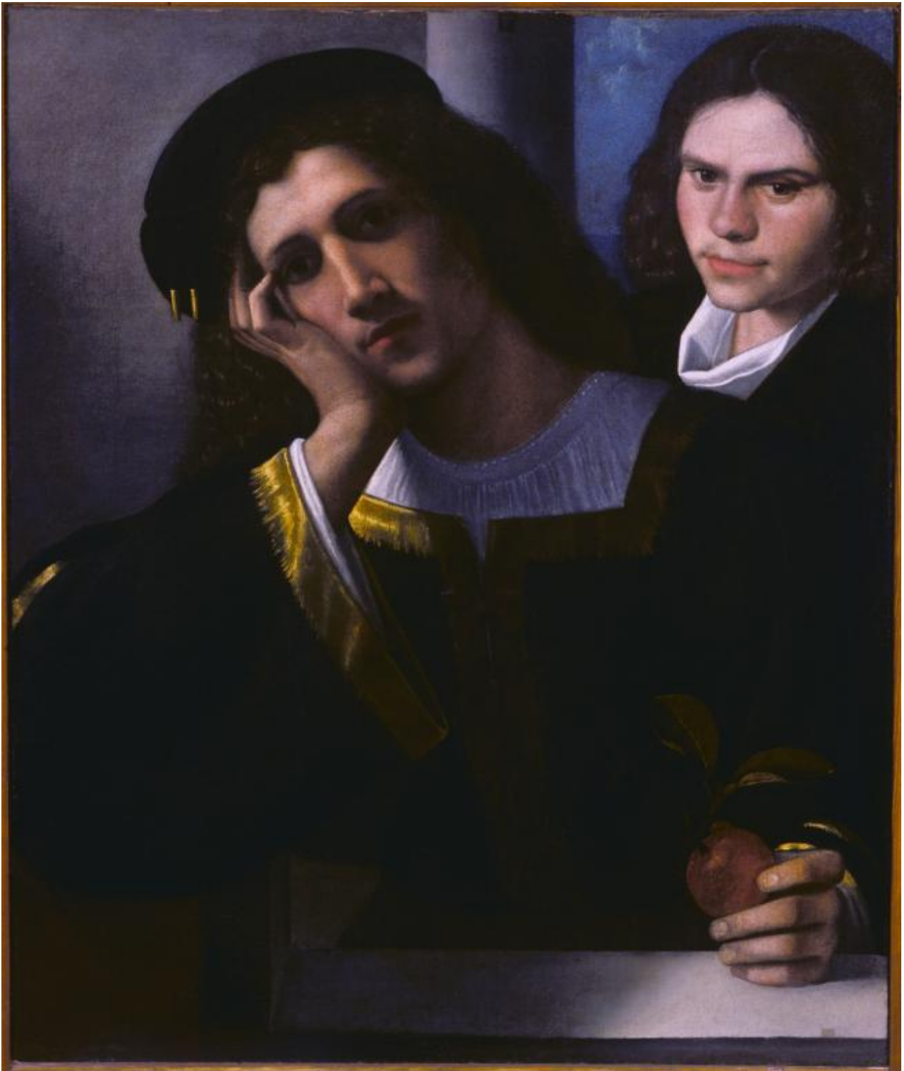
Giorgione, Doppio Ritratto, Roma, Palazzo Venezia

Il successo degli Asolani segna per Pietro l'abbandono di ogni velleità politica, che d'altronde non avrebbe alcun senso in un'Italia invasa, divisa e ininfluyente. Sceglie l'unico modo di contare qualcosa per un italiano del Cinquecento: la strada del "gusto". A Urbino è tra i protagonisti del Cortegiano di Baldassarre