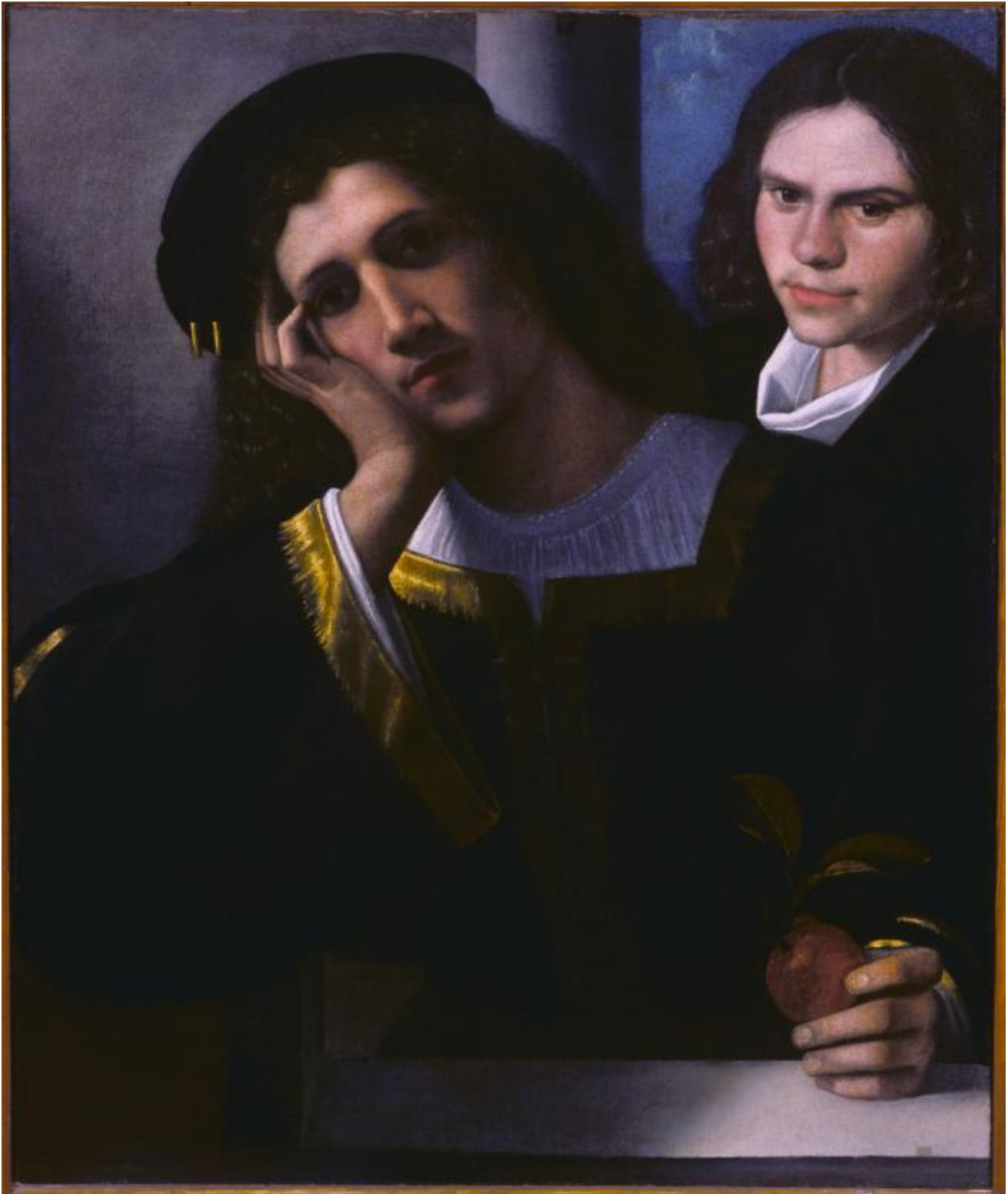
Giorgione, Doppio Ritratto, Roma, Palazzo Venezia

caratteri romani in uso ancora oggi. Alziamo gli occhi dall'incunabolo e ci troviamo di fronte il Ritratto di giovane con libro verde di Giorgione. Anche lui ha appena alzato gli occhi dal suo libro, un oggettino che si tiene con una mano sola, mentre l'altra indossa un guanto che lascia i polpastrelli nudi, per sfogliare meglio le pagine; è il lettore moderno, in una delle sue prime apparizioni. Nei primi anni del cinquecento Bembo e Giorgione danno forma a una nuova soggettività maschile, Bembo con gli Asolani , i dialoghi in volgare sull'amore pubblicati nel 1505, e Giorgione con opere come il Doppio ritratto, che accosta un giovane malinconico e uno acceso e diretto, come i due protagonisti degli Asolani .