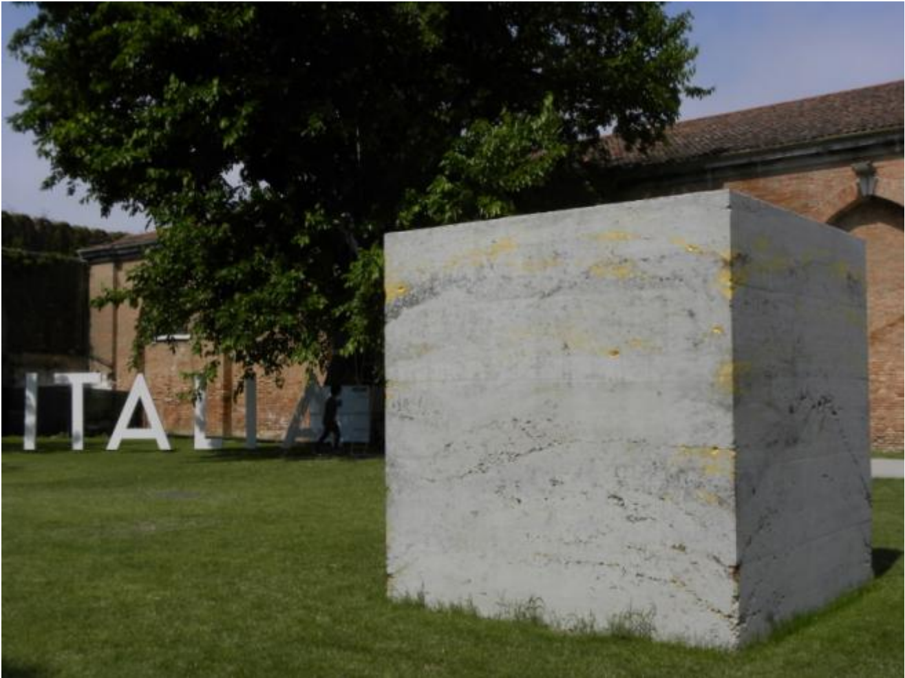
Piero Golia, foto Laura Einaudi

sovertito dalle cinque opere di Giuseppe Chiari che Bartolini ha incluso nell'installazione. Cinque scritte che ci esortano a Camminare , Ascoltare , Cantarellare , Fantasticare , e anche a Pianoter , azione che possiamo inventare a piacere.