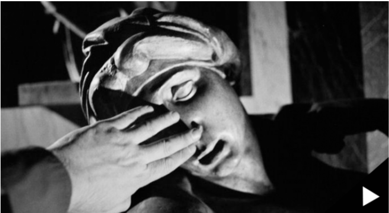
A Close Up View, UCRCalifornia Museum of Photography © Evgen Bavcar

Il mondo visuale, quello interno, dei soggetti patologici non solo non viene intaccato, ma spesso viene coltivato con passione, crescendo senza limitazioni e, nonostante le enormi difficoltà espressive dei soggetti afasici o anomici, esso sembra essere inversamente proporzionale alle privazioni dovute alle disfunzioni che li affliggono. Ma, a partire da un'altra esperienza personale, quella di un tumore oculare e della successiva perdita parziale della vista, l'autore avvicina il mondo delle malattie neuronali a quello delle patologie della vista, compiendo un accostamento che si incastra perfettamente e che insiste sull'ampio plesso estetico della percezione. L'occhio interiore, cioè l'occhio della mente, viene nutrito anche in mancanza di uno stimolo esteriore ed è grazie a ciò se non possiamo contrapporre cecità e percezione. Tranne in un unico, eccezionale caso. Quello di John Hull, professore di scienze religiose in Inghilterra, colpito da problemi visivi fin da bambino, fino a divenire totalmente cieco a partire dai quarantotto anni. Hull precipita in una condizione che lui stesso definisce "cecità totale" ma, con il passare del tempo, egli assume fino in fondo la propria situazione, concependo la cecità non come una mancanza, ma come un nuovo ordine, una nuova modalità dell'umano che gli permette di entrare in una stretta intimità con la natura. La vista diventa così una parola progressivamente spogliata di senso, fino a diventarne totalmente priva.