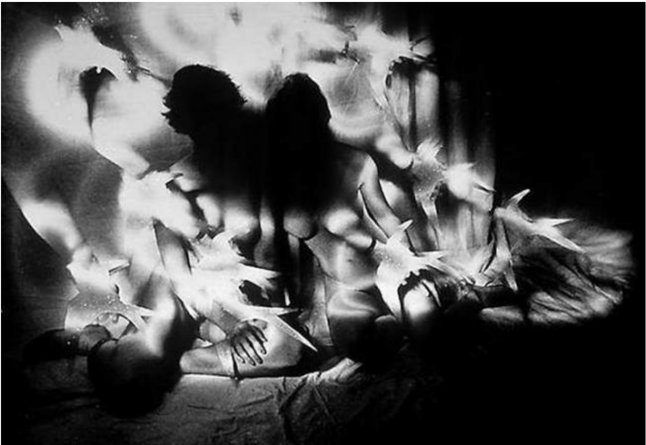
Deux nus aux hirondelles © Evgen Bavcar

E proprio dal linguaggio, ma sarebbe meglio dire, dal momento in cui il linguaggio subisce un arresto, una rottura, prende avvio il testo di Sacks. L'emergenza dell'alessia, una patologia che impedisce la comprensione del linguaggio scritto, può essere declinata nel campo della musica e dare luogo all'insorgenza dell'alessia musicale. Il soggetto affetto da tale patologia, nonostante abbia passato tutta la propria esistenza interpretando la musica scritta sugli spartiti, diviene incapace di leggere quella musica, limitandosi a riconoscere solamente segni indipendenti che non godono di alcuna intelligibilità come insieme. La singola nota non perde il suo valore e la sua connotazione, ma essa non ha più nulla a che fare con le sue vicine. La musica lascia il campo della lettura per riacquistare, in modo drammatico, quella dell'ascolto, della creazione manuale e del sentimento. Lo spartito si defila e la struttura del pezzo musicale si tiene su proprie strutture, in un movimento di ritorno alla materialità uditiva.