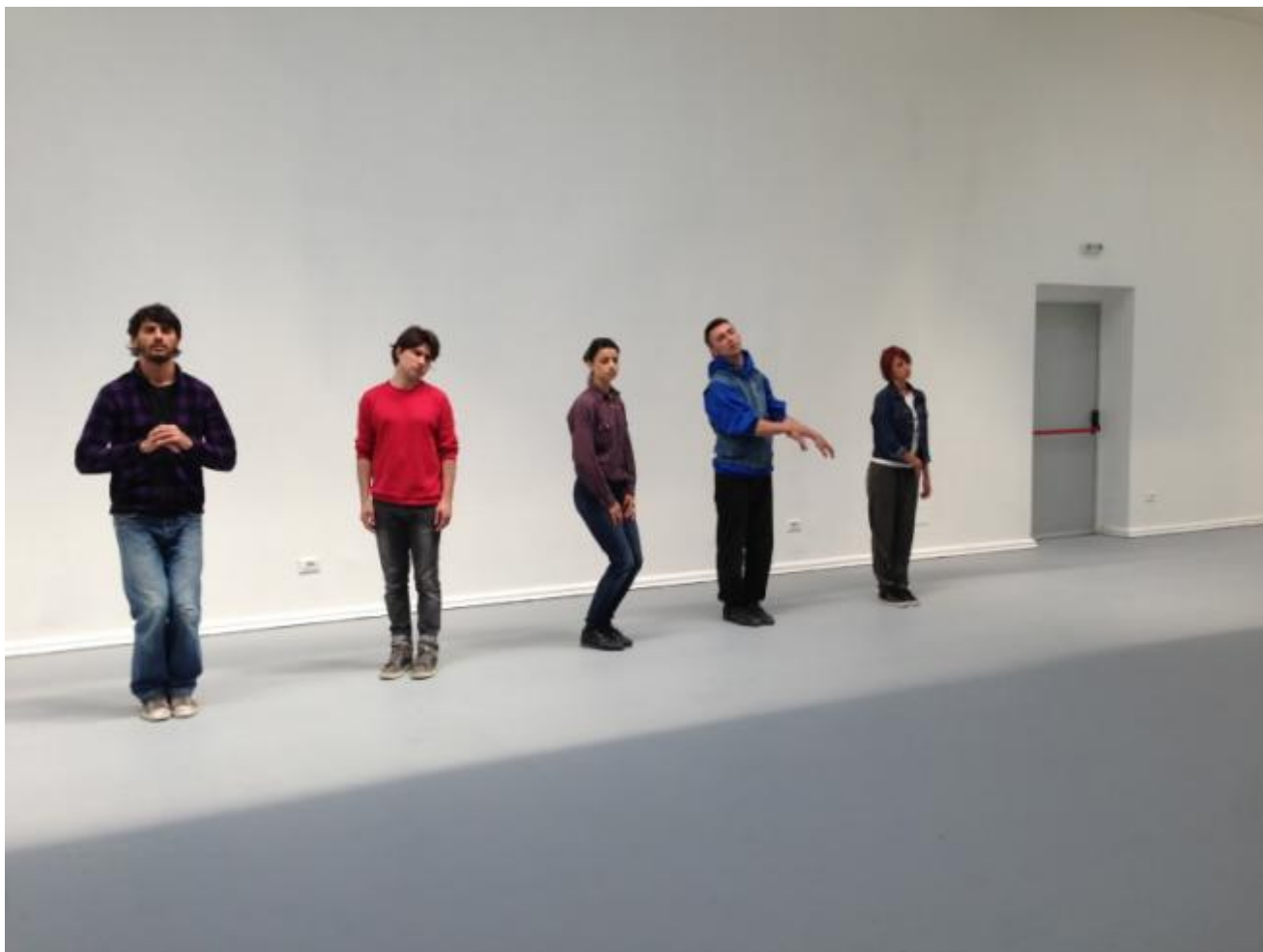
Padiglione della Romania