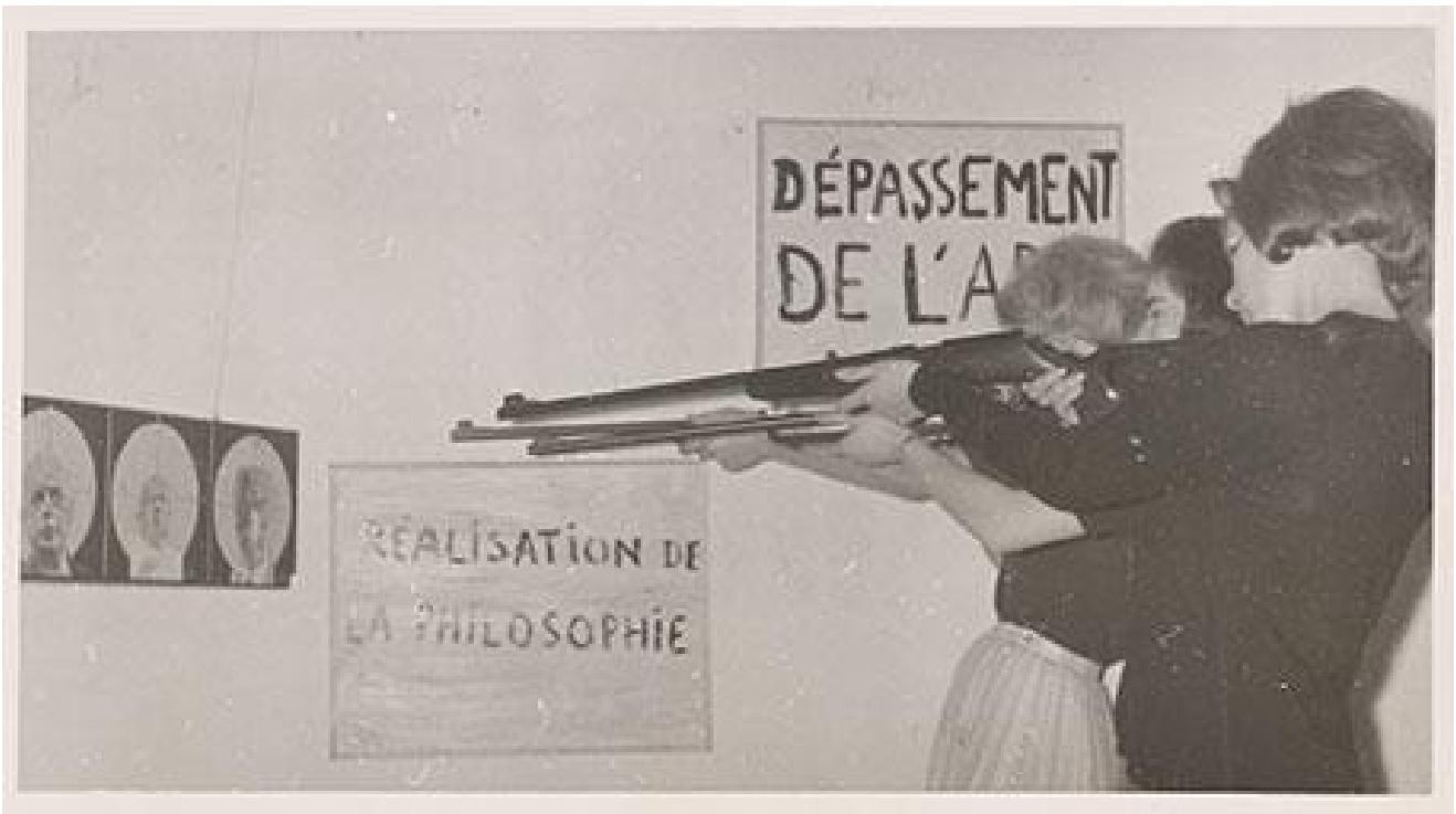
Destruktion RSG-6, Galerie EXI, Odense, giugno 1963

Questo visual turn sembra contraddire le intenzioni di Debord che, dopo la conferenza di Göteborg dell'agosto 1961, sente la necessità di ricalibrare gli obiettivi del movimento su un piano più politico - un putsch nella cultura. Lo spettacolo del rifiuto deve ora lasciar spazio a un più radicale rifiuto dello spettacolo. Guai a trasformare la distruzione dello spettacolo in un'opera d'arte.