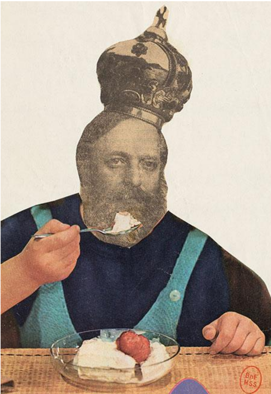
Debord collage in onore di Asger Jorn, 1962

ed energie. Questa sala, da cui irradiano le singole sezioni di Un art de la guerre , ne è la macchina motrice, quasi un viaggio all'interno del cervello dello stesso Debord, che Philippe Sollers ha designato come "una biblioteca ambulante".