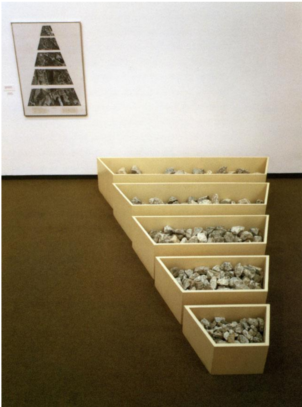
Robert Smithson, A Non-site: Franklin, New Jersey , 1968

esposte le reliquie della Crocifissione e sotto il pavimento era stata sparsa, secondo la tradizione, la terra del Calvario, si proponeva al fedele un vero e proprio pellegrinaggio, virtuale ma spiritualmente equivalente, in Terrasanta.