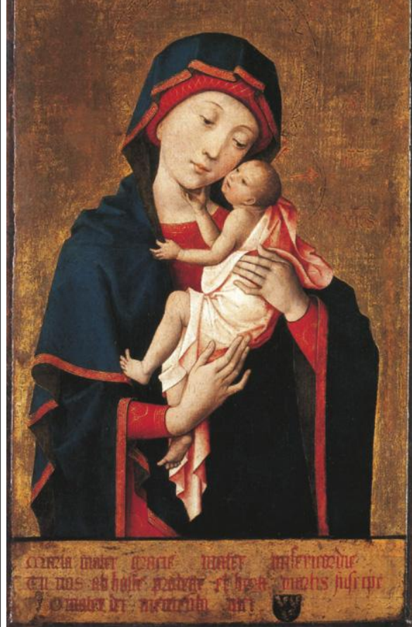
Madonna di Cambrai , 1340 ca. - Hayne de Bruxelles, Madonna con Bambino , 1455 ca.

Ciò che viene scossa in Anachronic Renaissance , attraverso questo e molti altri esempi, è in altre parole la fiducia riposta dagli storici dell'arte nella «distanza cognitiva», in senso razionalista e protoilluminista, tradizionalmente attribuita alla cultura rinascimentale nei confronti del del suo passato «medioevale». Ciò che si presenta oggi a uno sguardo che ha ormai abbandonato il modello storicista è al contrario una tessitura fluida, in cui due modi antinomici di concepire l'origine di un'immagine – per sostituzione o per intervento di un autore identificato – convivono e interferiscono tra loro all'interno dello stesso spazio storico. L'opera d'arte rinascimentale, sostengono Nagel e Wood, non nasce in definitiva dal superamento «inevitabile» di una modalità precedente, quanto piuttosto dalla dialettica tra due modalità che genereranno presto a loro volta una intera gamma di nuove problematiche – dal falso all'imitazione dello stile classico, dall'arcaismo alla citazione ecc. – di importanza determinante per la pratica artistica moderna nel suo complesso.