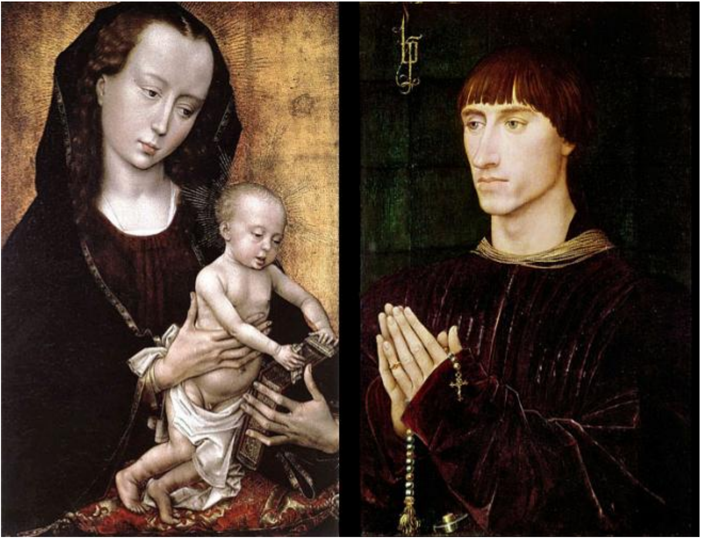
Rogier van der Weyden, Madonna con Bambino e Ritratto di Philippe de Croÿ , 1460 ca.