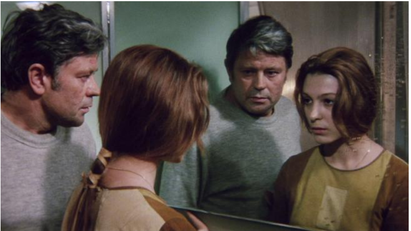
Andrei Tarkovskij, Solaris , 1972

Nella stessa modalità traumatica – l’impensabile ripetizione di un’assenza –, lo psicologo-cosmonauta Kris Kelvin reincontra in Solaris , il film del 1972 che Andrei Tarkovskij trasse dal romanzo omonimo di Stanisław Lem (1961; prima traduzione italiana integrale Sellerio 2013), la sua donna amata e perduta, Hari. Copia meccanica proiettata dalla potenza del pianeta pensante, la nuova Hari è la manifestazione vivente e paradossale di una perdita, un impossibile realizzato: un essere in cui confla dolorosamente lo splendore della bellezza e il vuoto più mostruoso, la prossimità e l’essere-morto, il desiderio vivente e l’ingannevole fissità del ricordo. La sua presenza mina la consistenza del presente esponendolo alla reversibilità del passato e fa di quest’ultimo uno spazio malinconico, una prigione che divora il futuro, una allegoria irresistibile e mostruosa della voracità della morte.