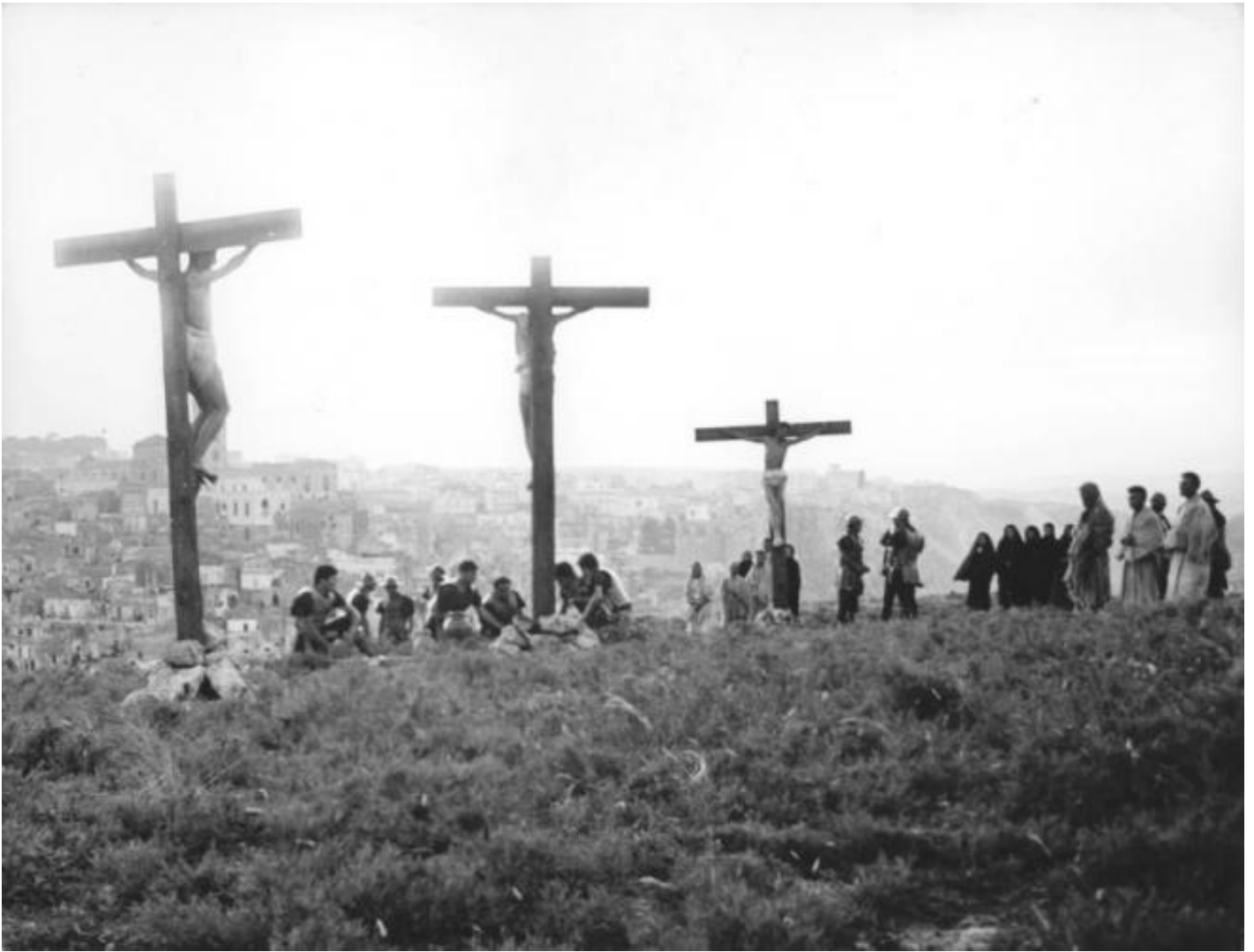
Pier Paolo Pasolini, Il Vangelo secondo Matteo , 1964