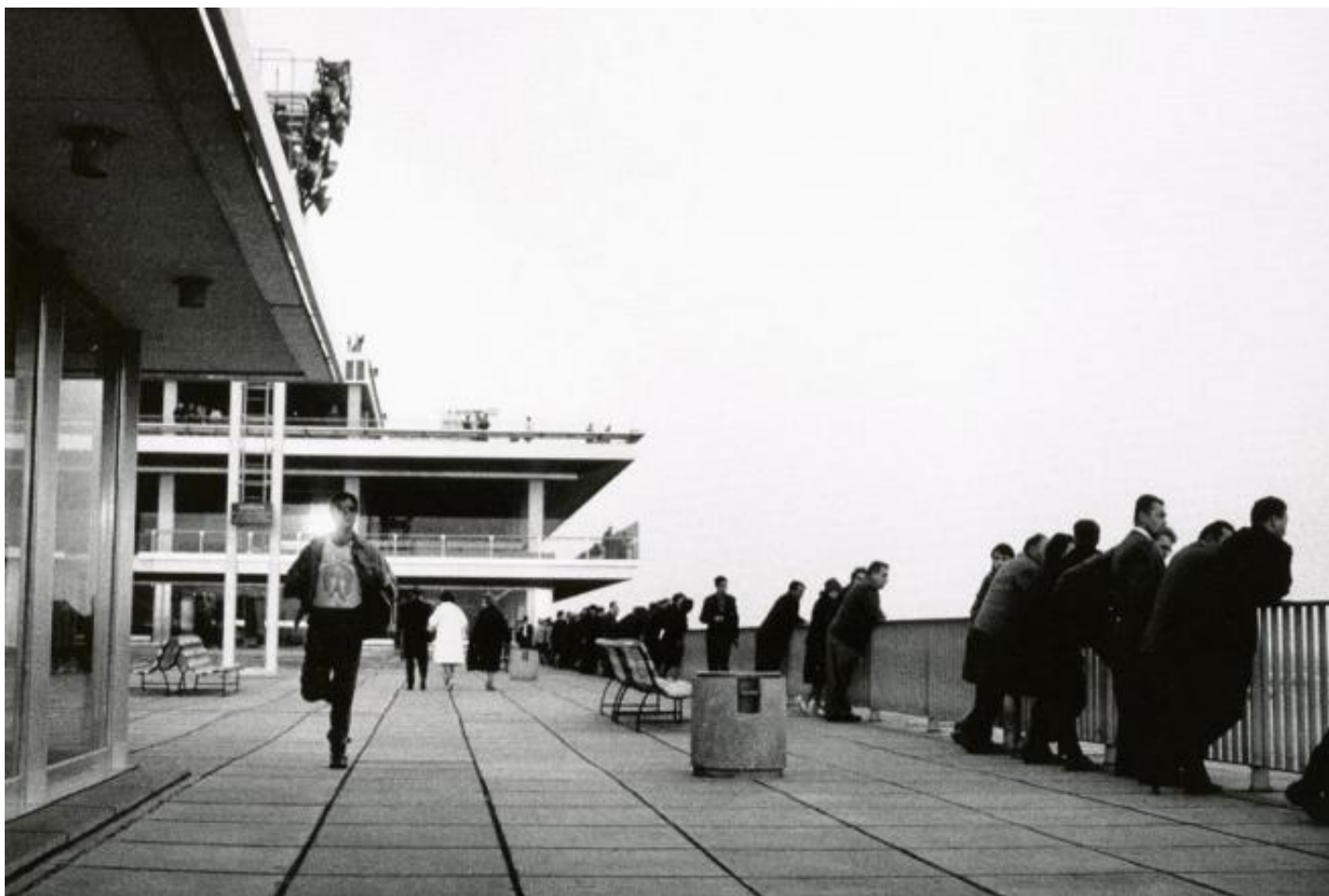
Chris Marker, La Jetée , 1962

Un uomo corre sulla terrazza dell'aeroporto di Orly; è colpito da uno sparo, si torce in uno spasmo violento, muore sotto gli occhi di un bambino. È il celebre inizio de La Jetée , il ciné-roman del 1962 di Chris Marker, composto di fotogrammi fissi su cui una voce traccia l'arco della narrazione. Ciò a cui assistiamo è un cortocircuito temporale: il bambino e l'uomo ucciso, tornato da un distante futuro per compiere il suo destino, sono lo stesso individuo. Nell'istante in cui il presente folgora l'immagine esso è già passato, è già ricordo, simultaneamente prologo ed epilogo della storia. L'uomo e il bambino sono sospesi in un paradosso tragico che stringe e proietta la sua ombra luttuosa su un'intera esistenza, futura e già trascorsa. Il passato non torna per redimere il presente, né per fornirgli un senso – sembra dire Marker – ma per obbligarlo a iniziare da capo, per impedire un'alternativa: quella immagine, quel trauma, all'infinito.