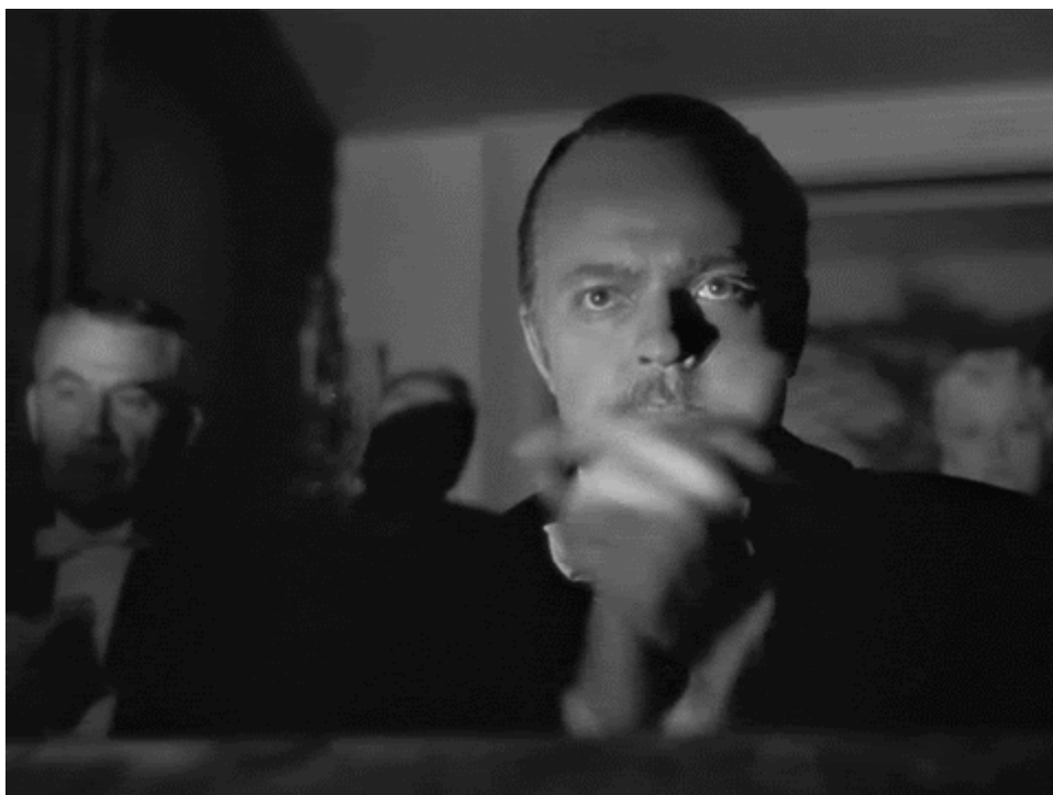
Quarto potere (Orson Welles, 1941)

Lasciandole scorrere una dopo l'altra sulla bacheca di Tumblr oppure tutte incastonate nella griglia di una pagina d'archivio, osservo quello strano formicolio: scatti convulsi, piccoli tic, un intero atlante di gesti interrotti e ripetuti. La sensazione è di fascino e repulsione: difficile descriverla, ma mi viene da paragonarla al ribrezzo che mi coglieva da bambino quando trovavo in un libro la fotografia di un insetto e stavo ben attento a non sfiorarla nemmeno con un dito. È nel loro essere cose, dotate di una vita per me inconcepibile, che le GIF mi provocano questi rigurgiti di animismo infantile. Immerse nelle loro routine, sembrano intoccabili, come sonnambuli che non possono essere svegliati; eppure, in qualche modo, non riesco a non pensare che in tutto quell'agitarsi mi stiano rivolgendo un cenno. Mi rendo conto di quanto possa risultare bizzarra questa prospettiva. Inevitabile che lo sia, dato che siamo invitati ad approcciare le immagini come semplici oggetti, che si rendono sempre più disponibili, in masse sempre meno quantificabili; tanto più quando sono immagini povere e di rapido consumo come le GIF. Oggetti da esaminare e condividere, oggetti di facile scambio e investimento transitorio: basta chiedersi che cosa vogliamo da loro in quel preciso momento. Ma forse, come suggeriva W. J. T. Mitchell, in un saggio di qualche tempo fa, a volte bisognerebbe chiedersi "Che cosa vogliono le immagini?".