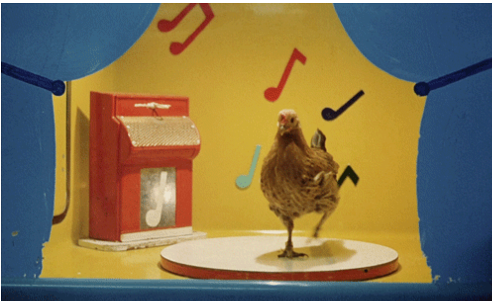
La ballata di Stroszek (Werner Herzog, 1977)

In omaggio a questa proliferazione, l'edizione americana dell'Oxford Dictionary ha eletto "GIF" parola dell'anno per il 2012. Interessante notare che a essere inclusa nel dizionario non è stata la forma sostantivata che indicherebbe il file, ma il verbo "to gif", ossia l'azione di creare una GIF: dato che la gran parte delle GIF che circolano sono prodotte a partire dal campionamento di brani video pre-esistenti, possiamo pensare che la popolarità del verbo si leghi soprattutto a questa operazione sull'immagine in movimento, che al tempo stesso la blocca e la destina a un moto perpetuo. Un'azione compiuta ogni giorno da un numero relativamente ristretto, ma sempre in crescita, di blogger e utenti di vario genere: dal cinefilo che immortala momenti memorabili nei suoi film preferiti al collettore di amenità e oscenità televisive, dall'appassionato di gattini al nerd che campiona solo cartoni animati giapponesi o videoclip anni Ottanta. Senza contare tutti coloro che poi condividono quelli immagini.