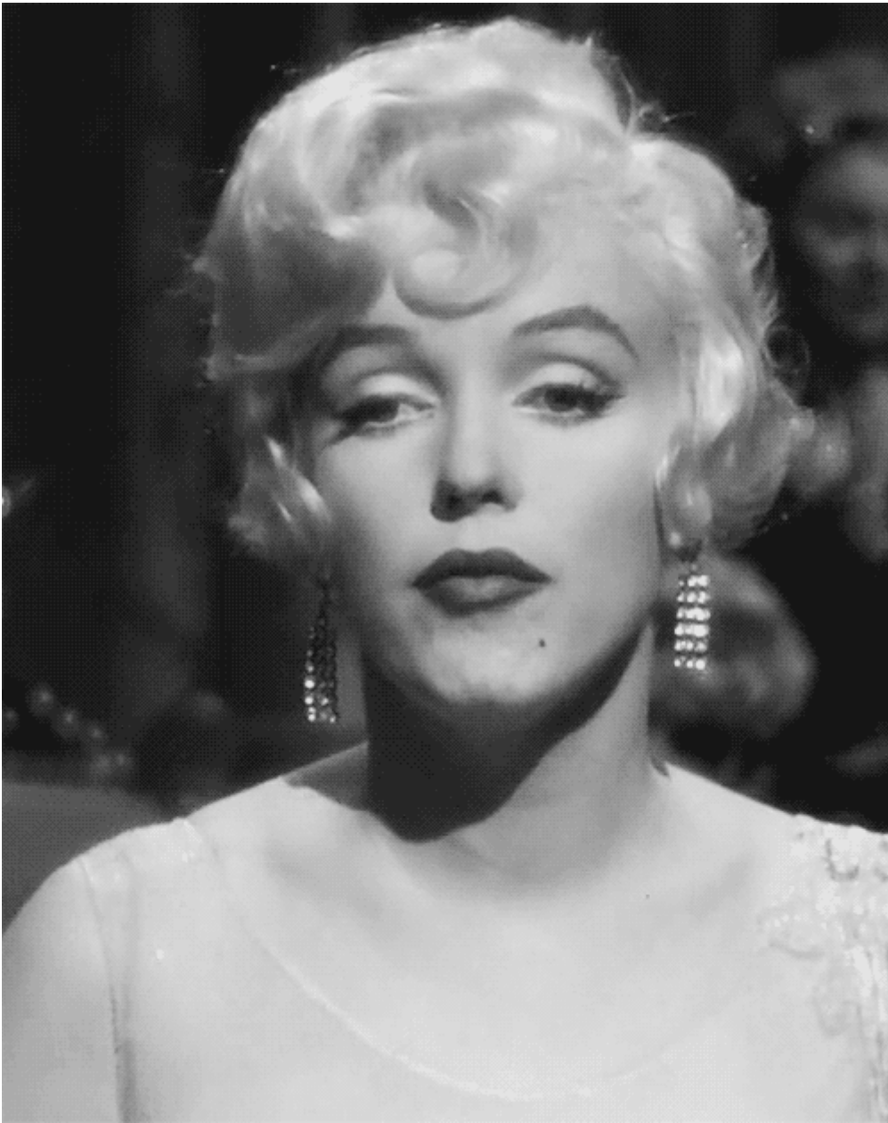
A qualcuno piace caldo (Billy Wilder, 1959)

Il .gif (Graphics Interchange Format) è un formato per immagini digitali inizialmente molto diffuso in internet, grazie alla qualità che garantiva la sua compressione: se il .jpeg l'ha ormai surclassato come standard per le immagini di definizione medio-bassa, il .gif ha fatto fortuna soprattutto componendosi in sequenze di immagini contenute in unico file, che sono state tra le prime forme animate ad aver popolato la rete. A guardarle oggi, quelle icone lampeggianti e roteanti, con la loro misera tavolozza a 256 colori e i pixel squillanti come bigiotteria pacchiana, si presentano come qualcosa di già incredibilmente arcaico e decrepito. Forse è proprio questa decadenza accelerata ad averle riportate in auge in una certa estetica contemporanea, che valorizza imperfezioni e grossolanità di un digitale non 'leccato' dall'alta definizione.