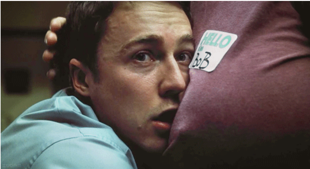
Fight Club (David Fincher, 1999)