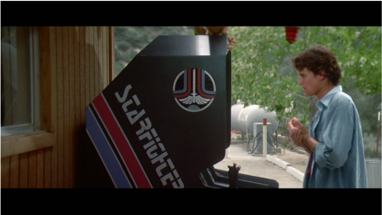
The Last Starfighter

Con gli anni, i riti, i luoghi e i modelli della fruizione videoludica sono cambiati: le sale arcade hanno abdicato in favore di altri ritrovi (virtuali), consegnandosi così alla storia per le meritate celebrazioni . Anche le coordinate dello scontro con il "sistema" sono cambiate. "Greetings, Starfighter. You have been recruited by the Star League to defend the frontier against Xur and the Ko-Dan armada", recitava il cabinet di The Last Starfighter ogni volta che Alex Rogan inseriva la monetina – ignaro del fatto che quella guerra interstellare fosse tutto fuorché una simulazione ( The Last Starfighter , Nick Castle, 1984).